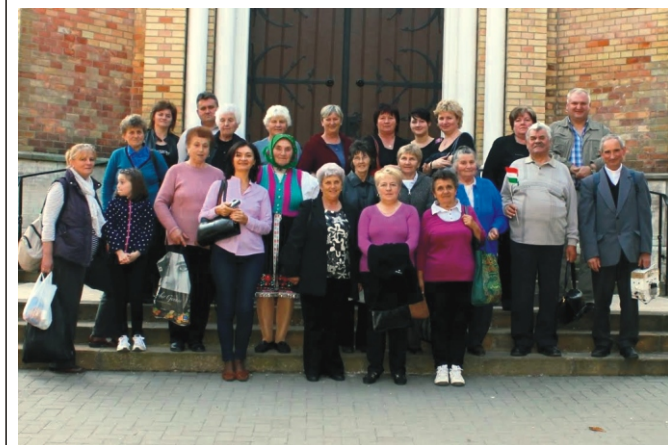
A kiránduláson résztvevők csoportja

Nagyon elfáradtan, de lelkiekben feltöltődve, élményekben gazdagon étünk haza a késő esti órákban. Remélem több ilyen kirándulásra is sor fog kerülni az elkövetkező időkben. Köszönjük ezt a napot! Vné PG