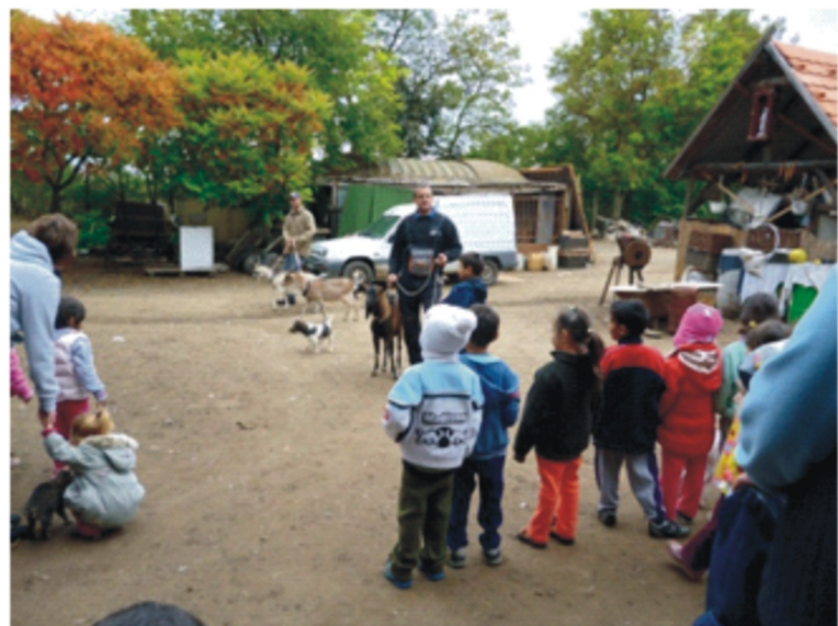
Az Annus tanyán sok állatot láttunk