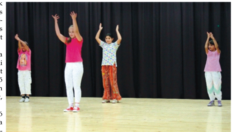
A zumbás csoport

Novemberi programok az IKSZT-ben: November 15. szombat - TELEPÜLÉSI ÉRTÉKTÁR BEMUTATÓ ÉS KIÁLLÍTÁS November 28. péntek - TÁRSASJÁTÉK EST