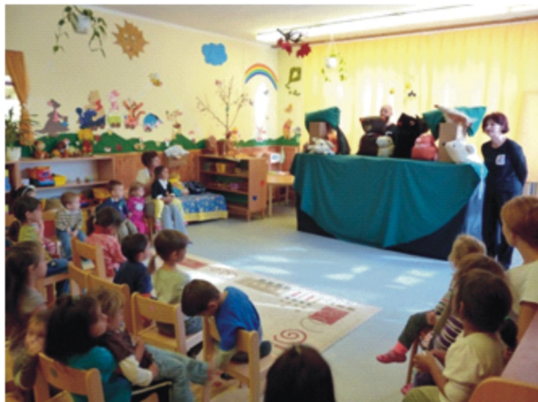
A „párnabábos” előadás nagyon jó volt!

Hasonlóan nagy élmény volt gyermekek számára a „Szivárványhét”, amit már több éve megrendezünk ilyenkor ősszel. Ha most színes oldalakkal jelenne meg ez az újság, akkor az olvasószámára is olyan élesen látszódná, hogy idén a „kis-körte” csoport milyen szép pirosba, a „középső-cseresznye” csoport sárgába, a „nagy-alma” csoport pedig kék színben pompázott. Ilyenkor úgy dekoráljuk a csoportot, olyan színű játékokat gyűjtünk, az egymásnál való vendégségben olyan színű ételeket, eszünk, italokat iszunk, ami azonos a választott színnel. A projekthét végén, közös munkadélután szerveztünk a szülőkkel, ahol a gyermek együtt készíthetett apával, vagy anyával, valami szépet, természetesen olyan színben, amit a csoport választott. Célunk ezzel a programmal, hogy tudatosítsuk a gyermekekben a színek ismeretét, miközben a szülőket is bevonva közösen gyarapítsuk tudásukat játékos módszerekkel.