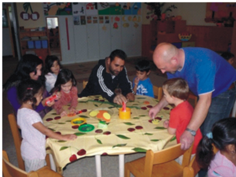
A szülői munkadélutánon apukák is részt vettek

Az éves tervünkben igen sok, változatos program szerepel, melyek megvalósításával igyekszünk a gyerekek mindennapjait színesebbé, még élmény-szerűbbé tenni. Az október sem telt el programok nélkül. Október 4-e az Állatok Világnapja alkalmából, „Barátaink az állatok” projektnap keretében a gyerekek részesei lehettek egy tanyán való látogatásnak. Szécsényben az Annus tanyán természetes környezetükben figyelhették meg az ott élő állatokat. Érdekes és tartalmas túravezetést kaptunk és minden gyermek lovagolhatott is. Visszatérve az óvodába az elkövetkező napokban tovább bővítettük a gyerekek ismereteit az állatokról, beépítve a tanyán szerzett tapasztalatokat, hiszen a mai gyermekek már itt falun sem találkoznak mindennap az állatokkal.