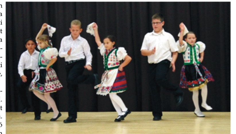
A rimóci csárdás közben