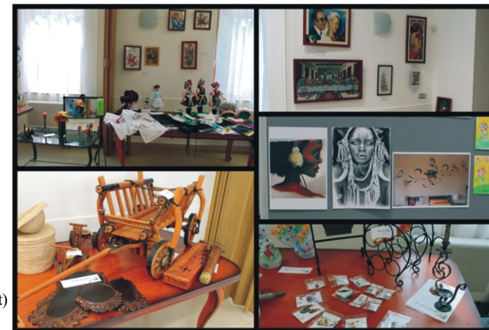
Részlet a rimóciak sokszínű és sokrétű alkotásaiból

A Múza Művészeti Fesztivál következő járási elődöntője Rimócon kerül lebonyolításra Tánc kategóriában október 25-én a Dr. Manga János Községi Ház-IKSZT-ben. Várjuk a mindazok jelentkezését, akik meg akarják mutatni tánctudásukat, és természetesen azokat, akik szívesen részt vennének nézőként ezen az eseményen! B-VÁ