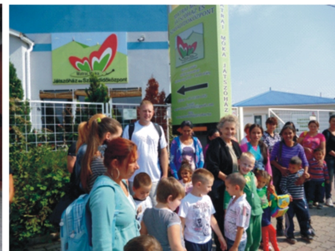
A Játsszínház bejáratánál

„Emberek, hej, emberek... Virít-e a kertetek?”