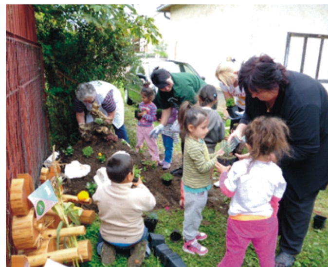
Készül a sziklakert