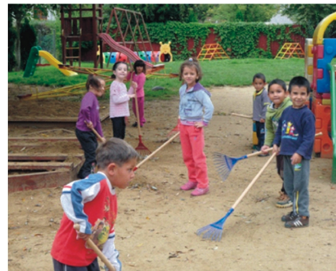
A lombseprűkkel megtisztítjuk az udvart