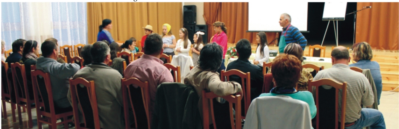
A közönség segítségével előadott mese

A mesék után kis szünet következett, majd közös kép- és videó nézegetés vette kezdetét a Lengyelországi látogatásról. Mindenki vidáman emlékezett a közösen eltöltött szép időre, valamint azok is betekintést nyerhettek az ott töltött néhány napba, akiknek nem volt lehetőségük az utazásra.