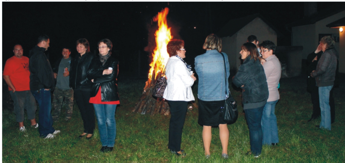
A Szent Mihály napi tűzgyújtás

Tovább folytatódnak a Települési Értéktár összegyűjtésére irányuló munkálatok. Folyamatosan gyűjtjük azokat az értékeket, melyek meghatározóak a településen. Az összegyűlt értékeket november 15-én egy kiállítás és bemutató alkalmával mindenki megismerhet. Vegyünk aktívan részt a gyűjtésben, hiszen ez mind a MI közös értékeink!