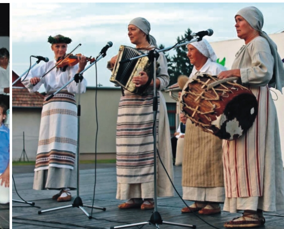
A lett delegáció zenekara