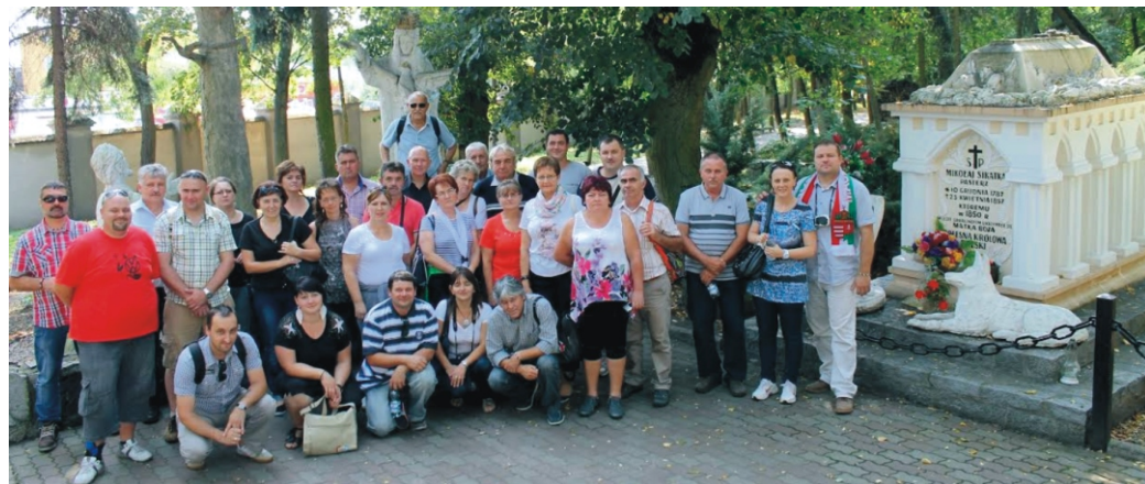
A rimóci delegáció Dlutow polgármesterével Lichen Stary egyik emlékhelyénél

Másnap a reggeli után buszra ültünk és elindultunk Dlutowtól kb. 120 km-re lévő Lichen Stary városába. Ekkor szembesültünk azzal a ténnyel, hogy Lengyelországba a km-t nem egészen úgy számolják, mint nálunk, de miután megláttuk jövetelünk célját, szemünk-szánk tátva maradt az ámulattól. Egy olyan zárandokhelyre értünk, amely a lengyel nép összefogásáról, elszántságáról, őseik iránti tiszteletéről és kitartásáról tanúskodik. Egy idegenvezető segítségével megismerhetjük a hely történetét. A régi templom varázsától csak nehezen tudunk elszakadni. A Golgota csodálatos magasztossága, a hősökért állított szobrok, emlékművek csodálatos töltötték el. Aztán elértünk arra a helyre, ami igazán ámulatba ejtett. A hatalmas Bazilikát az ezredfordulóra építették, mindössze 10 év alatt, Isten dicsőségére felajánlott magánadományokból. A bazilika aulájában elhelyezett táblák a lengyel nép összefogásáról tanúskodnak, több ezer adományozó neve került fel a falakra. A torony magassága 141 méter, 762 lépcső vezet fel és csodálatos kilátás nyílik a környékre. Volt, aki lifttel, volt, aki lépcsőn tette meg ezt a távot, de bátran mondhatom a kilátás kárpótolt a fáradságunkért. Ezt követően finom, bőséges ebéd következett majd visszaindultunk a szállásra.