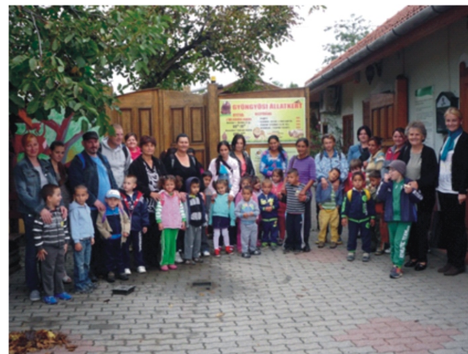
A Gyöngyösi Állatkert előtt

A gyöngyösi állatkert az egyetlen Magyarországon, amelyik magánkézben van. Ezért is lehetett ott az az érzésünk, mintha valakinek a tanyáján lettünk volna. Előnye