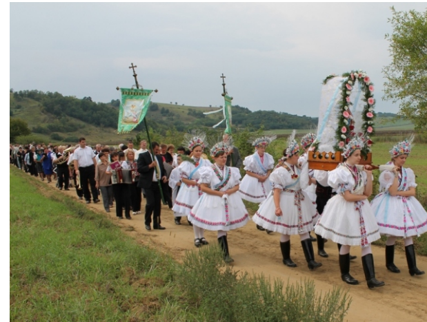
Hazafelé a Fogadalmi kápolnától