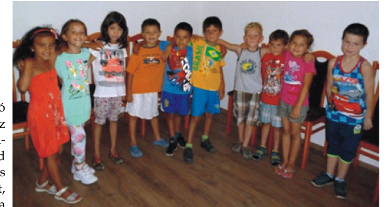
Fellépés után a gyerekek