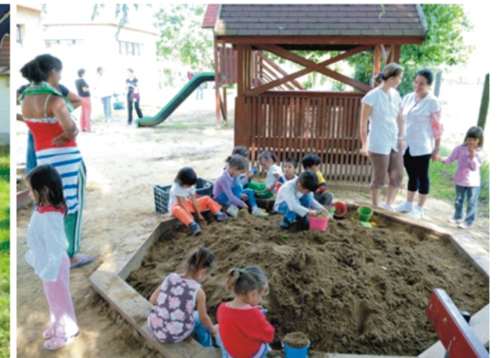
Készül a homokvár!