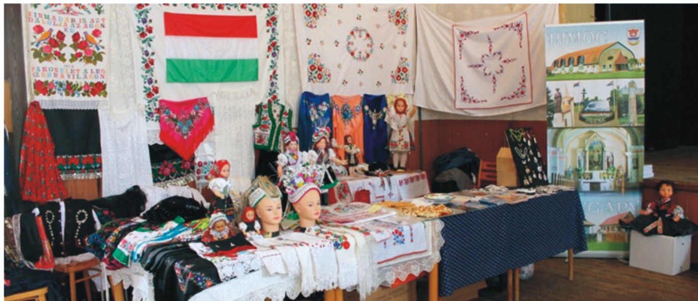
Igyekeztünk minél többet bemutatni Rimócról