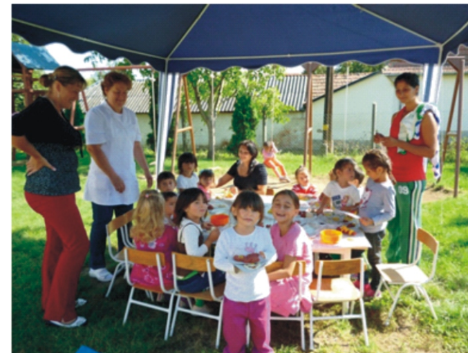
A gyurmázó asztalnál nagy volt az érdeklődés