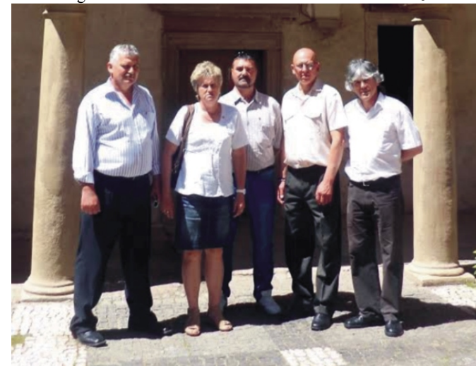
Megtekintettük Rosice kastélyát