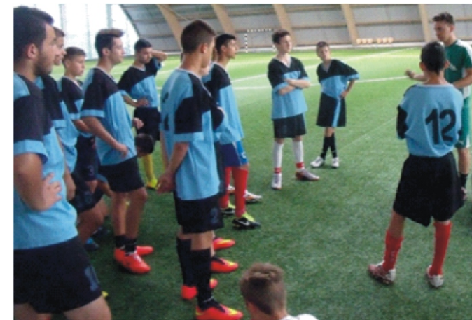
Edzés közben eligazítás a műfüves pályán