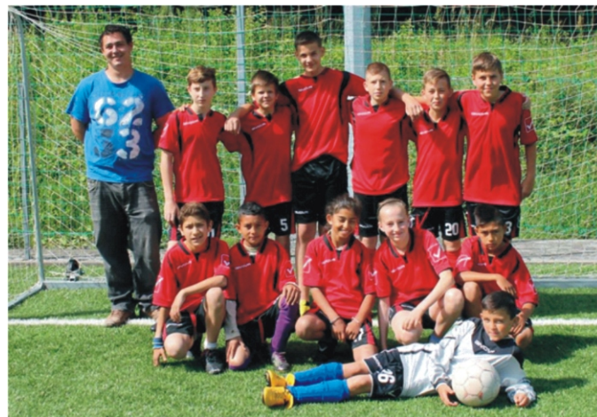
U13-as utánpótlás csapat 2014. 06. 01. Salgótarján, műfü