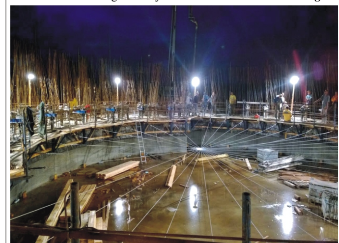
Egyedülálló, csúszószalag technológiával készítették a medencék falait, éjszaka is folyt a munka