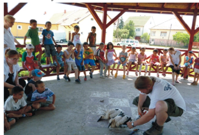
A kis gólyák nyugodtan viselték a meggyűrűzés folyamatát