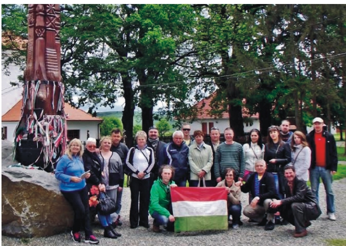
Csoportkép a Trianon emlékműnél