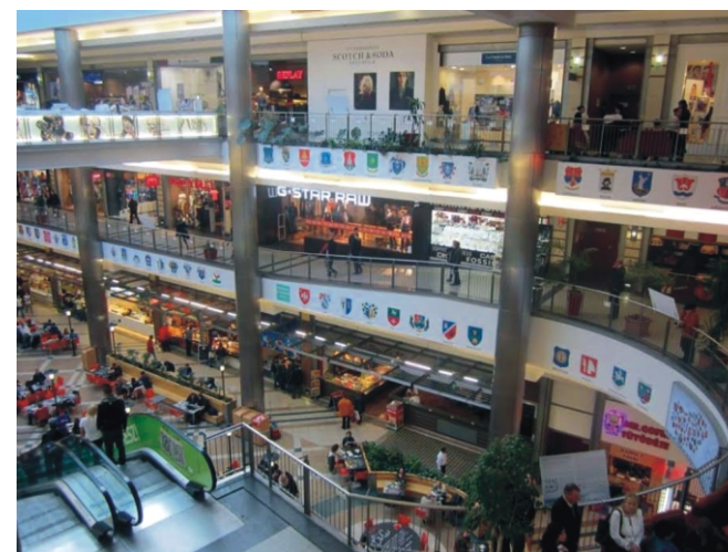
A bevásárlóközpontban nyílt Címerkiállítás részlete