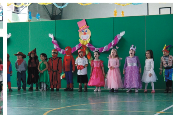
Próbáltuk a versünket jó hangosan mondani