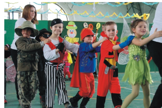
A nagycsoportos bálozók egy része

A kis bálozók örömmel bújtak a kedvenc mesehősük, illetve más bőrébe, büszkén viselték a jelmezeket.