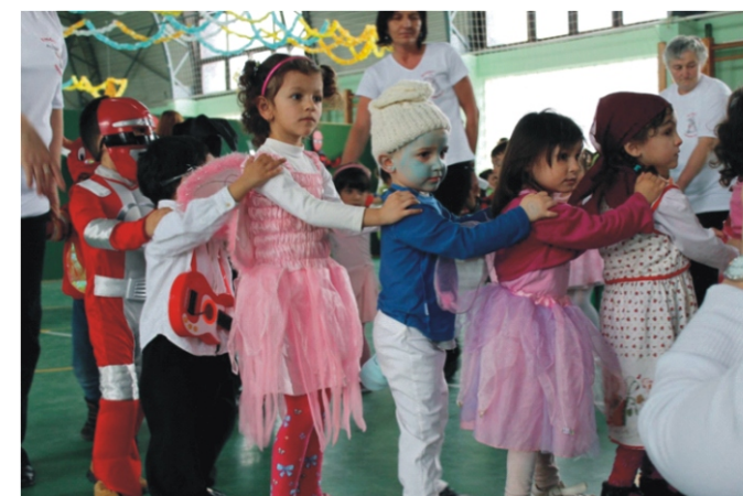
A kicsik is ügyesen vonatoztak