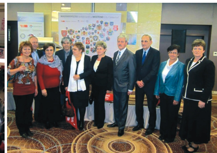
Nógrád megyei polgármesterek a kiállítás megnyitóján