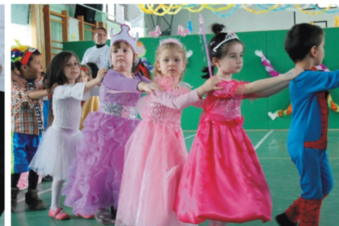
Középsősök vonatozás közben