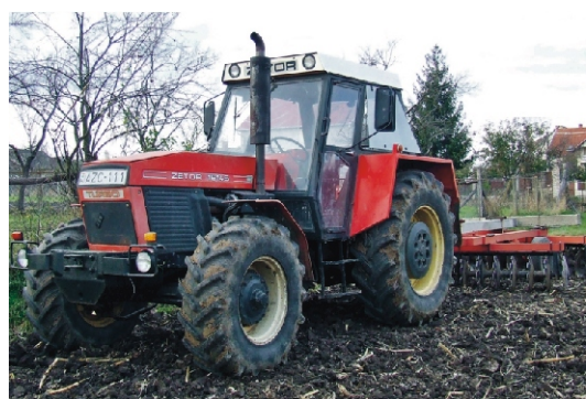
Az önkormányzat most vásárolt erőgépe