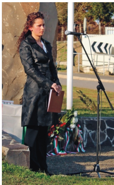
Vincze Szandra műsorközlő