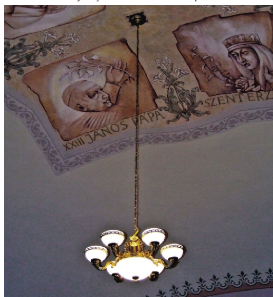
Lengyel tetstvértelépülésünk - Dlutow - egyik ajándéka a rimóci római katolikus templomnak