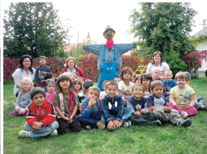
„Tökfilkő” és „ALMA” középső csoportosok