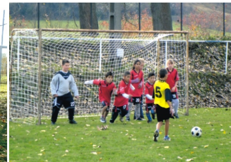
Az U11-esek szabadrúgást védnek