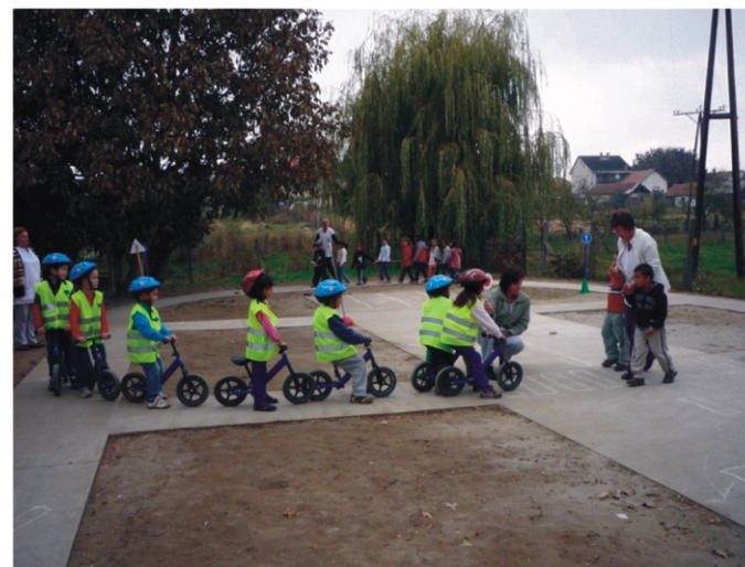
A közlekedési szabályokat betartva közlekedünk az új pályán

A pályaszakasz megvalósulását azoknak a jótékony szülőknek köszönhetjük, akik az elmúlt években részt vettek az óvodai jótékonyági farsangi bálunkon. Több éves báli bevételből 320 ezer forint gyűlt össze, amiből ezt megtudtuk valósítani. Köszönet az Önkormányzatnak is, hogy a kivitelezést megszervezte és a munkálatokat