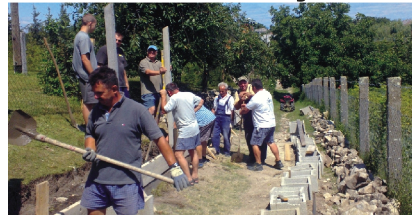
Összefogással épült a plébánia hátsó kerítése