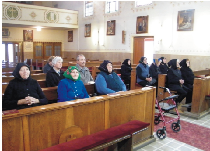
A Szalézi Szent Ferenc templomban