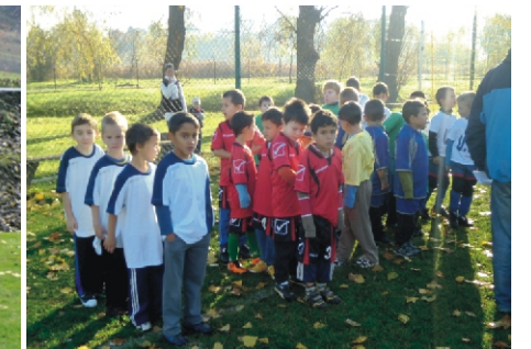
A legkisebbek (U7) a csapatba sorolásra várnak