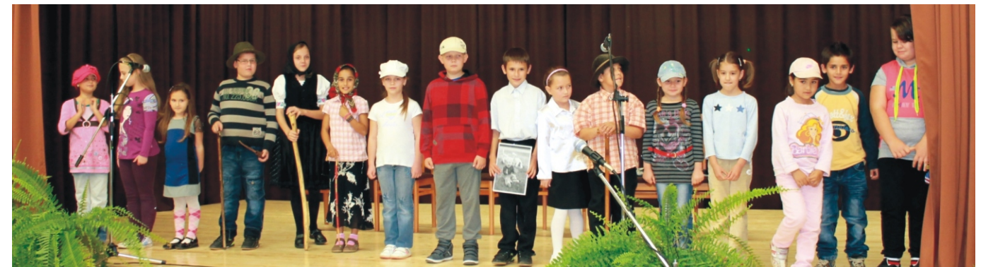
A műsort adó iskolások