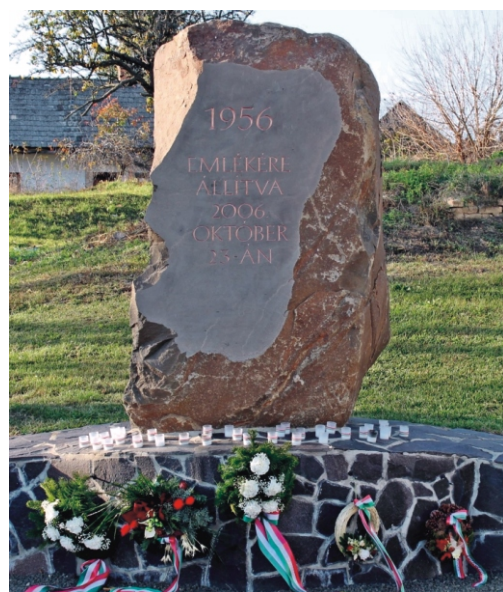
Az emlékezők koszorúi és mécsesei