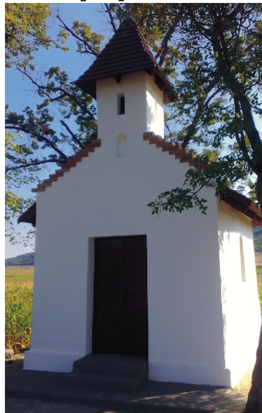
A felújított hollókői úti kápolna