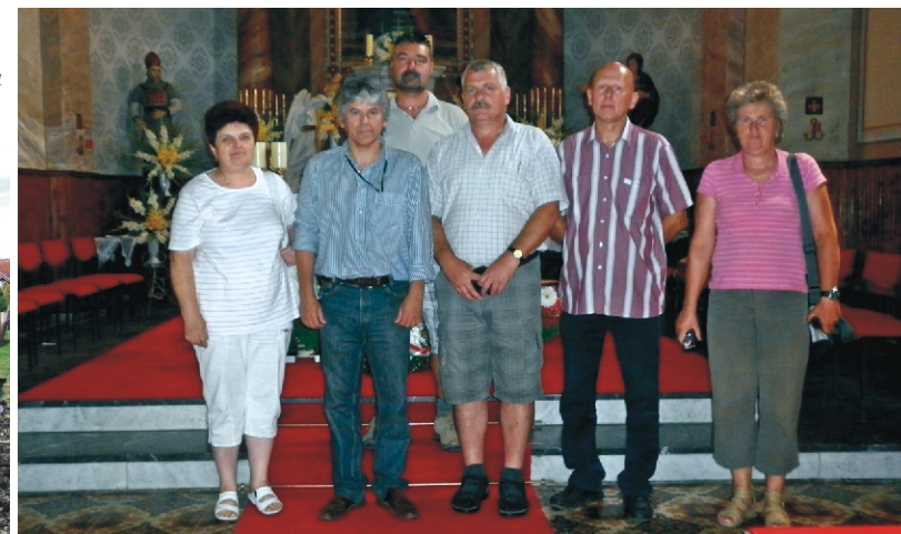
A rimóci képviselő-testület a kupaszinai Szent Anna templomban