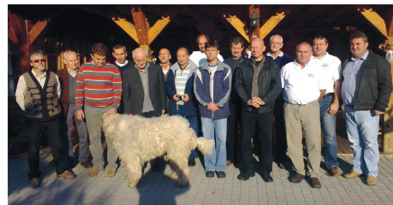
A Rimóci Szent József Férfiszövetség négy tagja a kállói lelki gyakorlaton