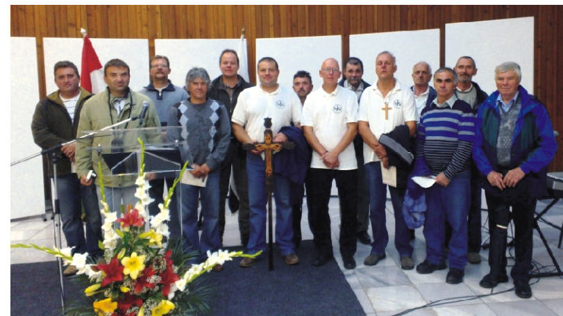
Rimóci Férfiszövetség tagjai a salgótarjáni Kálvária szentelésén