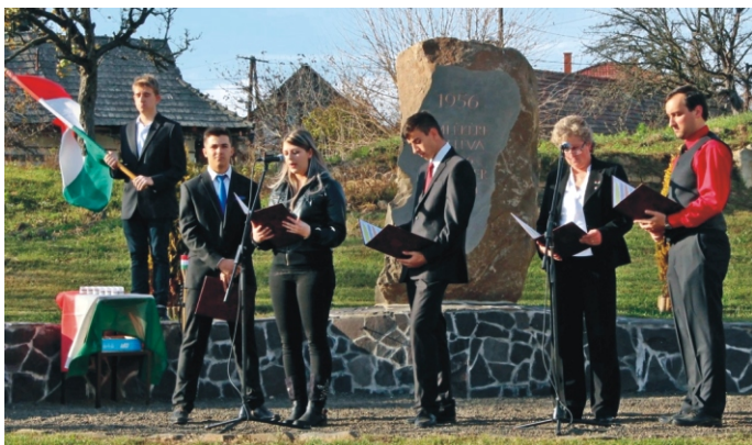
Ünnepi műsor az 56-os hősök emlékére