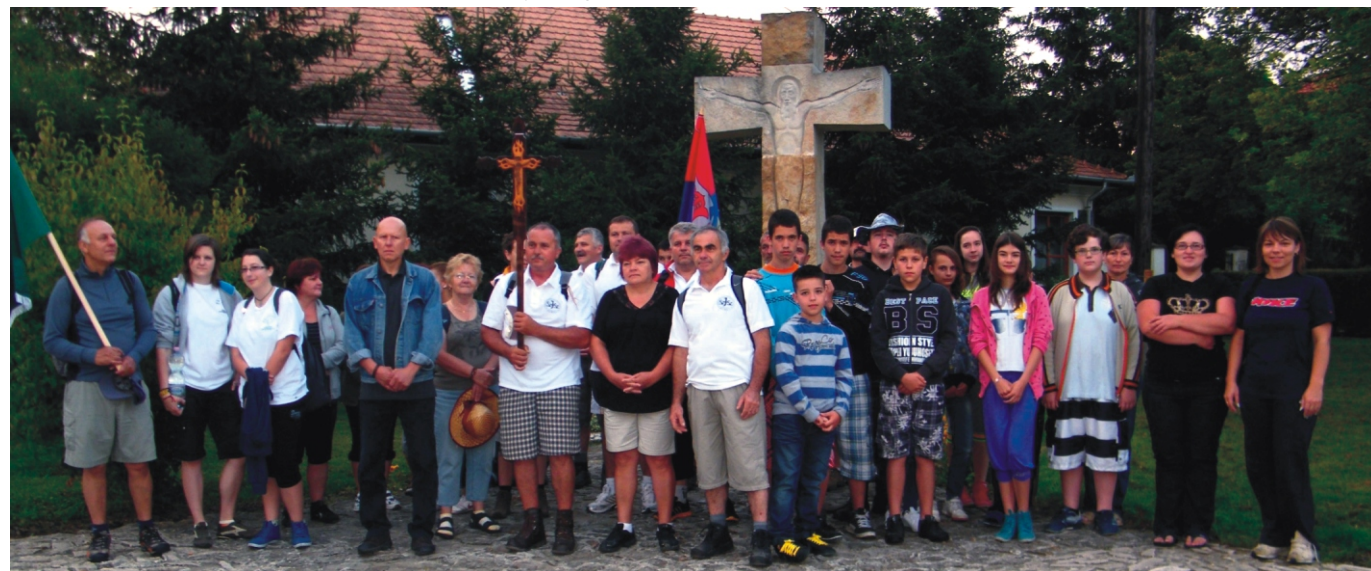
„Táborosok” csapata a Herencsénybe induló gyalogzarándokokkal