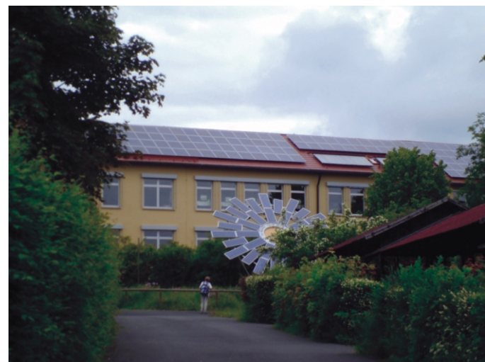
Napelemek az iskola épületén