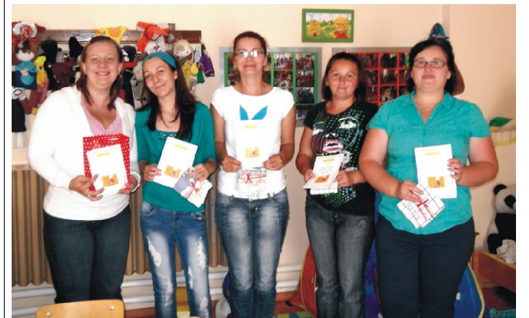
A főzésben résztvevők