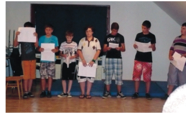
Fiúk előadás közben