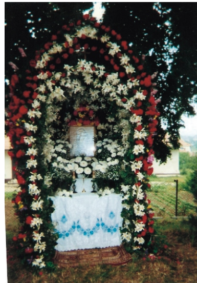
Néhány évvel ezelőtti gulyiba