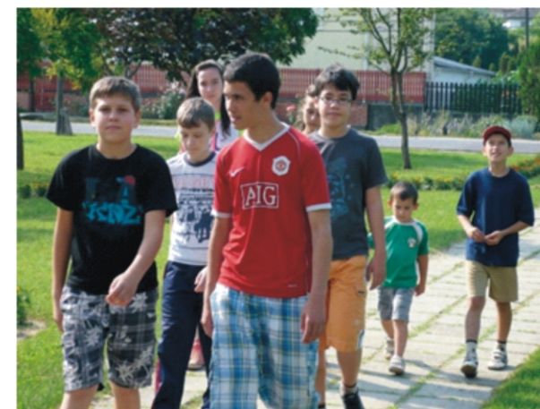
„Táborosok” csapata úton az állomás felé