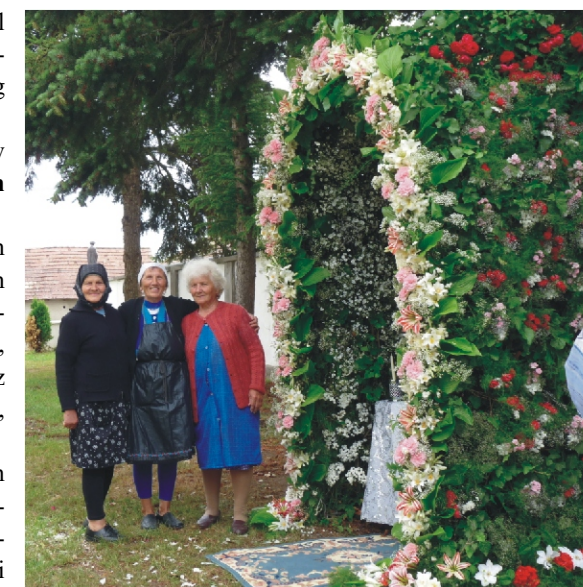
Gulyiba 2012-ből és készítői