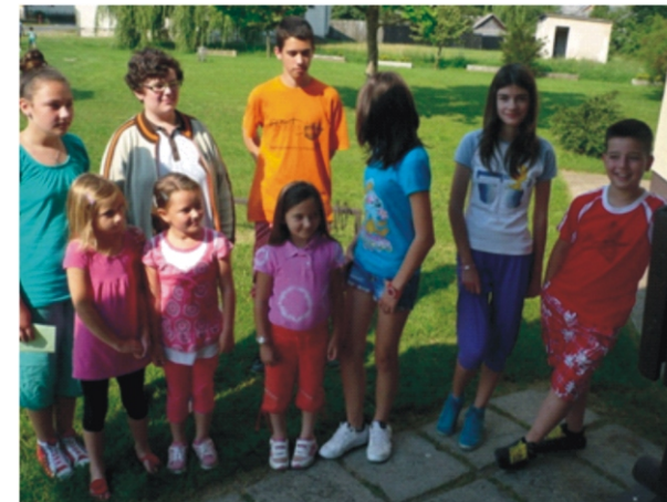
„Barna macik” csapata az egyik állomáson