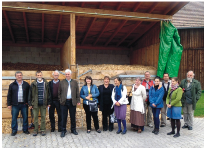
Részvevők a német vendéglátókkal