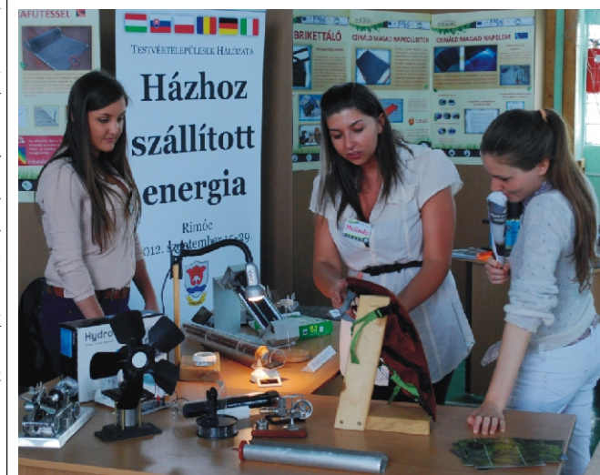
Rimóci fiatalok is segítettek a kiállítás megvalósulását

Rimóci Szent István Óvoda a közalkalmazottak jogállásáról szóló 1992. évi XXXIII. törvény 20/A. § alapján pályázatot hirdet Óvodapedagógus munkakör betöltésére.