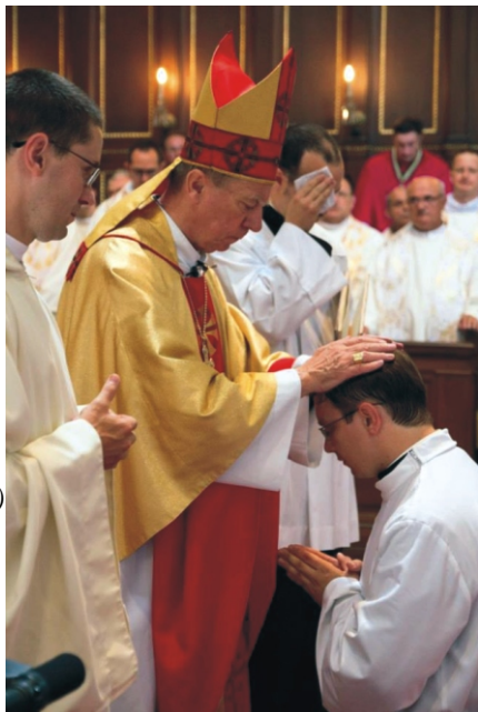
A püspöki áldás