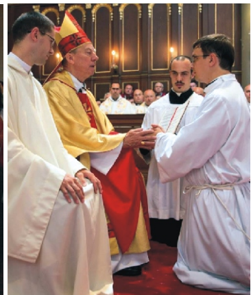
A püspöki kézfogás