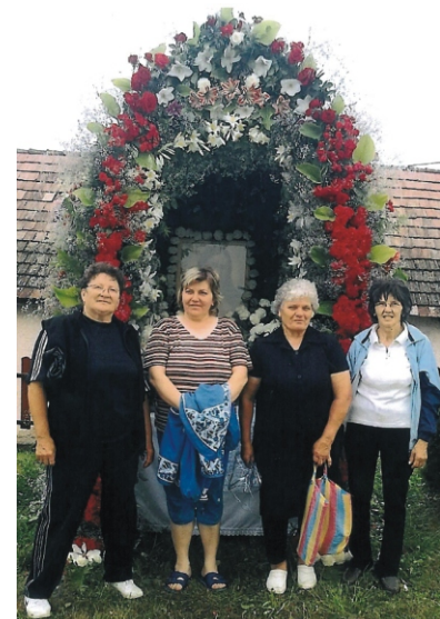
A 2012. évi gulyiba előtt készítői

- A mise után a belső részt, a gyertyákat bevisszük egyből a templomba, de a virágokat csak délután megyünk leszedni. Azokat a temetőbe szoktuk szétvinni a sírokra és vannak, akik visznek a szentelt virágból haza is, hogy ezzel megvédjék a házat a villámcsapástól. Régebben a zöld ágakat is haza vitték, gyújtósnak használták és eltűzelték. Ezt is azért tették, hogy megvédjék a házat a villámcsapástól