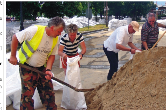
Folyt a munka gözerővel