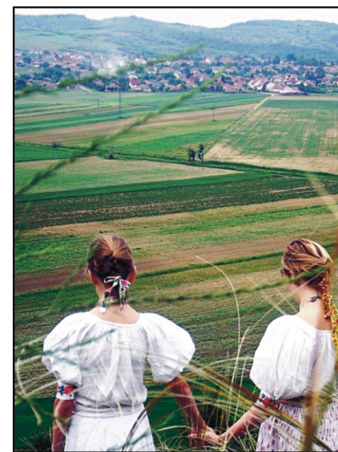
A „Reménység” című nyertes kép