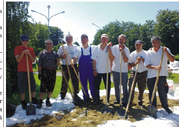
Elkelt a sok dolgozó kéz