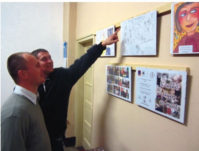
A kiállítás most is megtekinthető a klubban

A Rimóci Ifjúsági Egyesület 2012 októberében nyújtotta be „Család, ahogy mi látjuk” című pályázatát az ALDI Magyarország Élelmiszer Bt. „Szövetség az ifjúságért – 2012 – A fiatalok és a család éve” című pályázati felhívására. Projektünk keretében egy olyan programsorozatot alakítottunk ki, amelyben összegyűjtöttük a különböző korosztályok véleményét, elképzeléseit a családról, az ehhez kapcsolódó életszakaszokról. A rajz és fotópályázat meghirdetésére 2013. év elején került sor, ez indította a projektet. A megadott határidőig összesen 65 fotó és 57 rajz érkezett be egyesületünkhöz. Többen az ország távolabbi részeiről, művészeti iskolákból is küldtek alkotásokat, melyeket nagy örömmel fogadtunk, illetve a helyi és környékbeli iskolák is szép számmal küldték az alkotásokat. A fotókat és alkotásokat egy művészből és képalkotó szakemberekből álló négytagú zsűri értékelt. A közönségzavazás a Facebookon zajlott, ahol a fotókra és rajzokra összesen több mint 2000 szavazat érkezett. A