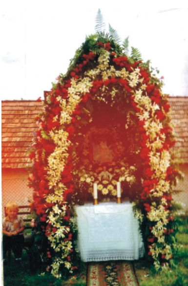
Gulyiba a korábbi évekből