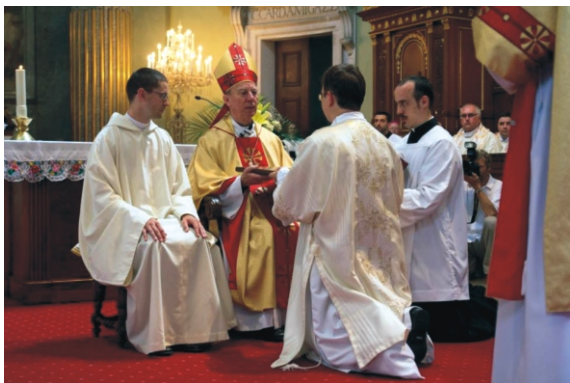
„Amit olvasol, hidd...”