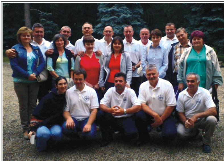
A Váci Férfiszövetség meghívására a Püspöki Palotába látogató rimóci csoport