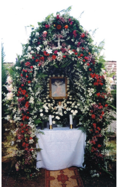
Egy színeken gazdag gulyiba