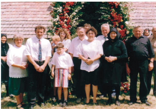
Gulyiba az 1996. évből a készítőivel