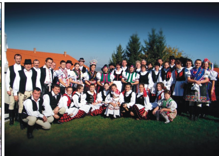
A közönségszavazás „Nem választ el a határ” című kép