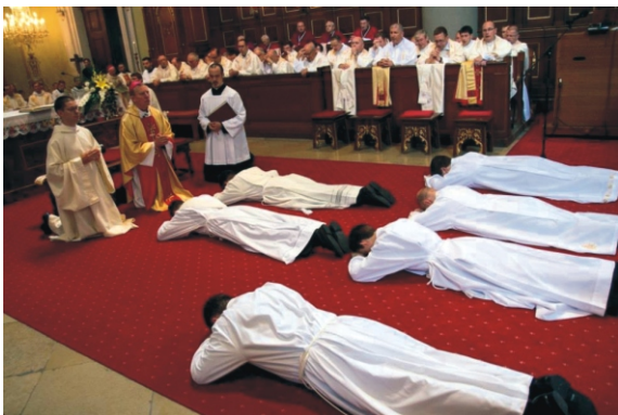
Az egyik legmeghatóbb pillanat