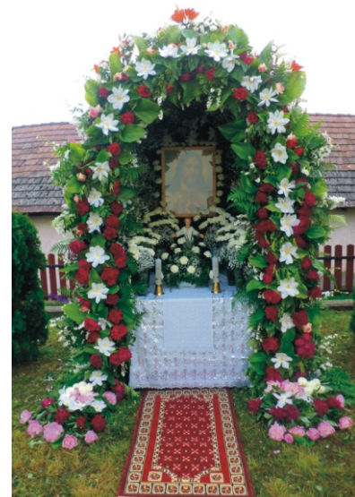
A 2013. évi gulyiba

- Gondolja, hogy lesz, aki továbbviszi majd a hagyományt?