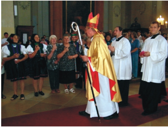
A püspök atya a rimóci asszonyokat köszönti