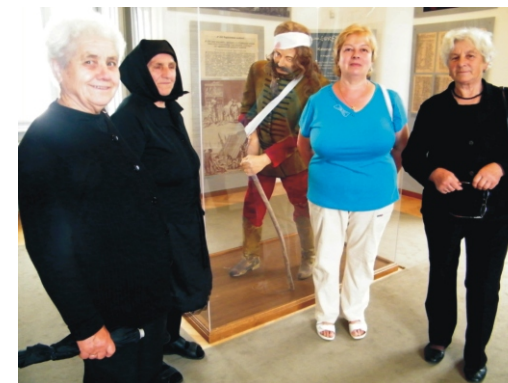
A kiállítások felelevenítették a régi korok világát