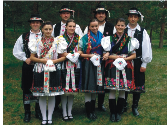
A rimóci delegációt képviselő táncos párok