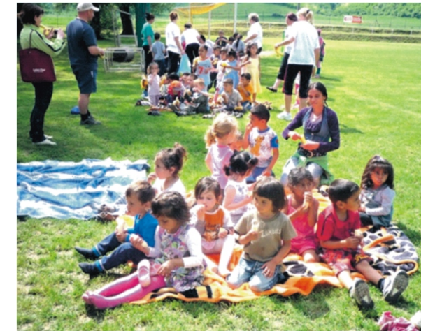
A versenyek közti pihenő

Az óvoda udvarán gyülekeztek a gyerekek és a szülők, majd együtt indultunk a Sportpályára. A sportnap kezdeteként felvettük a „nyúlcipőt”, bemelegítettünk, majd zenés tornával folytattuk. Aztán játékos feladatok következtek, melynek a végén a szülők és