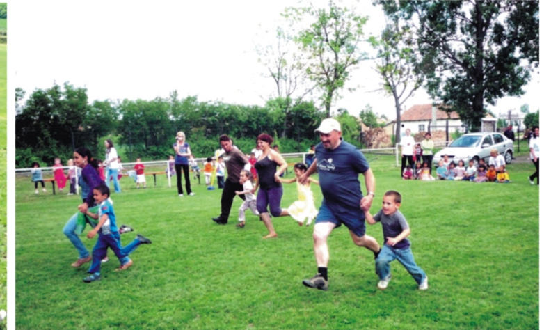
„Vajon ki lesz az első?”