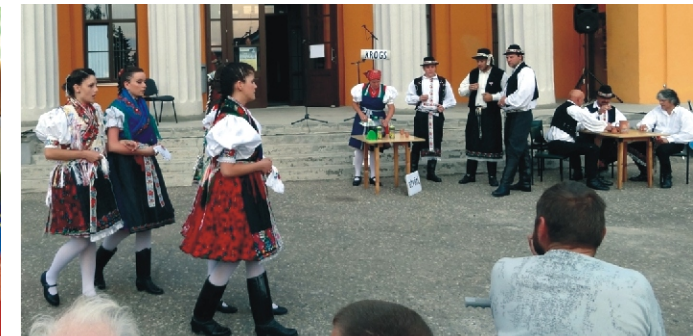
A rimóci csoport fellépés közben