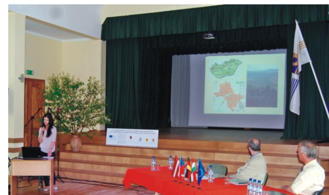
A konferencián bemutattuk településünket