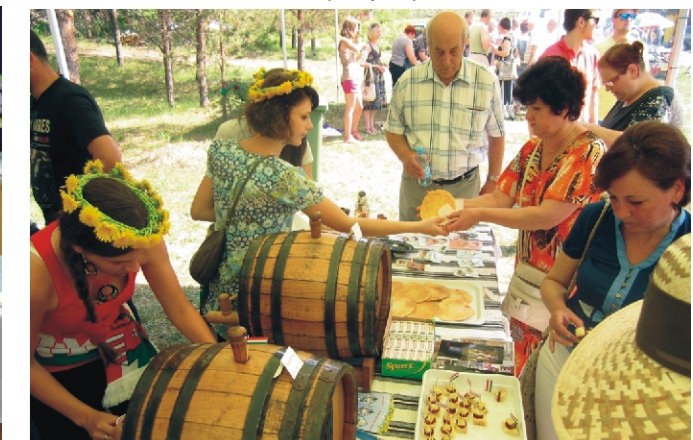
Népszerű volt a „Rimóc-sátor”