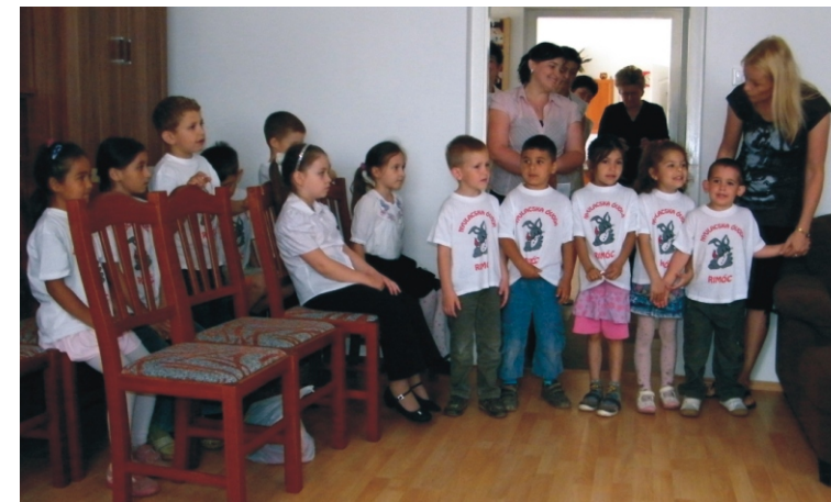
A gyerekek műsor közben

Az év egyik legszebb ünnepei közé tartozik az anyák napja, amikor köszönhetjük az Édesanyáknak, Nagymamáknak. A Gondozási Központban is nagy figyelmet szántunk ennek a szeretetteljes ünnepnek, hiszen anya csak nő lehet, ez az ő kiváltsága, az ő hivatása. A legszebb, de egyben legnehezebb hivatás is, hiszen soha nem ad szabadságot, soha nem enged pihenőt, állandó figyelmet, odaadást, szeretetet vár el, ám mégis szép. Csak az Édesanyák ismerik azt a titkot, hogy miként válhat egy élet önálló emberré.