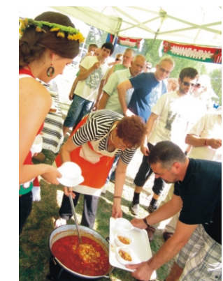
A rimóci gulyás