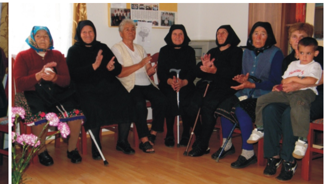
A műsor is könnyeket csalt a szépkorúak szemébe