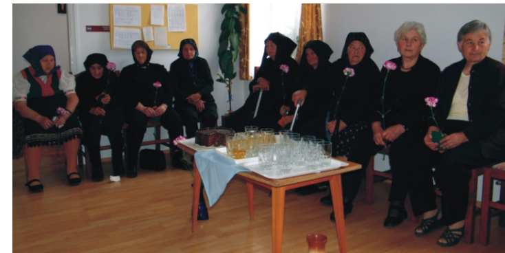
Az idősek meghatódva fogadták a gyerekektől a virágot