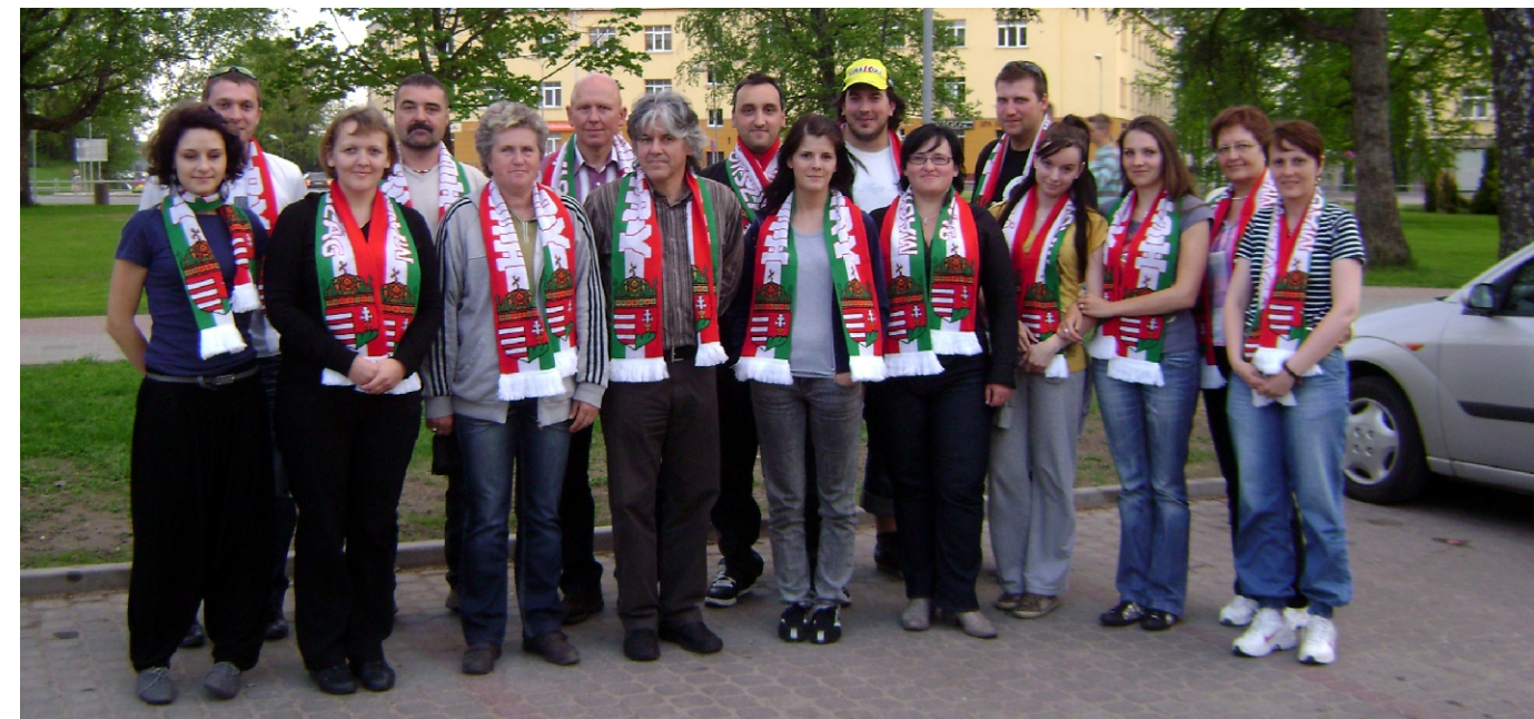
A rimóci delegáció