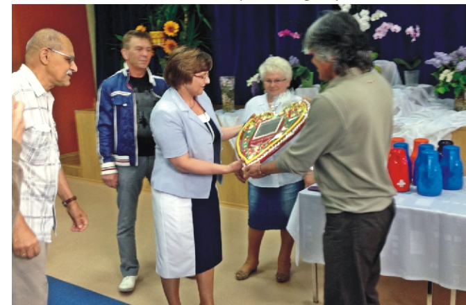
Dlutowban mézeskalács szívet adtunk ajándékba