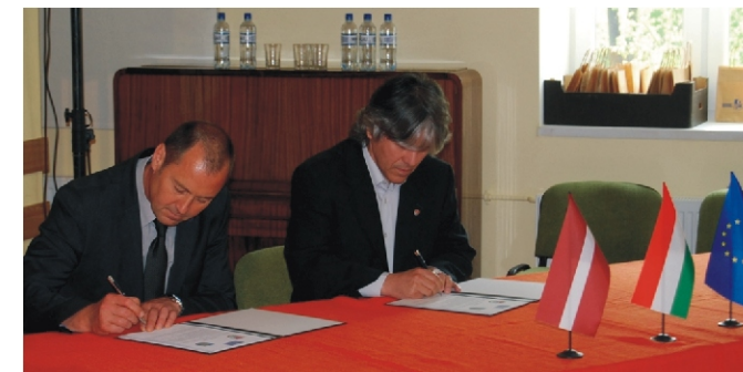
Aláírták a testvértelepülési megállapodást