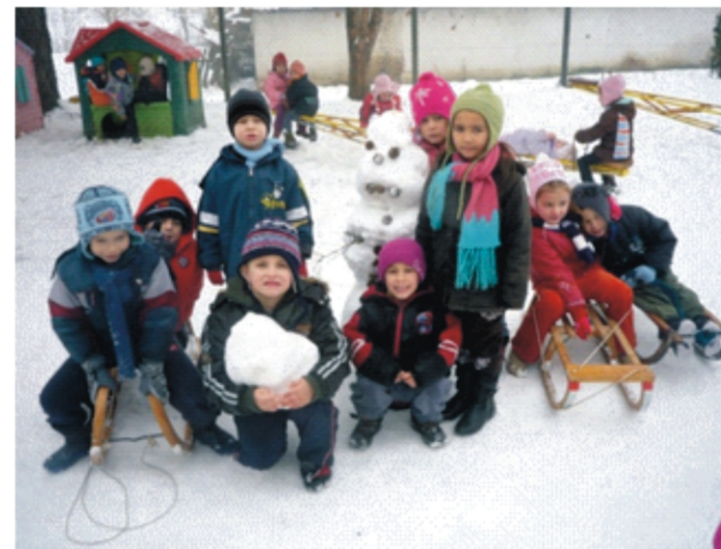
Elkészült a hóember