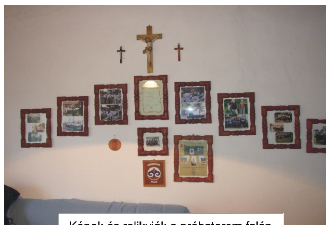
Képek és relikviák a próbaterem falán