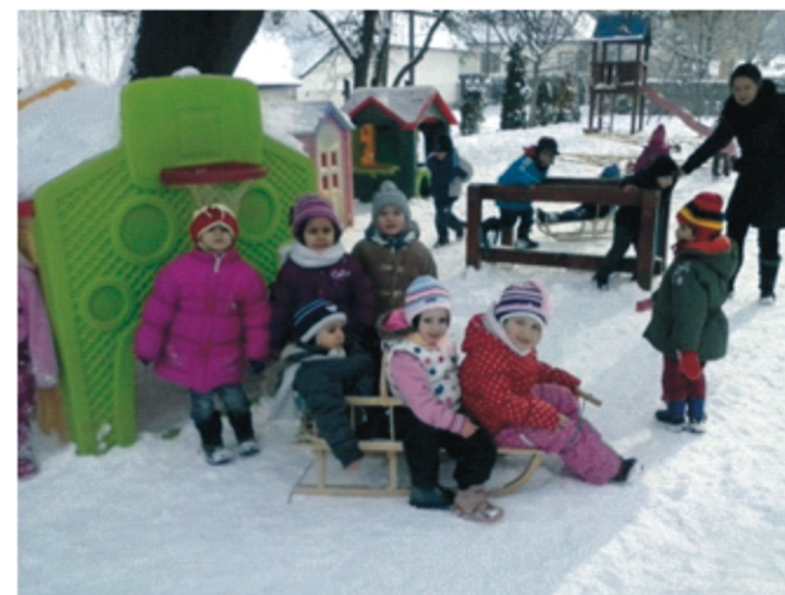
Kifáradtunk a szánkózásban