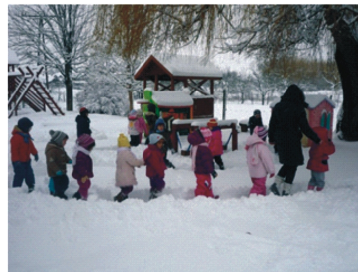
Séta a hólabirintusban