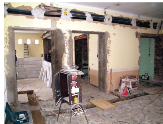
A nagyterem bejárata az előtérből

Az egyesület még nem kapta meg az első, leigényelt támogatást, így újbóli hitelkérelmet nyújtott be a Szécsény és Környéke Takarékszövetkezetnek, hogy a vállalkozó második részszámláját is ki tudja fizetni. Ez egy újabb 14.500.000 Ft-os hitelvállalás. Természetesen egy ilyen civil szervezet, mint a mi egyesületünk, ekkora hiteleket csak kivételes esetben kaphat. Kell hozzá a támogatási határozat és az, hogy az önkormányzati képviselő-testülete ott álljon az egyesület mögött. Úgy érzem, hogy ez a beruházás példaértékű az önkormányzat és a civil szervezetek együttműködését tekintve, hiszen az önkormányzatnak szüksége volt az egyesületre, az egyesületnek pedig az önkormányzatra, hogy a falu érdekét szem előtt tartva, közösen, egymást támogatva érjék el a célt, egy új, nagyobb közösségi teret a lakosság számára.