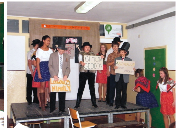
7. osztályosok műsor közben