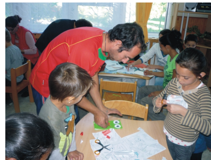
Készülnek a kis játékok