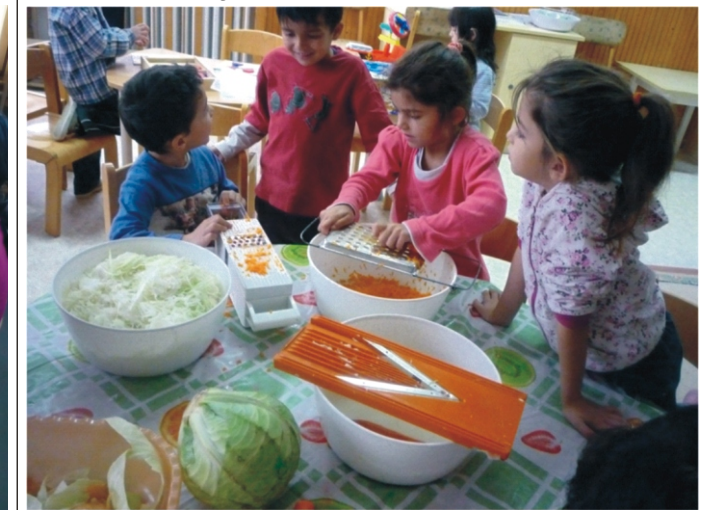
Készül a finom káposztasaláta