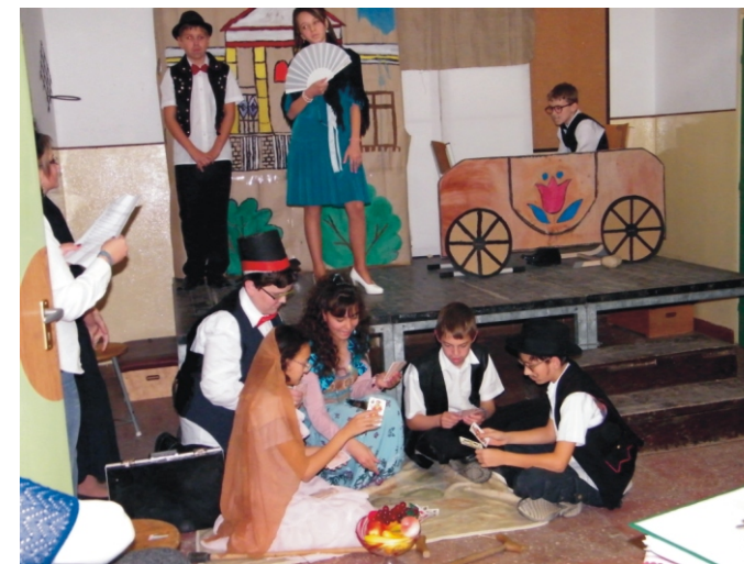
6. osztályosok előadás közben