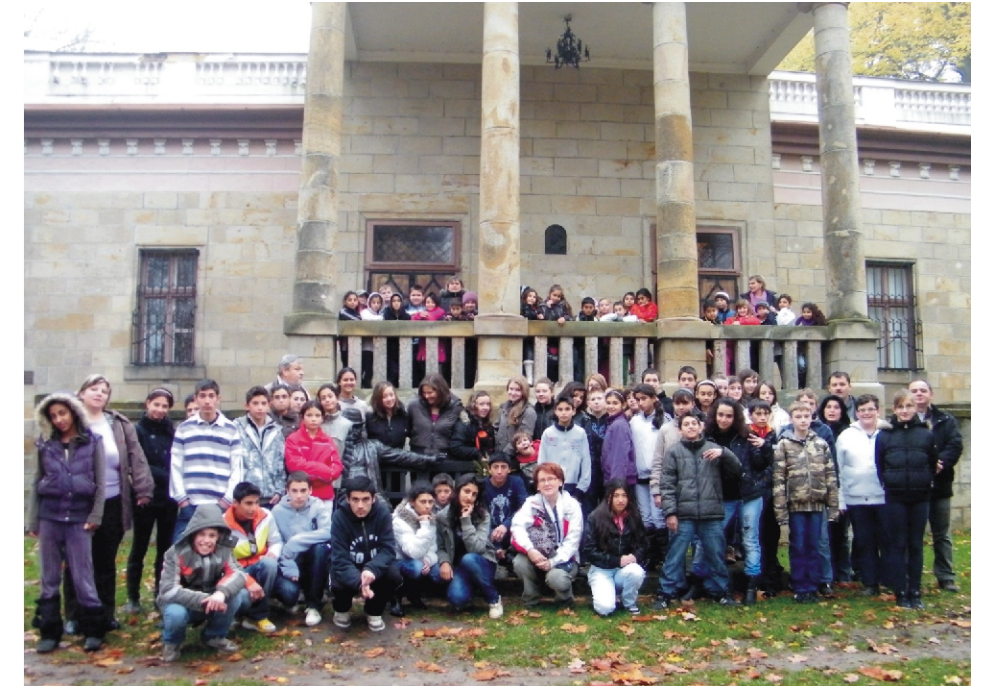
Horpácson a Mikszáth-kúria előtt