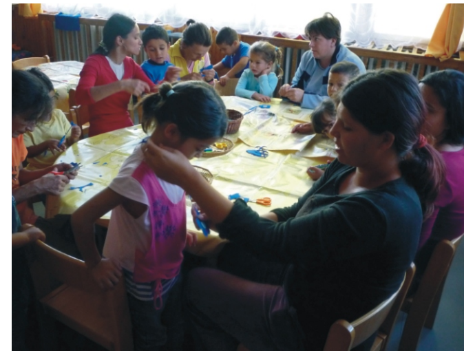
Barkácsdélután a szülőkkel

Egy-egy ilyen, tartalmas, mozgalmas projekt-hét nagy élményt nyújt a gyerekeknek, ezért arra törekszünk, hogy a nevelési évben minél több hasonló programot tudjunk megvalósítani.