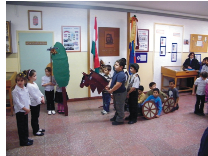
Első és második osztályosok műsor közben