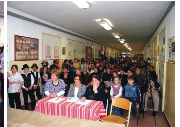
A zsűri tagok és a nagylétszámú közönség