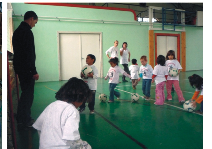
Mindenki gólt akar rúgni