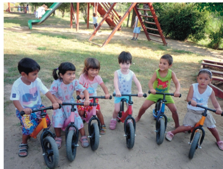
Indul a verseny