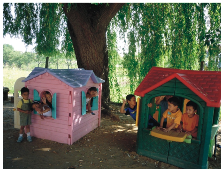
Sok jó gyerek kis helyen is elfér