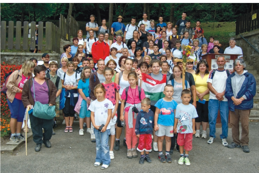
A rimóci gyalogzarándokok a Szentkúton