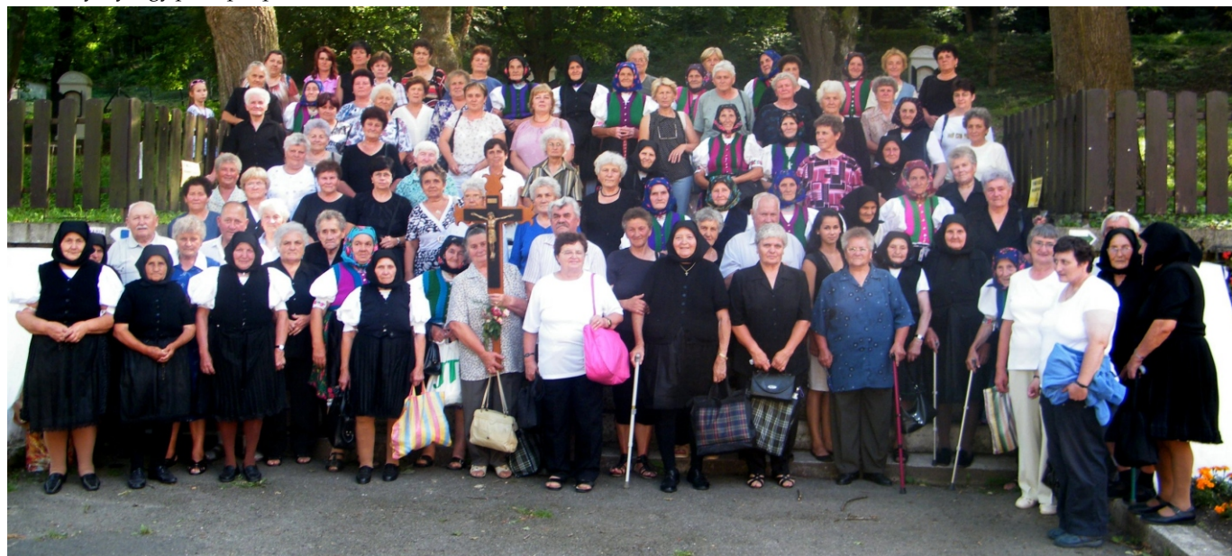
A rimóci zarándokok a Szentkúton