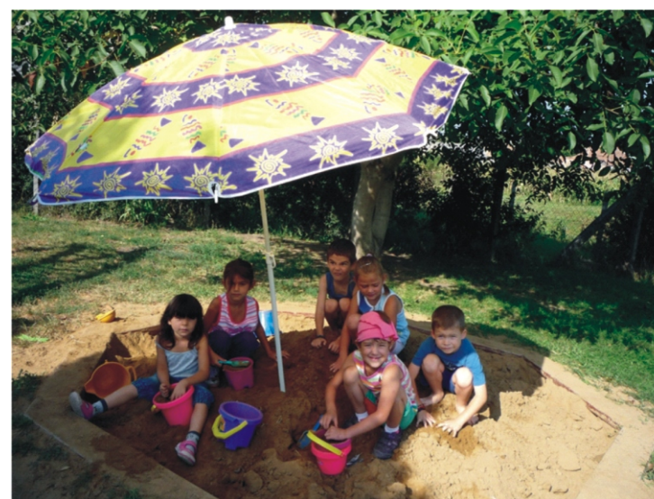
Az árnyékban kellemesebb