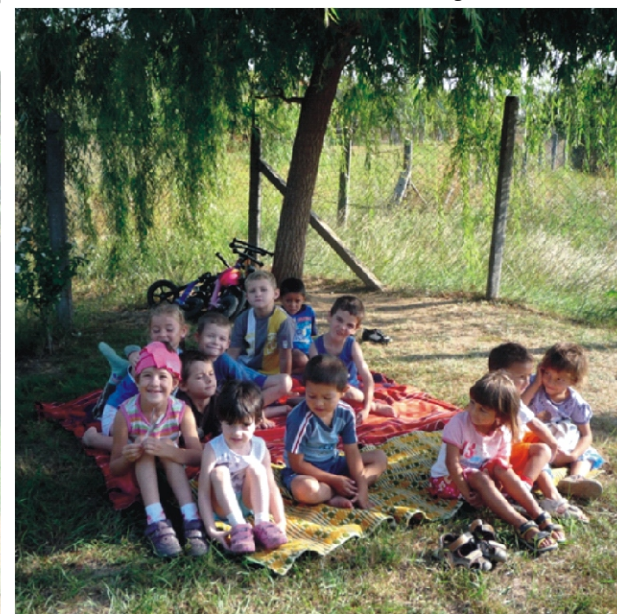
Játék közben pihenni is kell