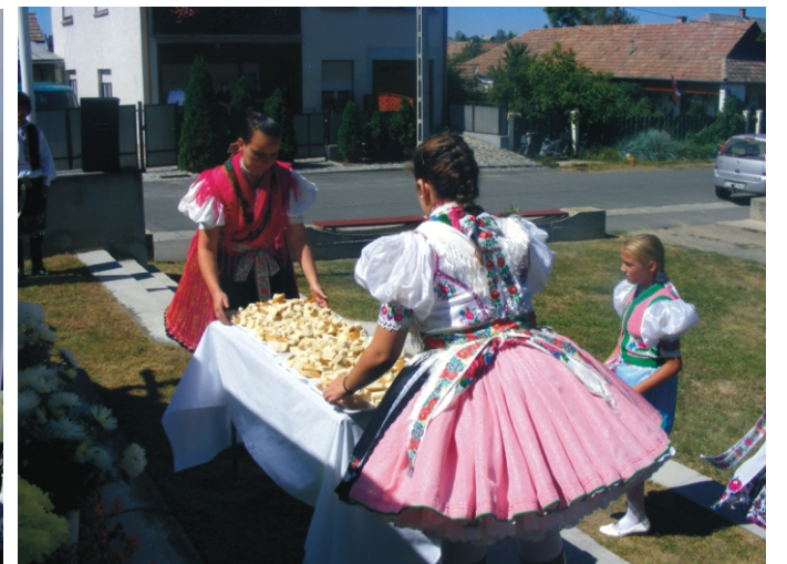
A megáldott kenyerekből mindenkit megkínáltak