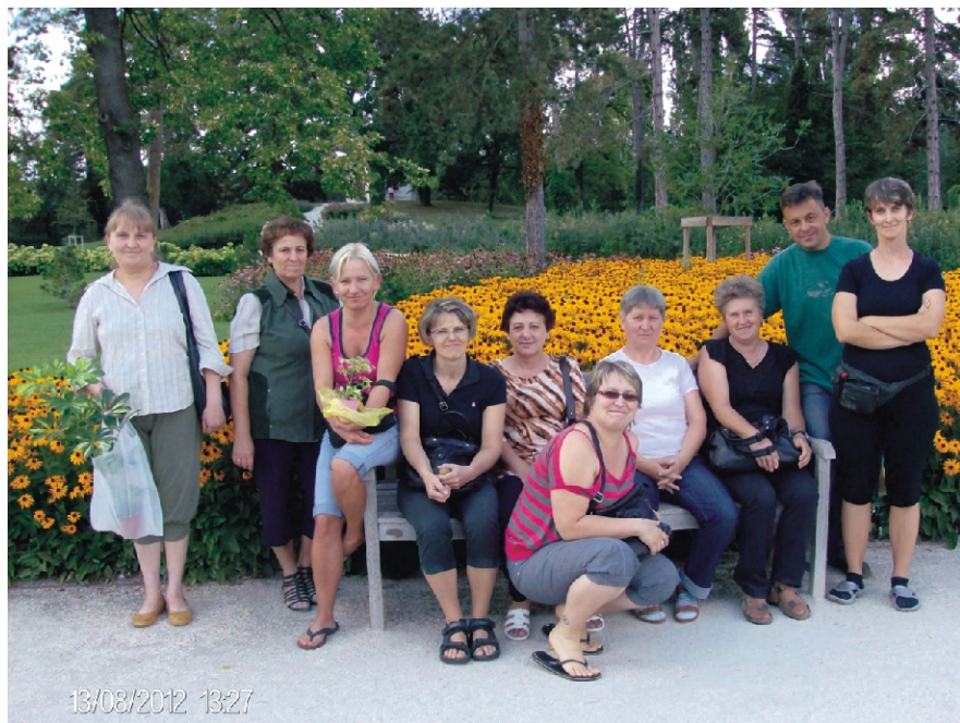
A Gödöllői Kastélykertben