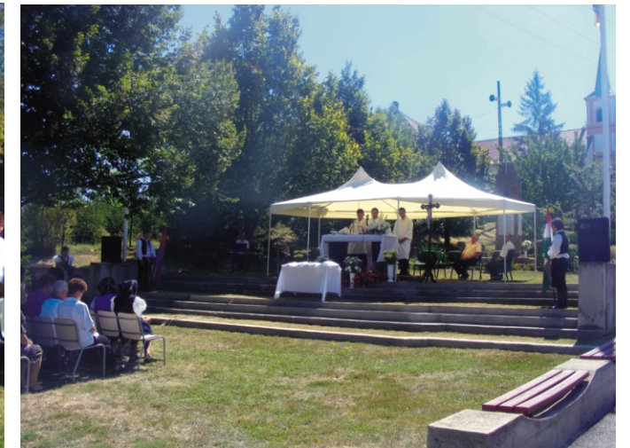
A prédikáció szavai sokak szemébe csaltak könnyeket