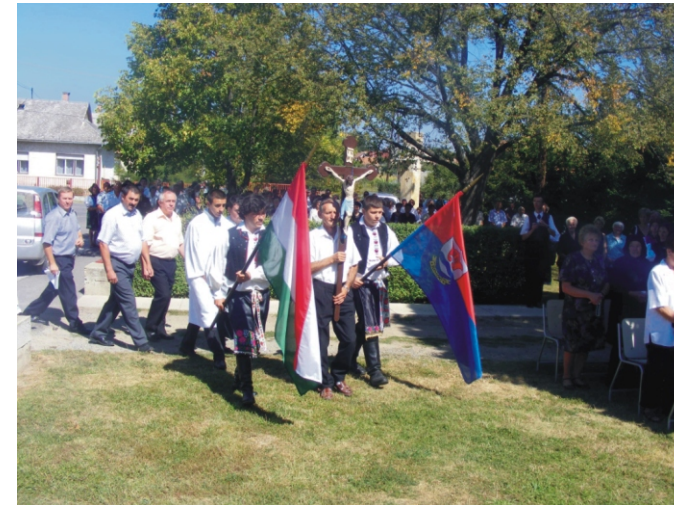
Bevonulás a szentmisére