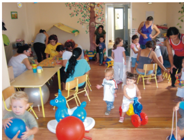
Folyik a játék, minden előkerült a polcról...

Nemzeti Fejlesztési Ügynökség www.ujszechenyiterv.gov.hu 06 40 638 638