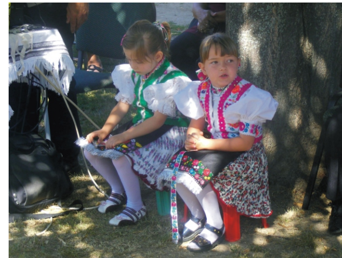
A kisebbek is népviseletet öltöttek