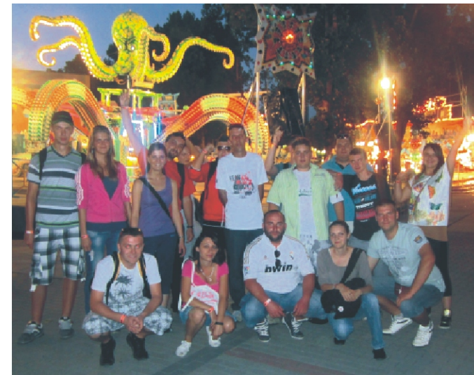
Csoportkép a vidámparkban

A program a Nógrád Ifjúságáért Alapítvány támogatásával jött létre.