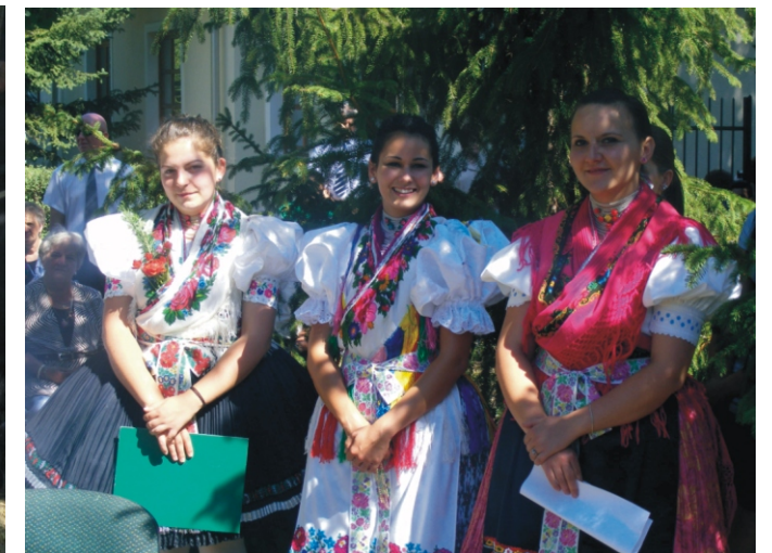
Az ünnepségen közreműködő lányok