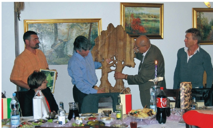
A rimóciak által ajándékba vitt fafaragás, amely a két nép barátságát jelképezi

tekintve méltóságát, nem az út nehézségeit, Judea hegyei közé s hosszadalmas, fárasztó utazás után jutott el Hebronba Zakariás házához. Megérkeztek Erzsébet által e szavakkal üdvözöltetett: „Áldott vagy te az asszonyok között és áldott a te méhednek gyümölcse; és honnét van nekem a szerencse, hogy az én Uram anyja hozzám jöjjön?” és a szent Szűz boldog elragadtatásában zengő azon éneket, melyet az egyház mai napig minden vecsernyéjében mond: „Magasztalja az én lelkem az Urat!” És e szent látogatás alapján hozza be az egyház ez ünnepet, melyet a 13-ik században szent Ferenc fiai kezdtek, 1329-ben pedig VI. Orbán pápa, valamint utóda IX. Bonifác az egész kereszténység által megtartandónak rendeltek. Szalézi szent Ferenc Mária látogatása neve alatt egy rendet alapított. Szent szándokának kivételére az Úr Chantal Francziskában hasznos munkatársat és hű segítőt rendelt számára s a társulatnak, melynek tagjai magukat a látogatás testvéreinek nevezik, első főnöknője chantali szent Johann volt, kit 1767-ben XIII. Kelemen pápa a szentek közé sorozott. (Forrás: Makula nélkül való tükör című imádságos könyv)