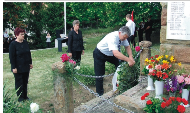
A koszorúzás pillanatai