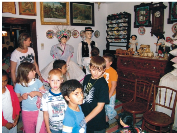
A babamúzeumban az iskolás gyerekek