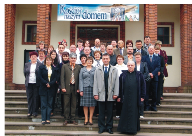
A dlutow-i templom előtt