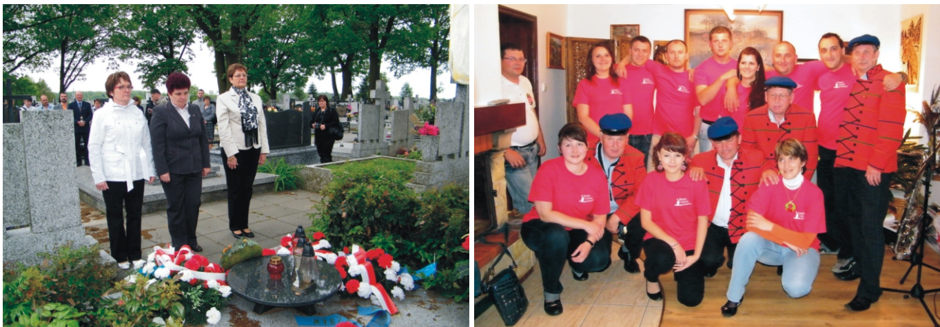
Koszorúzás a dlutow-i temetőben A Rimóci Ifjúsági Egyesület a lengyel zenekar tagjaival