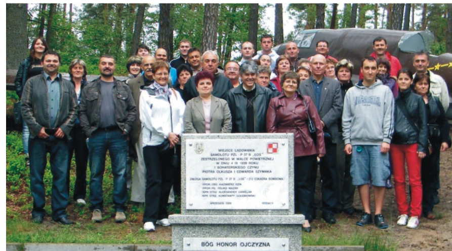
A lezuhant repülőgép emlékműnél