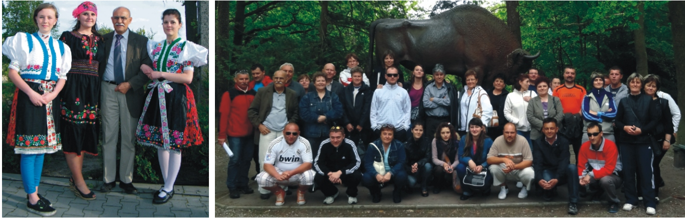
Lengyel lány rimóci népviseletben a tolmáccsal és a rimóciakkal A rimóci csoport a bölényszobor előtt