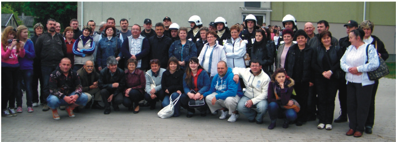
A rimóci delegáció a lengyel tűzoltókkal a tűzoltóbemutató után