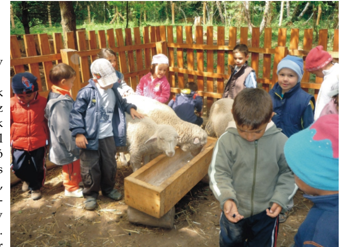
A nyírjesi állatsimogatóban

A Szécsényből érkező különjáratú busszal indultunk útnak Balassagyarmatra, a Nyírjesi vadasparkba. Utunk az erdőn át halastavak mellett sétálva vezetett a park bejáratához, ahol megpihenve elfogyasztottuk az otthonról hozott „madárlátta” tízórainkat. Majd egy erdészeti dolgozó vezetésével ismerkedhettünk közelebről is meg a gím- és dámszarvascsaláddal, őzekkel, pávakkal, fácánokkal, természetes környezetükben figyelhettük meg a vaddisznókat, muflonokat. Túránk végén mindenki nagy öröme egy állatsimogatóban bárányok, kecskék, nyuszik vártak minket. Manapság egyre ritkább az otthoni állattartás, ezért bár vidékiek vagyunk mégis újdonság az ovisoknak is ez a tevékenység. Fontos, hogy megtanítsuk nekik, hogy gyengéden nyúljunk hozzájuk, hiszen ők is érző lények.