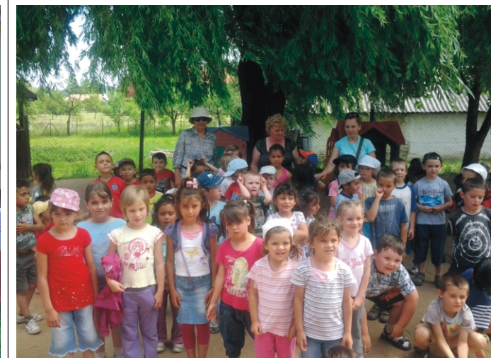
Vendégeink a varsányiak