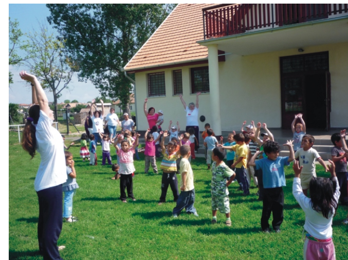
Frissítő közös torna