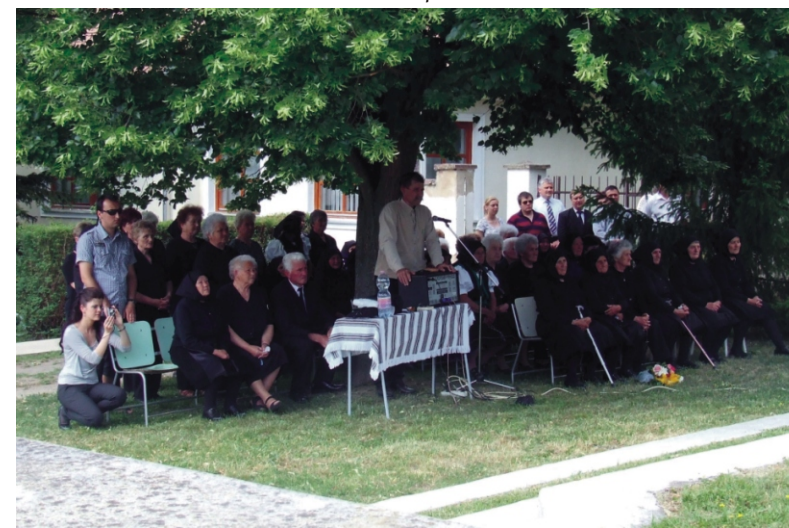
Sokan eljöttek a megemlékezésre