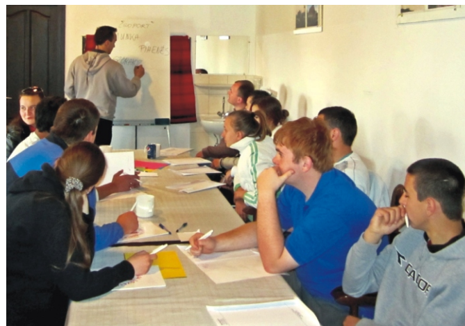
Szakmai délelőtt - témafelvezetés közben