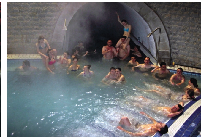
A Demjéni Termálfürdőben