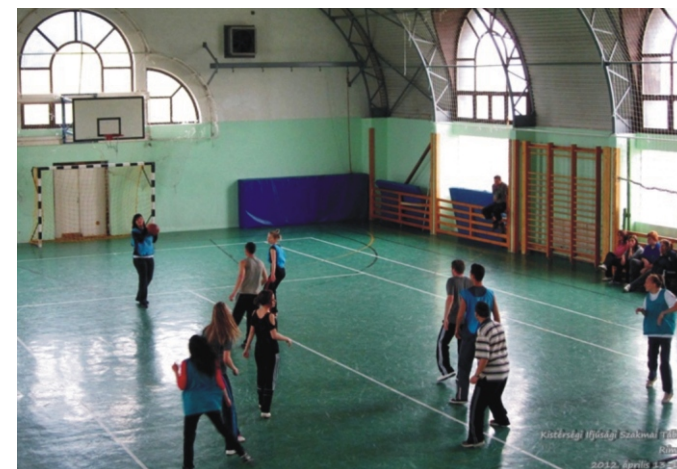
Kosarazás a csarnokban