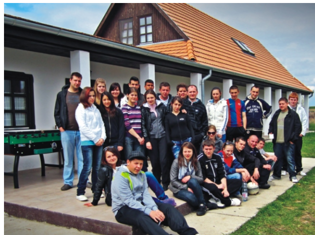
Csoportkép - a táborozók nagy része

Úgy érezzük, a tábor elérte célját. Megismerhettük a környező települések ifjúsági életét, új kapcsolatok kötődtek, illetve példaként állíthattuk magunkat egy ifjúsági civil szervezet létrehozásához. Jól szórakoztunk és eredményesen dolgoztunk együtt.