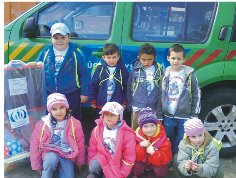
A versenyen résztvevő csapat