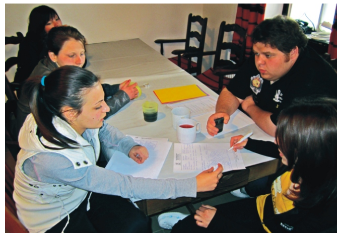
A témák kiscsoportos megbeszélése