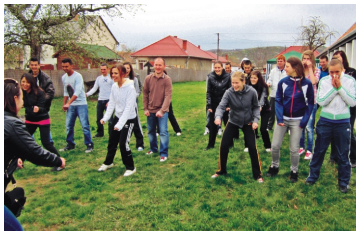
Reggeli torna az udvaron