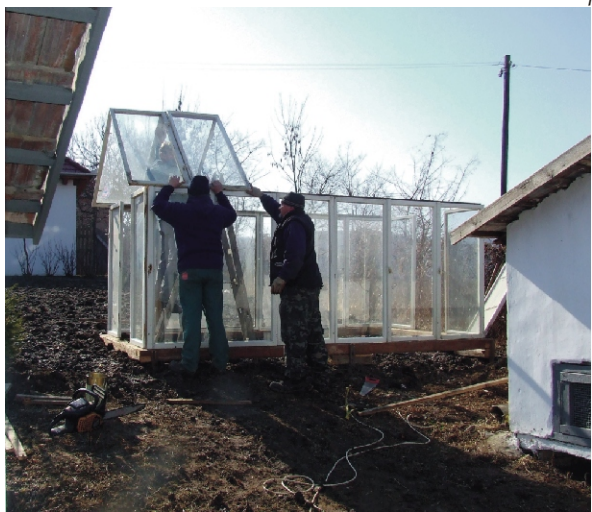
Ablakokból készül az „üvegház”