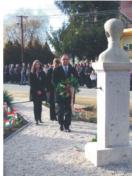
Koszorúz az iskola