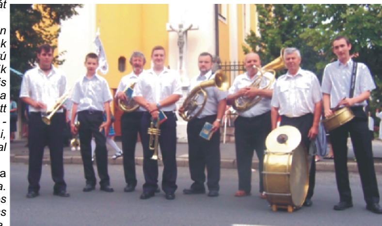
A Rimóci Rezesbanda 2006-ban Balassagyarmaton