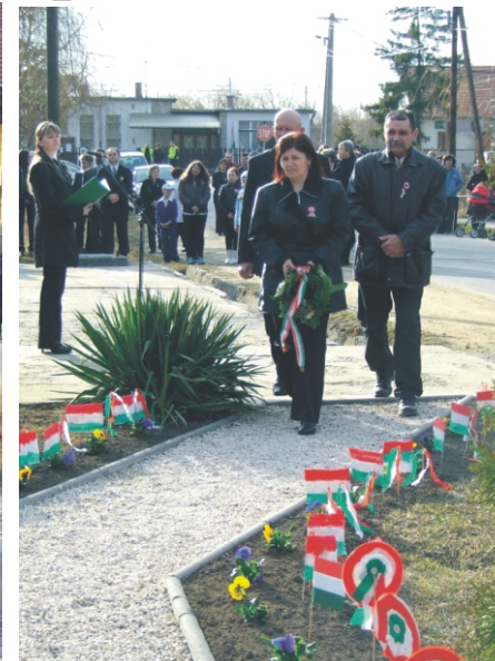
Megemlékezik a Polgárőrség