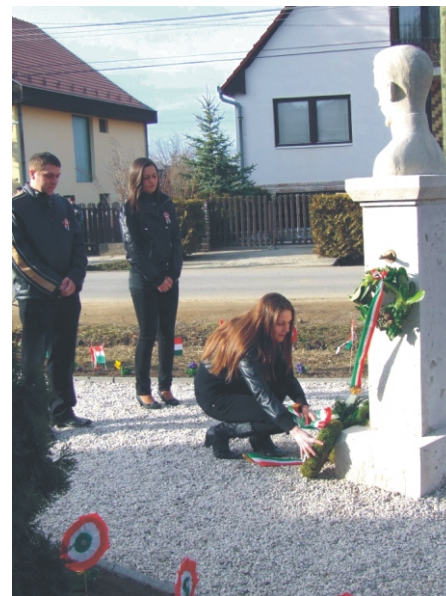
Tisztelettel adózik az Ifjúsági Egyesület