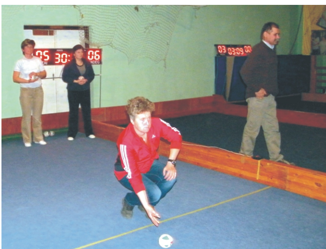
Itt már minden eldőlt