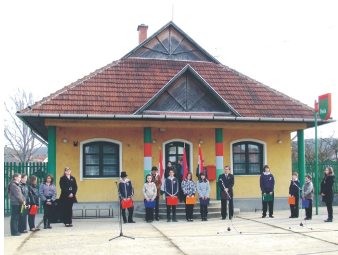
Az iskolások műsor közben a Petőfi téren

Március 15-én minden megemlékező kókárdát tűz a ruhájára. Ez a hagyomány a francia forradalom (1848. február 24.) nyomán keletkezett, a magyar szabadságharcosok viseltek először nemzeti színű szalagot.