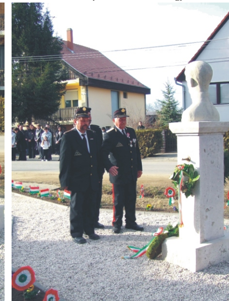
Tisztelegnek az 56-os Nemzetőrség képviselői