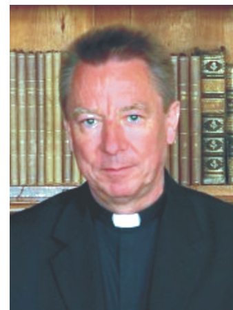
Dr. Beer Miklós váci megyéspüspök

„Hét évvel ezelőtt, 2005-ben, amikor Egyházunk az Eucharisztia Évét ünnepelte, - az egyik kis nógrádi faluban gondoltak egy nagyot, mely szerint rendeznének egy találkozót, két napos összejövetelt, amire meghívnák a Váci Egyházmegye összes katolikus hívőjét, és minden hitét kereső embert, hogy a hit jegyében, Krisztus jelenlétében összegyűljenek. Az elképzelést tettek, lázas készülődés követte, melynek gyümölcseként megszületett a Váci Egyházmegye első, igen sikeres találkozója. A megjelentek száma, a találkozó sikere, annyira meglepte, mind a szervezőket, a jelenlévőket, mind engem, hogy ott, spontán módon, de minden bizonnyal a Szentlélek ösztönzésére született meg az elhatározás, hogy Krisztusban való találkozásokat a jövőben is folytatni kell! Már ott is többen jelezték, hogy a következő években szeretnének otthont adni ennek az eseménynek. Így találkozott az egyházmegye aprajagyja 2006. nyarán Mendén, 2007-ben Dunaharasztaban, Taksonyban, 2008-ban Vác volt a házigazdája, - ennek az immár tradicionálisnak nevezhető találkozóknak, melyre évről-évre több ezer hívő jön össze. 2009. évben „Palócországbán” Ludányhalásziban, 2010-ben a Galga-mentén, Galgahévízen, majd 2011-ben Szolnokon találkoztunk. Az elmúlt években megtapasztaltam, hogy szükség van ezekre a találkozókra, hiszen híveink így megismerik egyházközségeink életét, tapasztalatokat gyűjtenek, segítik egymást lelki, valamint kulturális programjaik szervezésében.