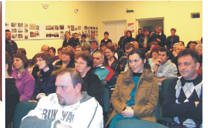
Mindenki érdeklődve hallgatta a könyv történetét