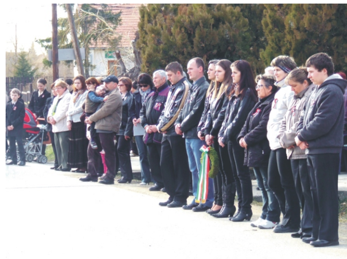
Több mint kétszázan vettek részt a megemlékezésen