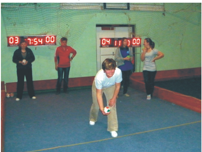
Vali gurítás előtt