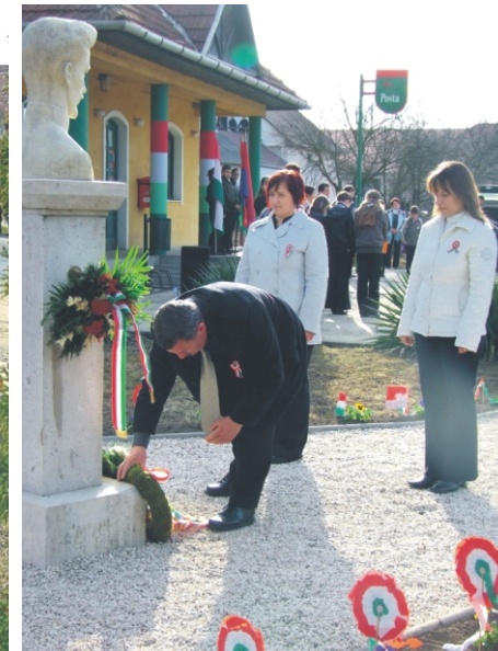
Koszorút helyez el a Kobak Egyesület