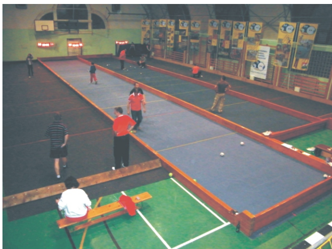
Pillanat kép a pályáról