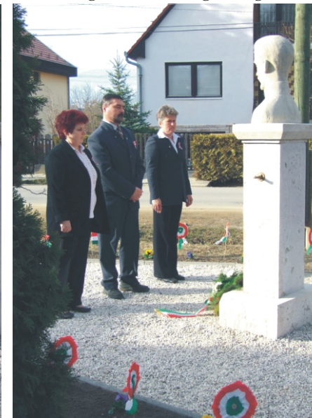
Fejet hajt a képviselő-testület