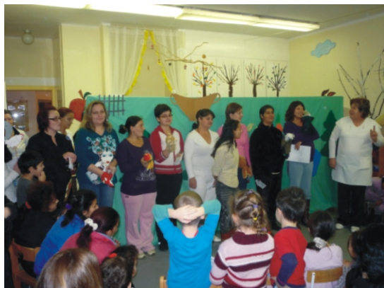
Véget ért a mese mára...

„Ég a gyertya ég, el ne aludjék, mesetündér, jöjj el hozzánk, mondj egy szép mesét!”