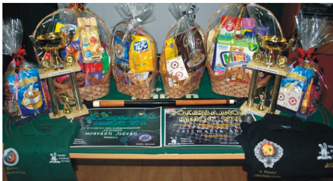
A nyeremények összértéke elérte a 80.000 Ft-ot