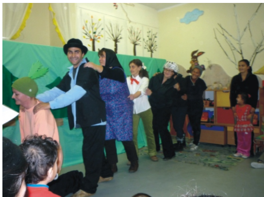
„Apóka húzta a répát, anyóka húzta apókat...”