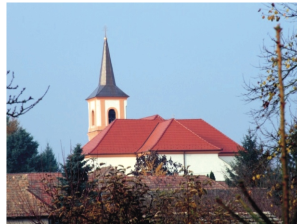
A templom napjainkban