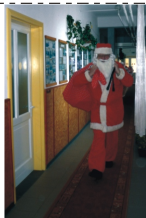
„Itt van végre a Mikulás!”