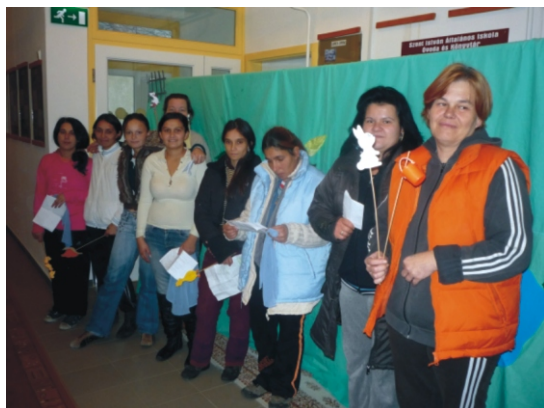
A „cseresznyés” anyukák próba közben