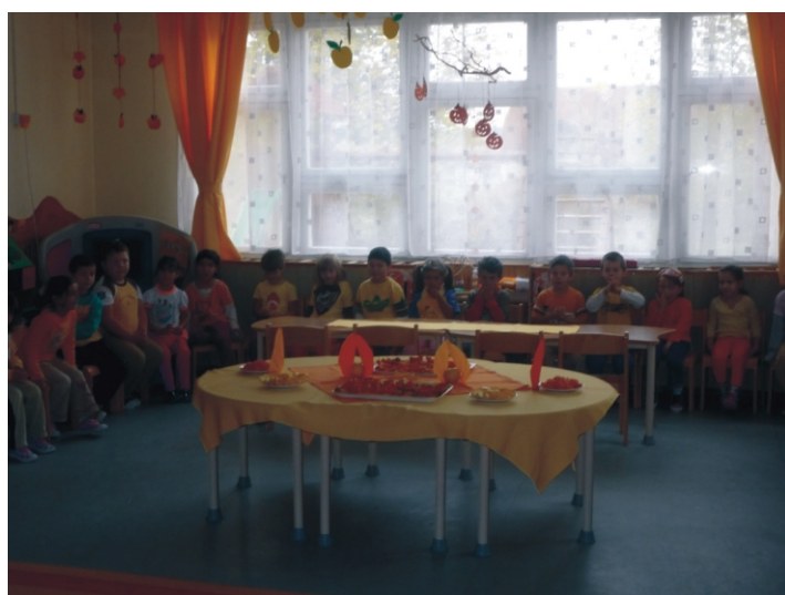
„Várjuk a vendégeket!”