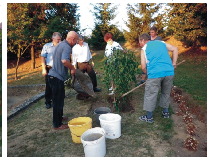
A helyére került lengyel nyírfa belocsolás előtt