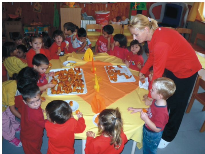
A „pirosak” vendégségben a szomszéd csoportban