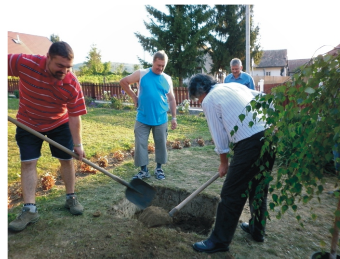
Készül a gödör a fa számára