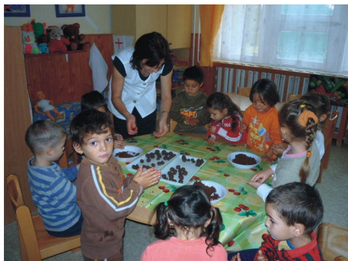
Készülnek a finom csokigolyók