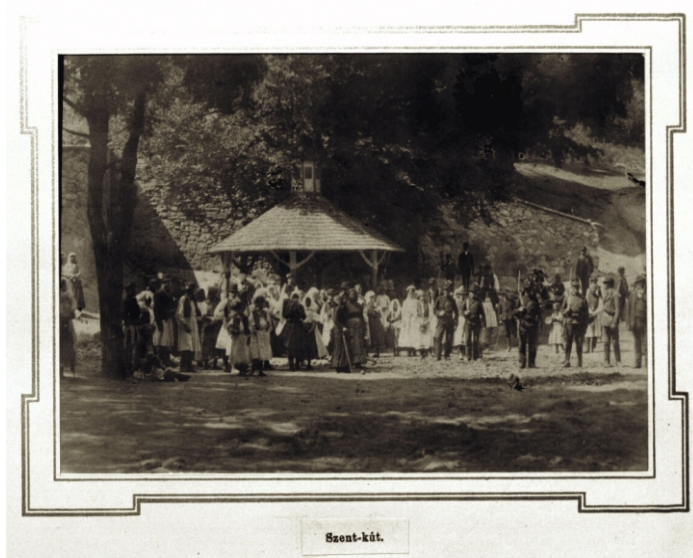
A szentkúti forrás 1886-ban