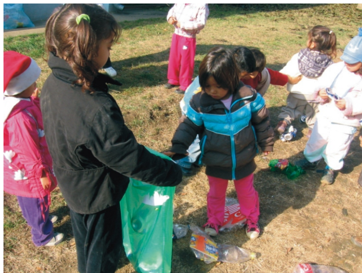
Szorgos kezek zsákba rakják a hulladékot