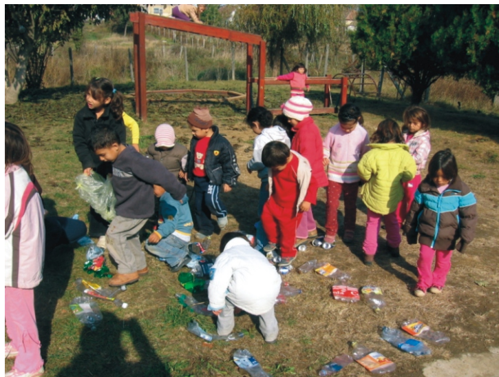
Flakon taposás közben