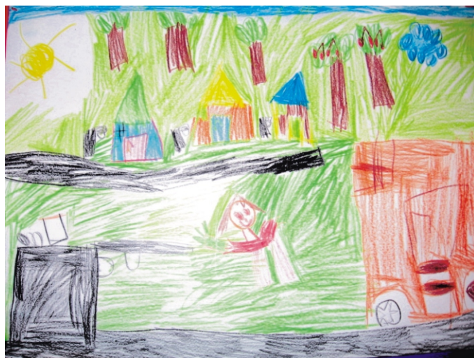
Balázs Dorka rajza