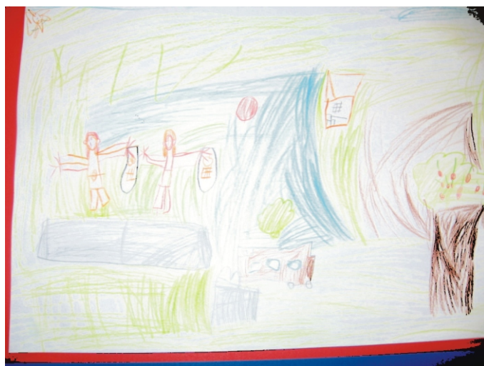
Szoldatics Karolina rajza