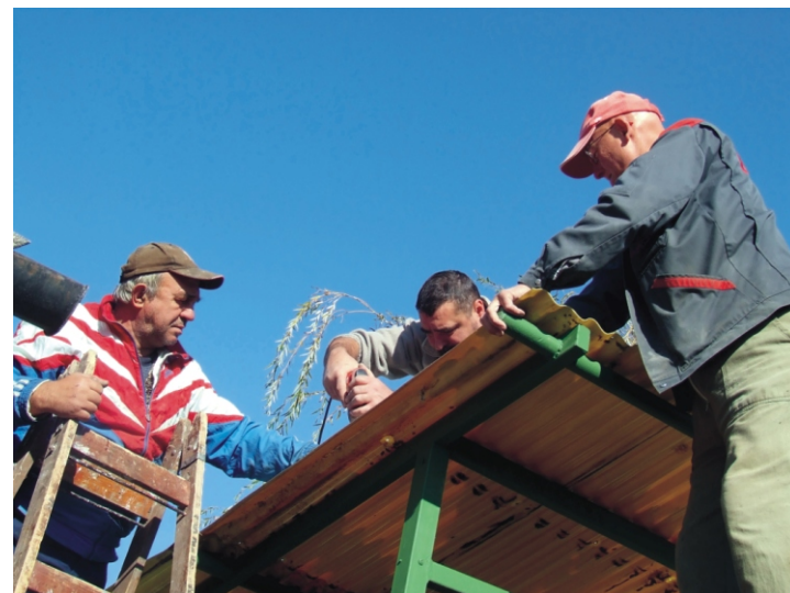
A tető rögzítése közben