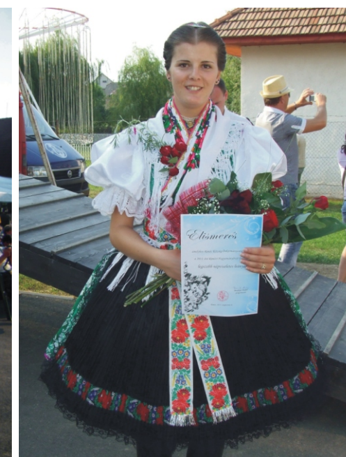
A Rimóci Hagyományörző Fesztivál legszebb népviseletes leánya