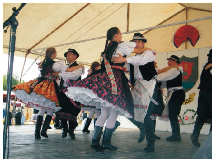
A Palóc Néptáncgyüttes