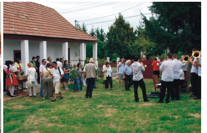
Pillanatképek a látogatásról