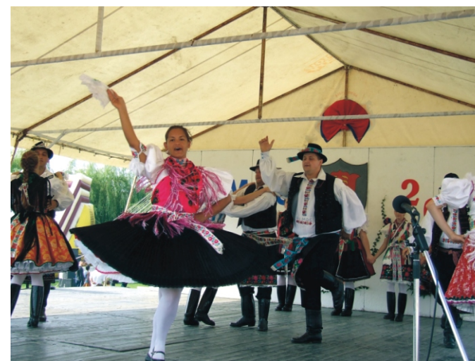
A Rimóci Hagyományörző Együttes