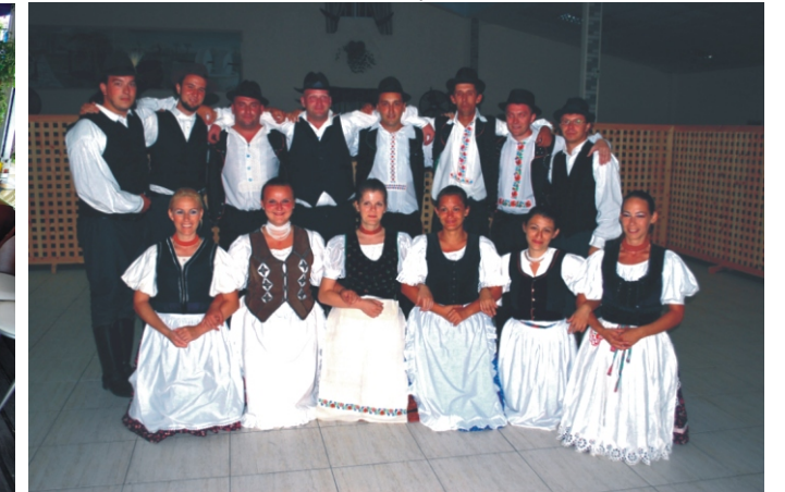
A magyar csoport fellépés előtt