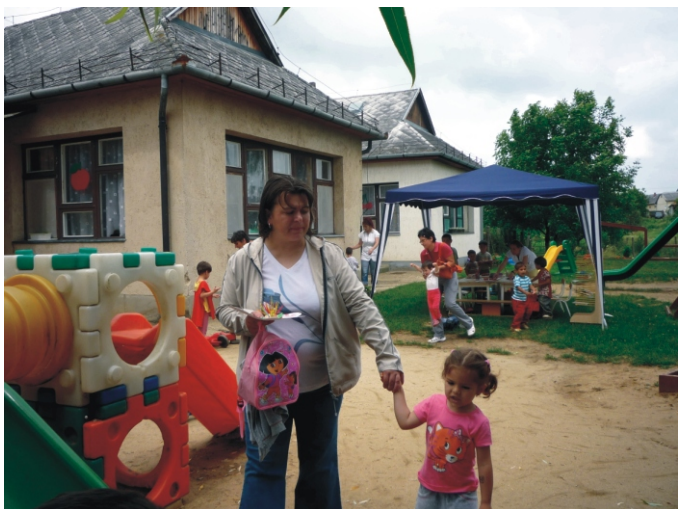
Kellemes délelőtt volt szülőnek, gyerekeknek