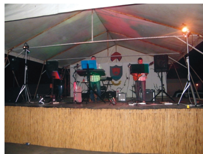
A Pikk Dáma Partyzenekar