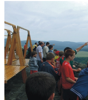
A hollóközi vár bevétele

Nekem a legjobb az edzések, a focik, a filmezés volt és sok jó élményben volt részem. Sok mindent tanultam a focival kapcsolatban. Lett sok barátom, ismerősöm. Nagyon sok jó élmény volt. Rossz élmény pedig egy sem. Nagyon jók voltak az edzések, és ha lesz jövőre is, akkor száz százalék, hogy jövőre, illetve köszönöm az edzőknek is. Jó volt nagyon, nem volt semmi gond, csak rossz volt az idő. Tetszett a társaság. Jövőre is jövőre. Jók voltak az edzések és a hollóközi kirándulás. Az időjárás sokat rontott a helyzetünkön. Jó volt még, hogy sok