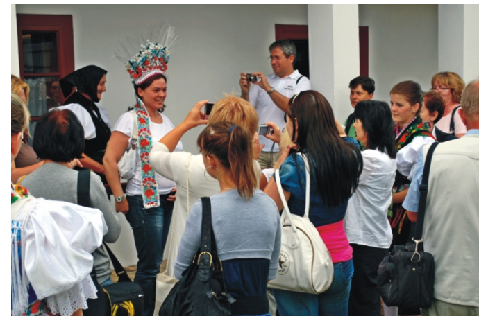
Sokan felpróbálták a főkötőket