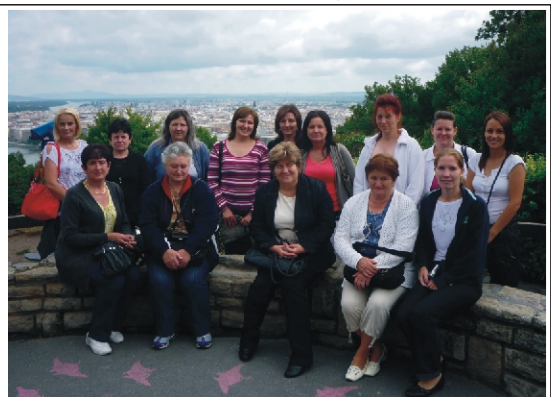
Csoportkép a Citadellán