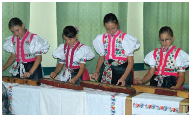
A Kecele Citera Együttes lányai