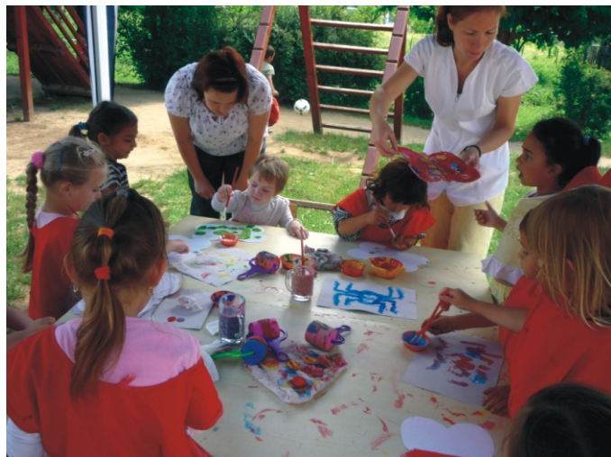
Nagy az érdeklődés a festőasztal körül

Az ismerkedés és a nyári szünet után, minden óvodást sok szeretettel várunk.