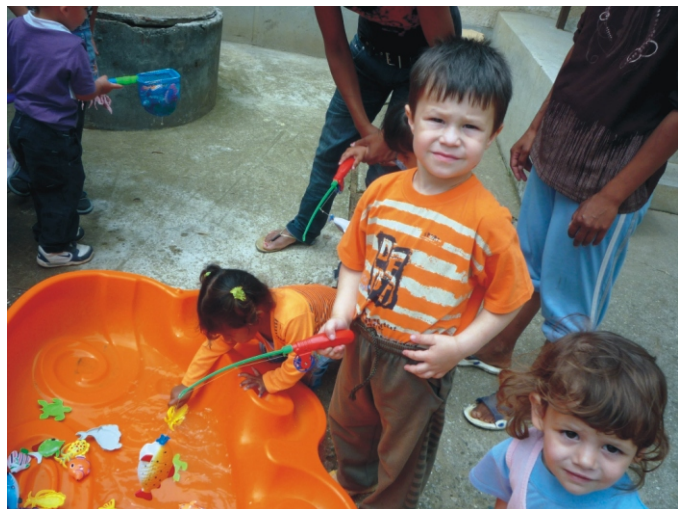
Horgászás közben az új ovisok