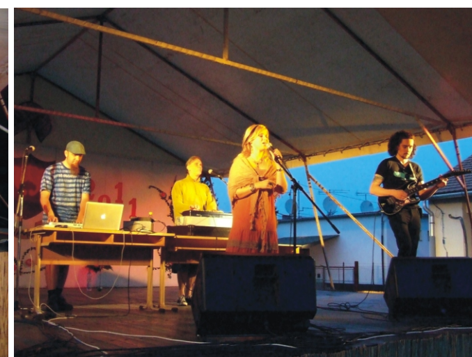
Balkan Fanatik koncert