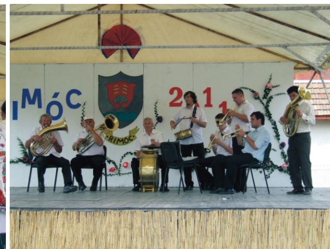
A Rimóci Rezesbanda