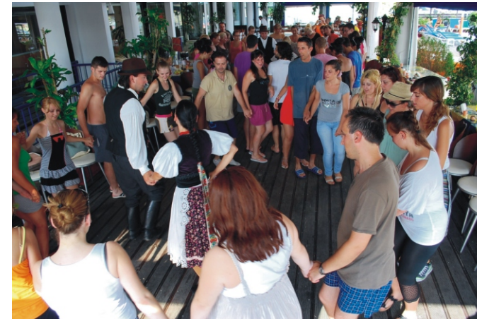
Tánc tanítás magyar módra