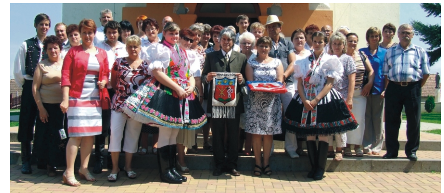
A rimóci templom előtt a címer és zászló átadást követően