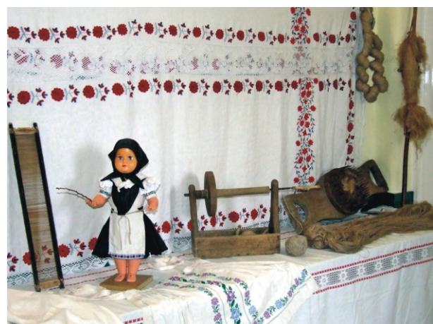
Részlet a kiállításról