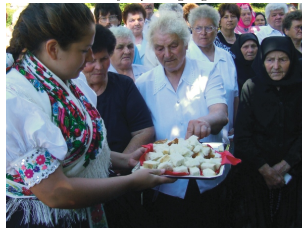
A megszentelt kenyér kínálása

Fáradtan, elcsigázottan, de imádságtól és énekszótól hangosan érkezünk meg a szentkúti erdőbe, ahonnan az ott várakozó családtagjainkkal együtt vonultunk be a Nemzeti Kegyhelyre. A fogadásunkra siető Ferences Atya kedves szavai után köszöntöttük a Szentkúti Szűz Anyát és hálát adtunk, hogy ismét teljesíteni tudtuk a zarándokutat.