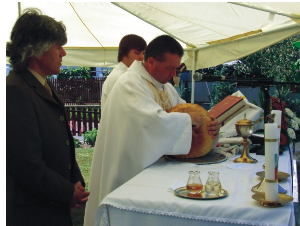
Az Újkenyér megszegése