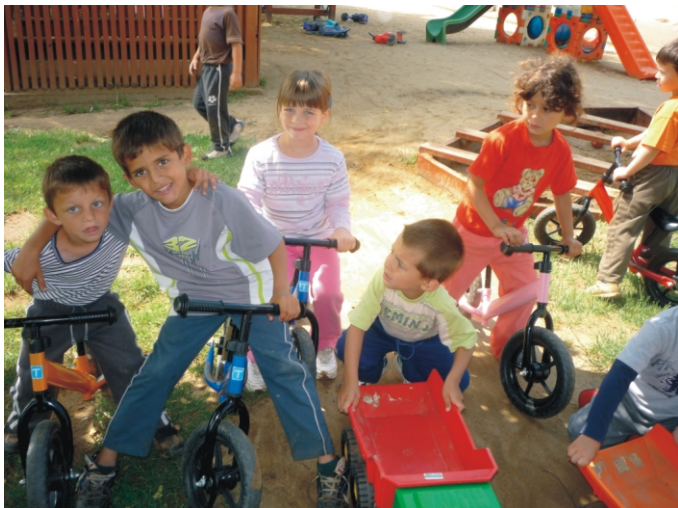
Mindenki kedvence a futóbicikli