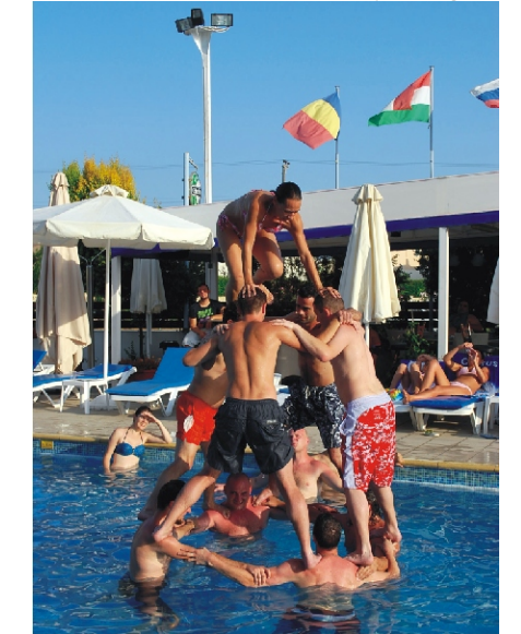
Játék a medencében