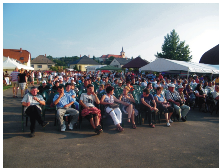
A kedves közönség