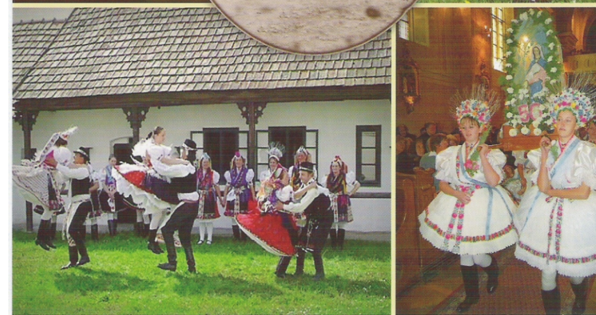
Színes rimóci képeslapok vásárolhatóak a Szociális Boltban. Ára: 100 Ft/db.