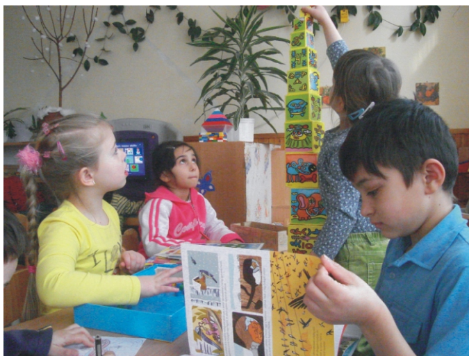
Nagycsoportosok játék közben

Virágné Csábi Adrienn óvodapedagógus, fejlesztőpedagógus