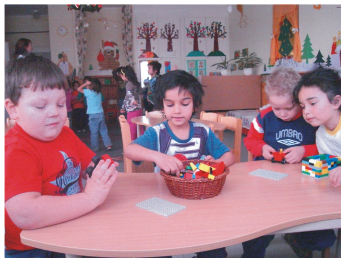
Közös építés az asztalnál