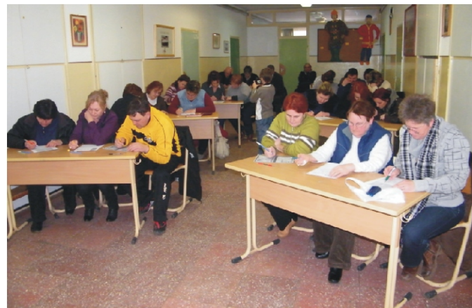
Munkában a nyolc csapat