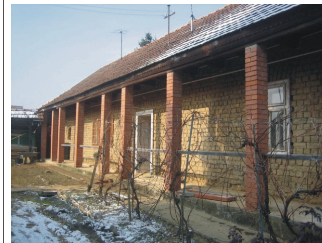
A munkálatok jelenlegi állapota

Európai Unió Európai Regionális Fejlesztési Alap