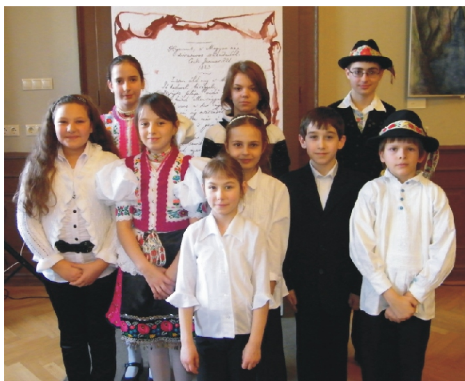
Magyar Kultúra Napja - Résztvevők