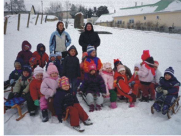
Az „Alma” csoportosok szánkózás közben

A szánkózás nagyszerű téli mulatság és messze nem igényel akkora ráfordítást, mint akármelyik téli sport. Mi lehet vidámabb ilyenkor télen, mint egy szánkó-party? Tanakodtunk gyerekek, felnőttek, hogy sikerül-e összeszedni annyi szánkót, hogy ez az élmény megvalósulhasson. Induláskor kiderült, hogy a gyerekek másképp képzelték el a szánkózást. Mindenki ráült a szánkójára és várta, hogy majd valaki húzza. Kicsit megdöbben arcokat láttunk, amikor elárultuk, hogy most nekik kell húzni a szánkót az úton is, meg persze fel a domboldalra is. Kis gyerekekről lévén szó, egy közeli helyre, a „Kurázsdombra” mentünk, ahol hajdanán sok kis gyermek meg tanulhatott szánkózni. Mára már veszélyesebb ez a lejtő a forgalom miatt, így a kicsikkel az '56-os emlékmű melletti részt választottuk. Egykettőre megtanulták, hogy ügyesen húzzuk a szánkót hegynek fel és aztán csúszhatunk a lejtőn le. Voltak olyanok, akik egy kicsit nehezen kaptattak fel a dombra, de mindenki megbirkózott vele. Mit is lehetne még mondani? Egyszerűen csodálatos kedvtelés volt!