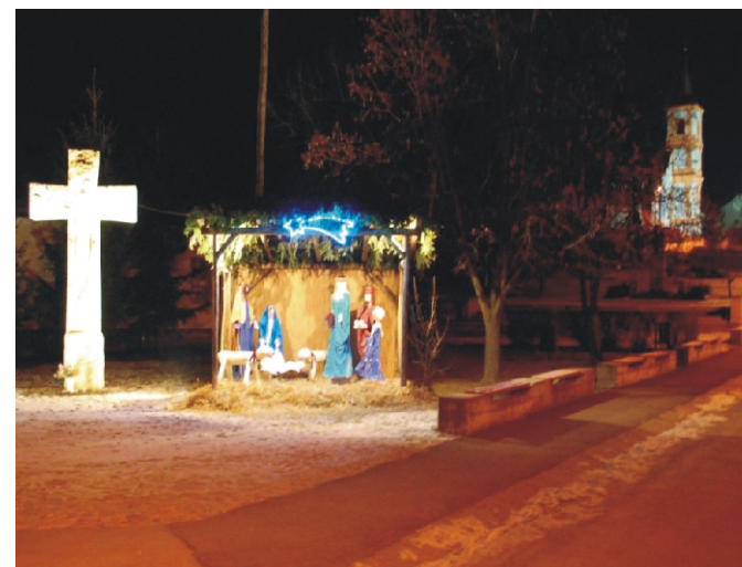
1. helyezett, Bablena Ferenc fotója

A nevezők és a nyertes képek a következők voltak: