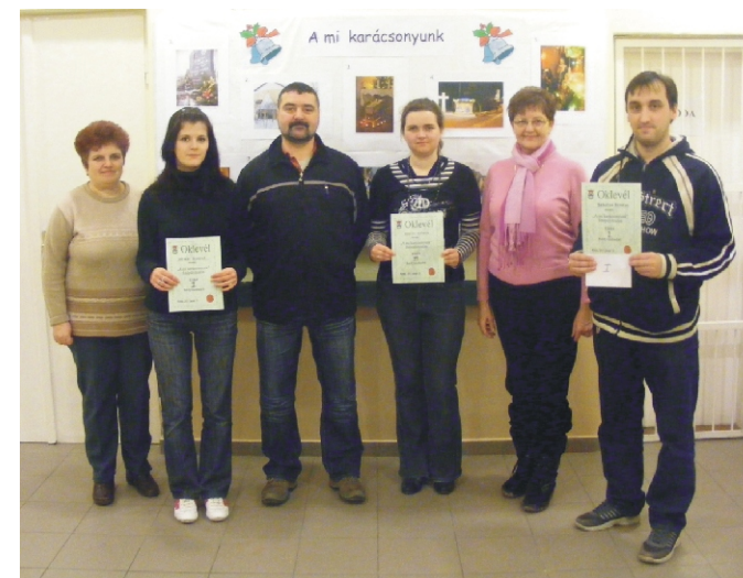
A díjazottak és a zsűri