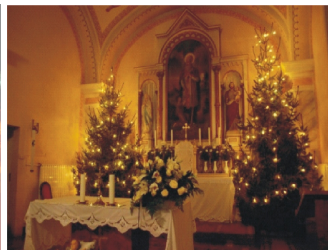
2. helyezett