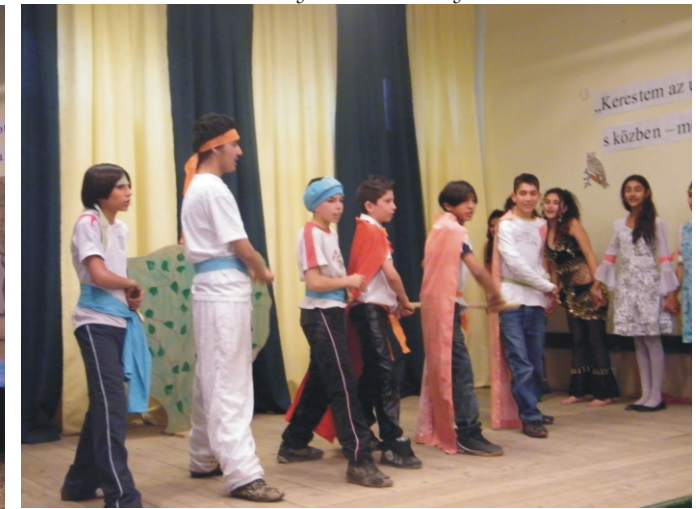
A harmadik helyezett hatodik osztály