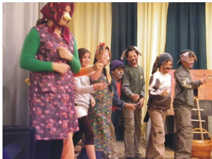
Az első helyezett ötödik osztály

A bemutató a 3. osztállyal, a Vuk zanzásított változatával kezdődött. Őket a 4. osztály Badányiak jelenete követte. Babocsai László és Oglu aga párbajának eseményeit elevenítették meg a 6. osztályos tanulók: A legendák harcosai és a Sasfiókák. A Vén rókák, 8. osztály a Vuk azon részét mutatta be, amikor a libák azért menekültek meg Vuk karmaiból, mert elkóboroltak a szeszfőzdébe és kissé másnaposan csak reggel tértek haza. Az állatok szeretetét bemutató részt jelenített meg a 7. osztályosok „Lutra” és „Szurkevarjak” csapatából alakult színtársulat a Kele című jelenetükkel. A Kis vörös rókák és az Ugráló kavicsok zárták a bemutatót. Az 5. osztályosok produkciójukkal elvitték a pálmát, a zsűri egyöntetű véleménye alapján az első díjat kapták produkciójukért, amihez az előadásmód, a gyerekek játéka, a közönséggel megteremtett és mindvégig fenntartott kontaktus, a jelmez és a díszlet egyaránt hozzájárult. A sok munka mindenki számára meghozta gyümölcsét: gazdagodtunk ismeretekben, hasznosan, kellemesen töltöttük el együtt az időt, és minden gyermek legalább egy energiapótló csokoládét is kapott.