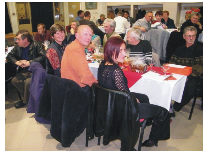
A rimóci jubiláló véradók közül néhányan