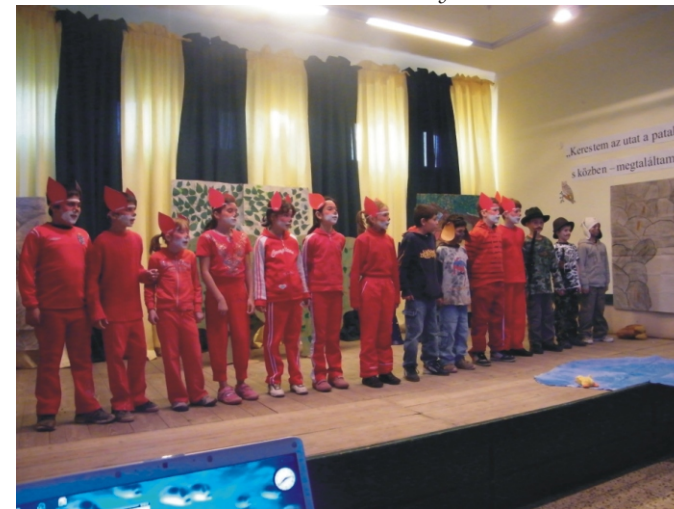
A második helyezett harmadik osztály