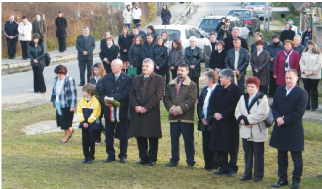
A megemlékezés egyik pillanata