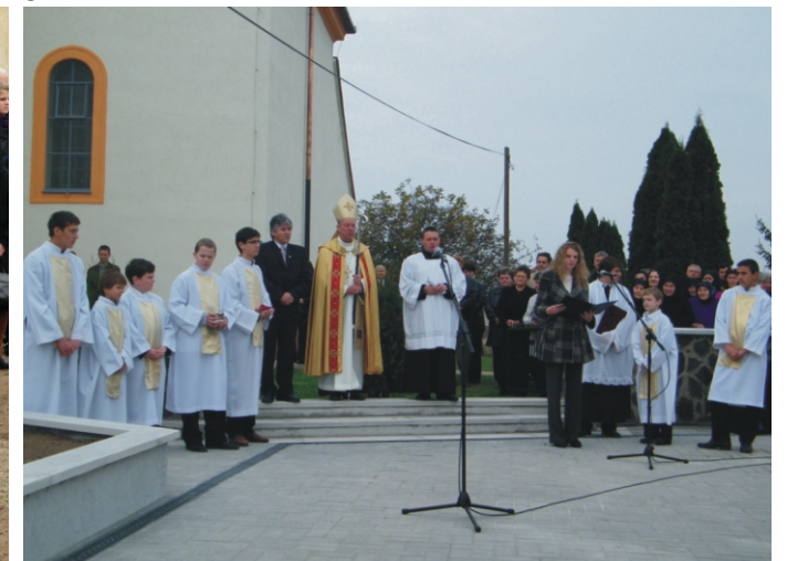
Az ünnepélyes átadás kezdete