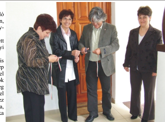
A patika átadás ünnepélyes pillanatai