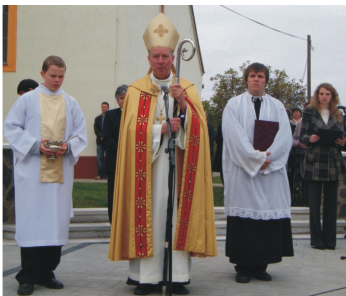
A püspök úr a Szent Erzsébet téren