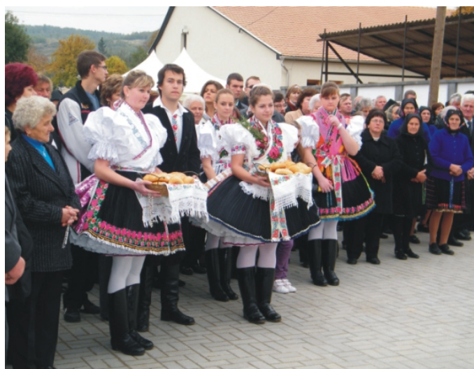
A Szent Erzsébet kenyerek megáldás előtt