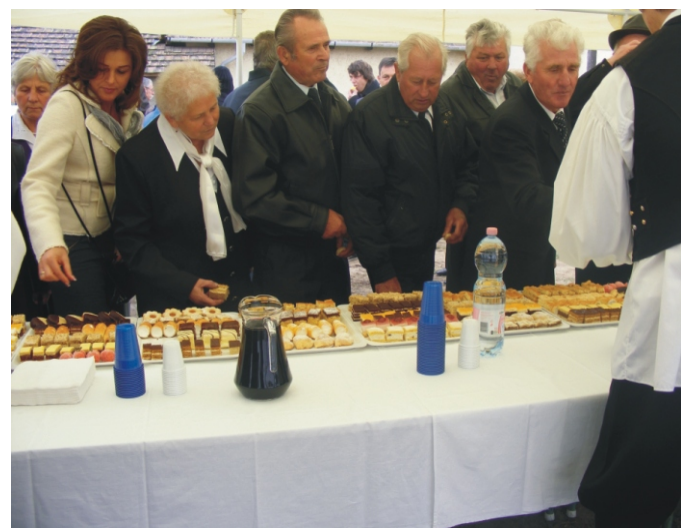
Sok szép és finom sütemény készült az ünnepségre