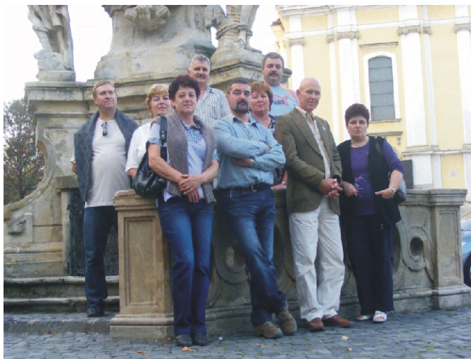
Az előző képviselő-testület a kirándulás egyik helyszínén