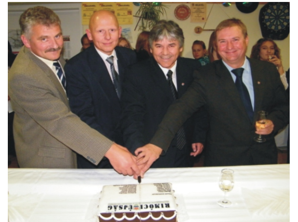
Az alapító tagok felvágják az ünnepi tortát

2010. évben a Rimóc Községért Díjat azok kapták, akiket ez a természetesség vesz körül. Több mint 15 éve létrejött egy újság a lakosság hiteles tájékoztatására az önkormányzat lapjaként, mára már a szerkesztők odaadó, kutató és alkotó munkájaként bőven túlnötte az önkormányzati lap mivoltát. Mindenki lapjává vált. Megmutatja, hogy valójában kik is vagyunk, hogyan élünk, miről álmodunk. Helye van benne történelmünk bemutatásának, a hagyományaink ápolásának, aktuális mondandóknak, egyéni véleményeknek, bepillanthatunk az iskolások és óvodások életébe, a fiatalok terveibe, olvashatjuk az idősebbek bölcs véleményeit. Pályázataival (versíró, versmondó) a kulturális életet generálja. Olyan kapocsná vált a helyi társadalomban, ami úgy köt össze, hogy segít eligazodni, egymással tisztába jönni. Az írott szó, ha az igaz és hiteles, mindig egy lépés előre. A Rimóci Újság szerkesztői szabadidejüket sem kímélve, ellenszolgáltatás nélkül szorgoskodnak az újság létrejöttén, és most már jogosan tudhatják magukénak a Rimóc Községért Díjat. Munkájukhoz jó egészséget kívánok!