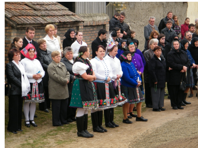
Az ünnepségen résztvevők egy csoportja