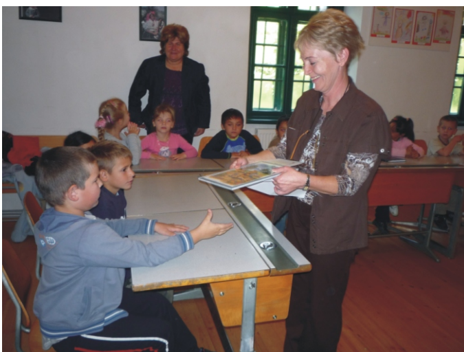
A rajzpályázat díjkiosztása