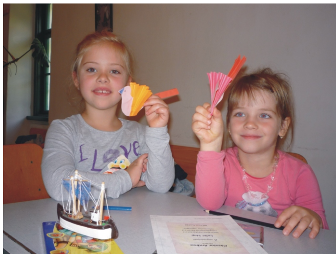
Elkészültek a madarak