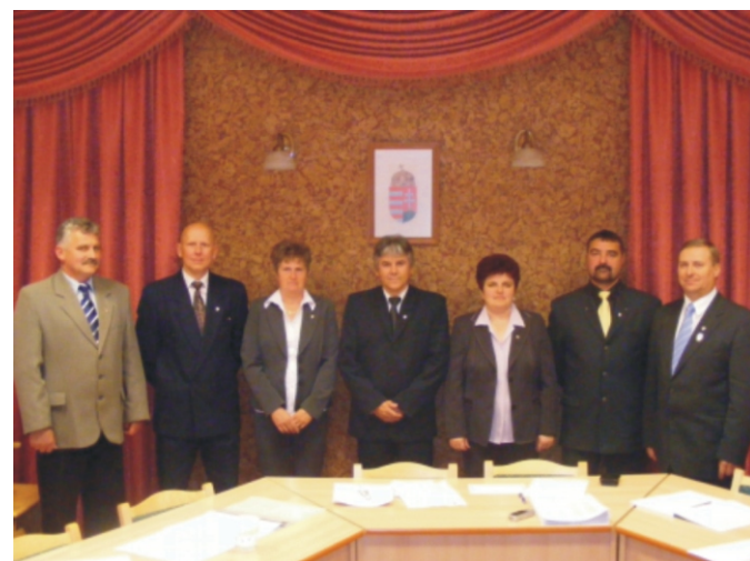
A megalakult képviselő-testület

A szokott helyen, hasonló időben került sor erre a testületi ülésre, mégis valahogy más volt ez az ülés még az újból megválasztott képviselők számára is. Talán azért is, mert a testület létszáma 9-ről 6-ra apadt, de azt gondolom az igazi ok az volt, hogy a felelősség érzete hatotta át a képviselőket, amikor az ülés megkezdésére várakoztak. A választási eredmények ismertetését követően az eskütelre került sor. Ezek voltak az ülés legemlékezetesebb pillanatai.