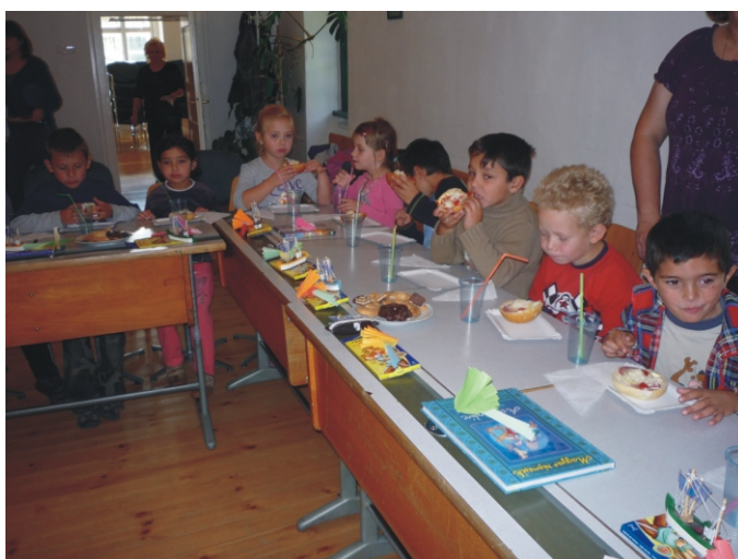
Finom szendvicseket ettek a gyerekek