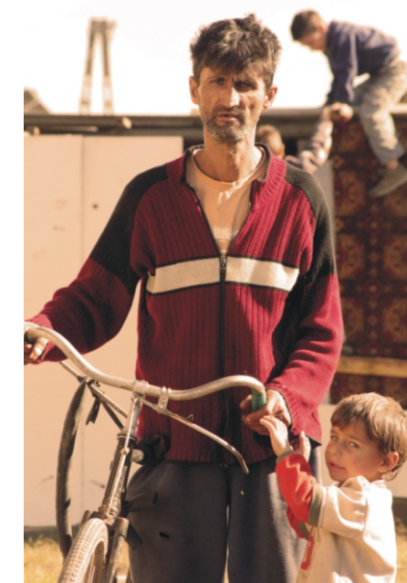
Haza érkezett

Köszö, hogy szántál időt az újságra, szép fényeket, minden jót! Rimóc, 2010.10.20.