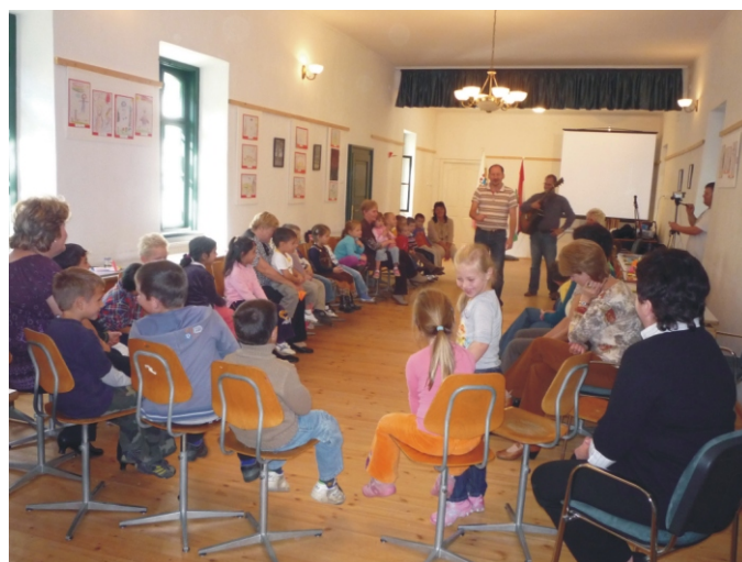
A Gável testvérekkel egy körben