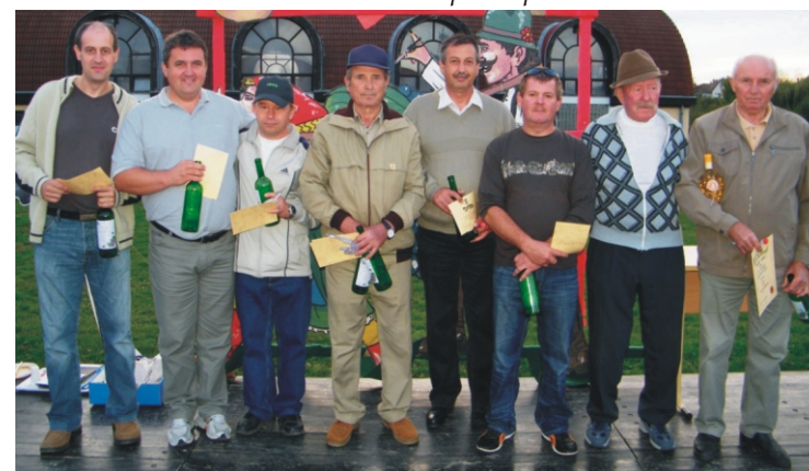
A borverseny néhány indulója és díjazottja