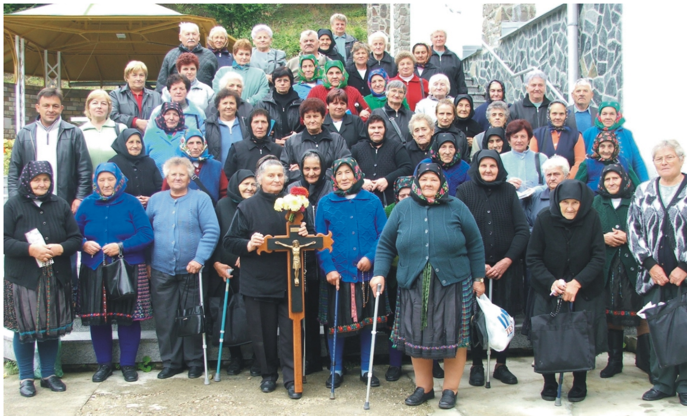
Rimóci idősek Hasznoson