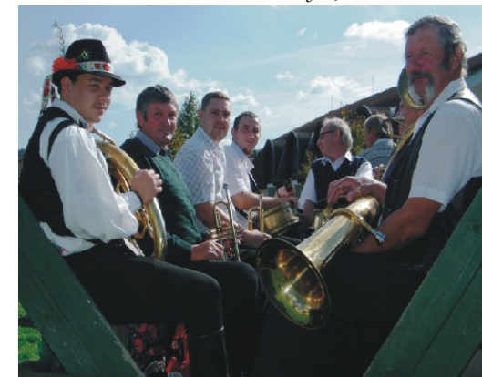
A Rimóci Rezesbanda a kisbíróval