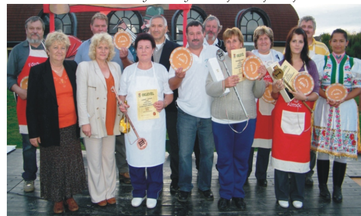
A főzőverseny csapatainak képviselői a három tagú zsűrivel