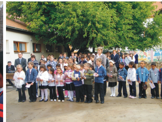
Az első osztály