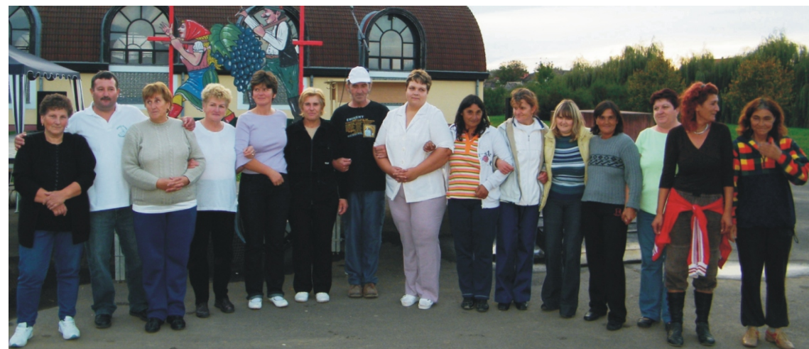
A közmunkások csapata a túrós haluskával második lett a főzőversenyen

73. A nyár elején mit hallok, mit hallok, beindul újra a Palóc Szóttos Napok. Szépen énekelt nálunk a Szvorák Kati, elkísérte koncertjére őt a Kudlik Juli.