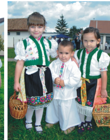
A legkisebb szüreti szereplők

1. Kedves rimóciak jó napot kívánok, én most előttetek kisbíróként állok. Ezért emberek most reám hallgassatok, mi történt egy év alatt, mindent elmondok.