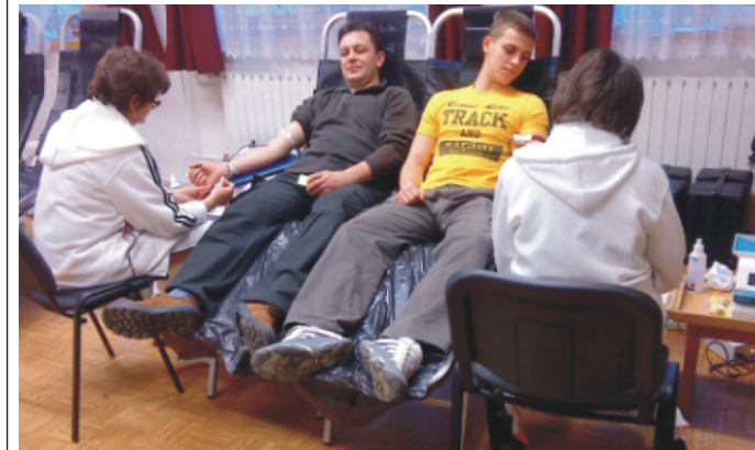
Apa és fia együtt a véradáson (archív felvétel)