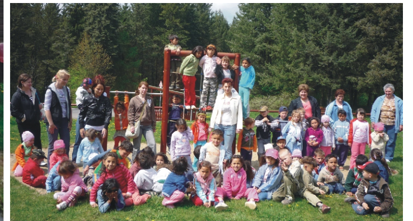
Az erdei „kölyök-parkban”

Június 7-én kicsit közelebb, Hollókőre kirándultunk.