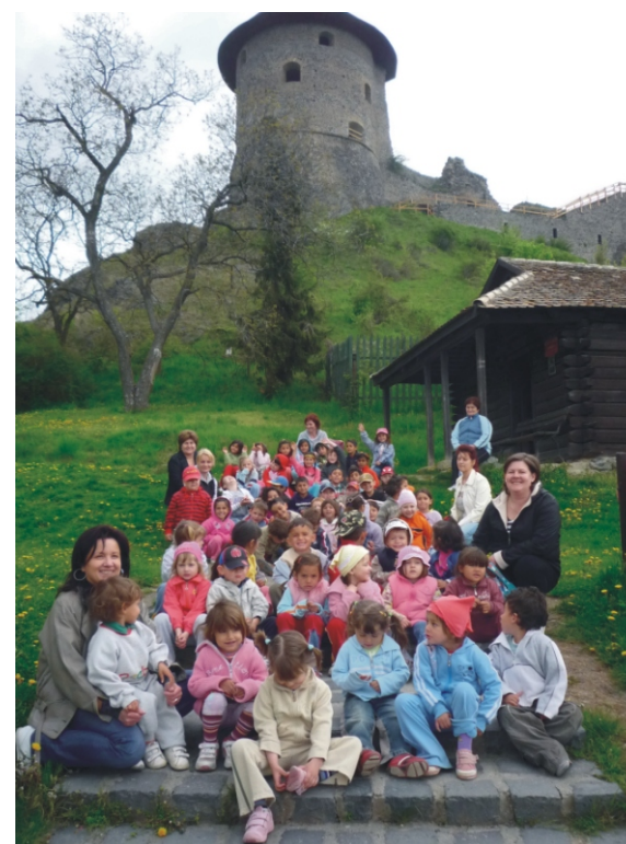
Pihenő a somoskői vár alatt