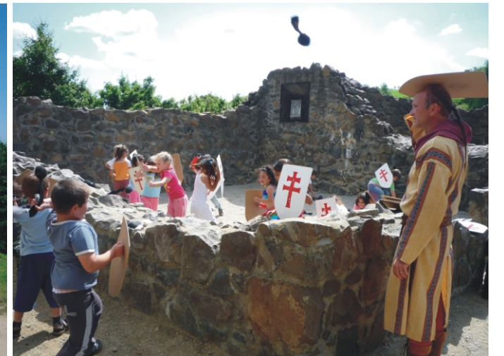
Csata a várban

Mindkét kirándulás alátámasztotta azt a véleményünket, hogy az óvodáskorú gyermekek életkori sajátosságaiból adódóan sokkal szerencsésebb a rövid távra szervezett kirándulás, mert az élmények nagysága nem a megtett kilométereken múlik.