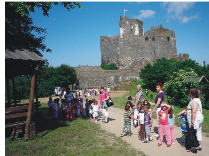
A hollókői vár előtt

akkoriban az élet. A rövid bevezető után igazi csata részesei lehettek a gyerekek. Pajzsot és zoknigombócból készült „harci eszközöket” kaptak, amivel élményszerű ütközetet vívtak. A nagyobbakkal már a vár körbejárására is vállalkoztunk. Az Ófaluban tett séta közben pogácsát ettünk, majd felfrissülést nyújtott egy finom fagyalt elfogyasztása.