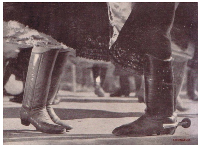
Piros-, és sarkantyús rimóci csizmák Fotó a Paulini: Gyöngyösbokréta című könyv hátoldalán