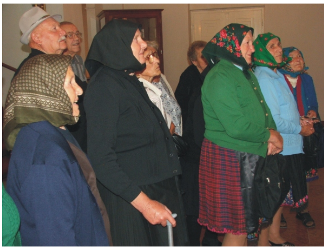
Az idősek érdeklődéssel nézegették a fényképeket