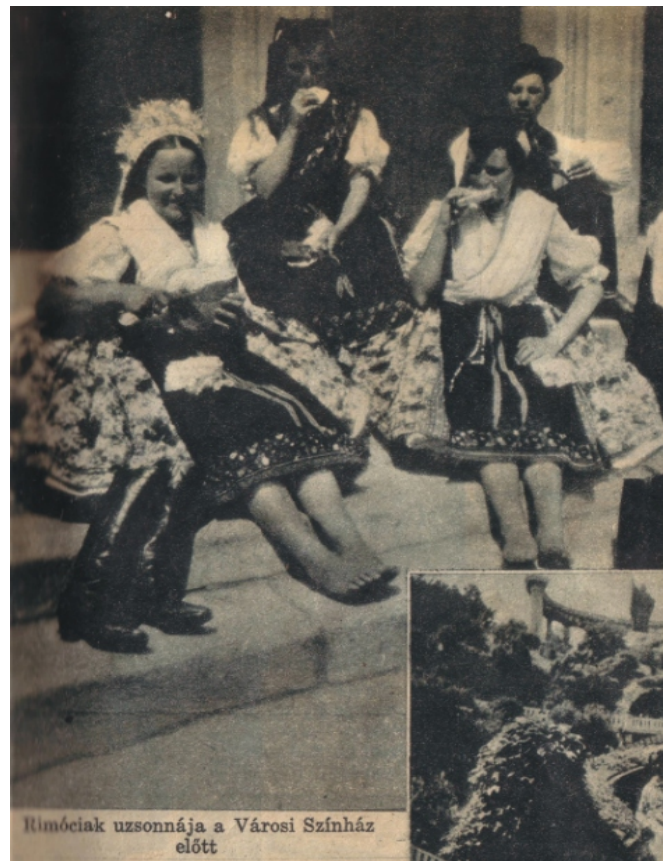
Paulin Béla cikkgyűjteménye IV. k. OSZMI (évszám nélkül)

A Gyöngyösbokréta mozgalom budapesti bemutatóit minden évben Szent István ünnepének hetében tartotta. Az előadásokat úgy osztották be, hogy két-három napon keresztül nyolc-tíz csoport lépett fel, majd ezeket másik nyolc-tíz követte. A főváros fedezte az anyagi kiadásokat: az utazást, szállást, ellátást, a színházbért és a közönségszervezést.