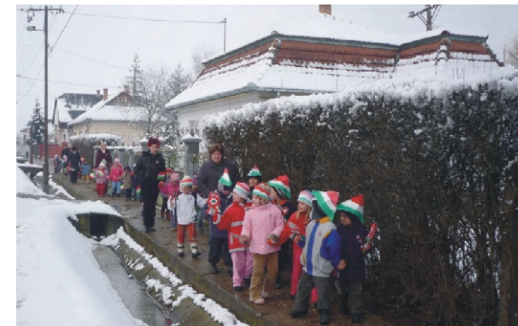
Úton a Petőfi szobor felé