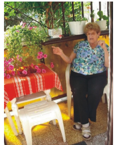
Balassagyarmat, 2010. február 27.