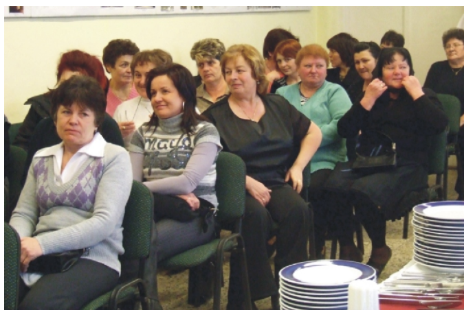
Hölgyek a műsorra várva