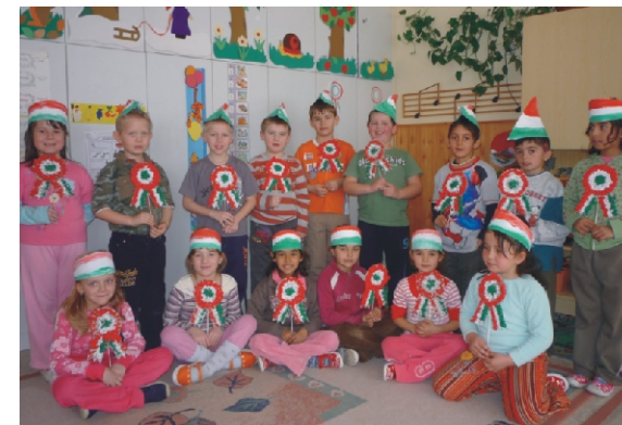
Ünnepi előkészület a csoportban

Ezért mi ma arra emlékezünk, hogy régen ezek az emberek sokat tettek azért, hogy nekünk ma jobb legyen.