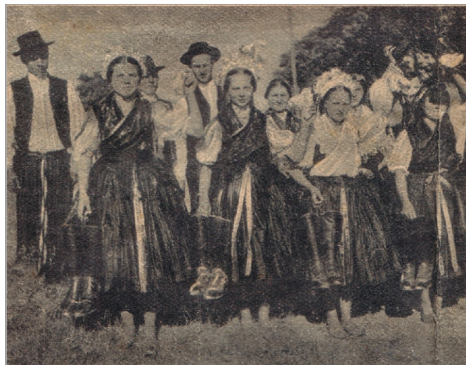
Mezítlábas bokréta. A rimóciak megkímélik piros csizmájukat s közben viszik a város határáig

Mintha vonatunk, is érezné a fojtogató meleget, ezért megy olyan lassan, hogy az alig 100 kilométeres utat Balassagyarmatra négy óra alatt teszi meg. A közvetítés helyszíne a gyarmati ligeti sportpálya. Az országút szélén