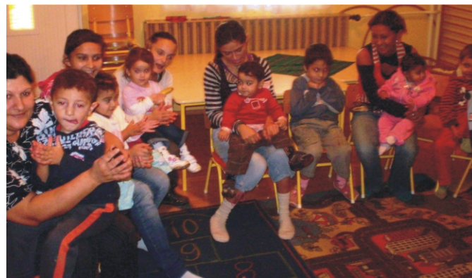
Következő programunk a karácsonyi díszek készítése volt. Voltak, akik elkészítették a karácsonyfájukra a gömböket, angyalkákat, szalagokat. Nagyon szép, harmonikus díszek készültek.