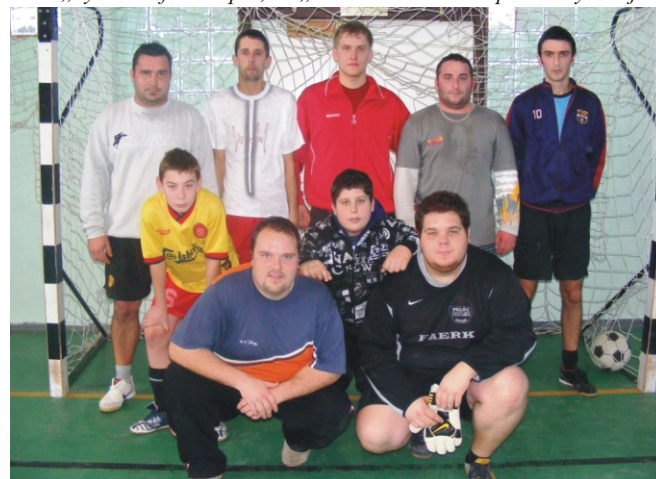
A „Nyúl-Dzsörzi” csapat, a Tapsi-Hapsi Kupa I. helyezette