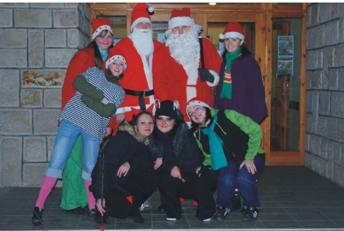
A fiatalok Mikulás csapata

Másnap aztán öröm volt látni a gyermekarcokat, amikor itt az óvodában újra találkoztak a Mikulással, aki az óvodai hagyományhoz híven a csoportokba is hozott csomagot és játékokat.