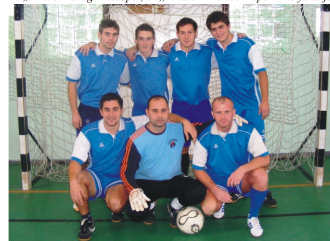
A „Favorit” csapata, a „Profi” Rimóc Kupa I. helyezette