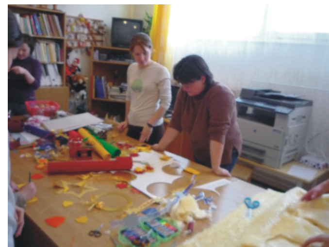
Készülnek a díszek