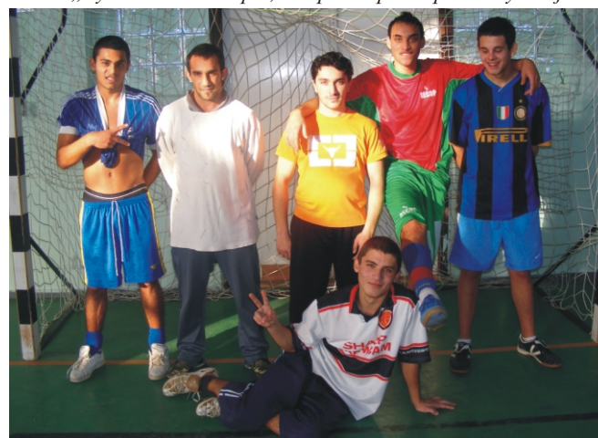
A „Brazilok” csapat, a Tapsi-Hapsi Kupa II. helyezette