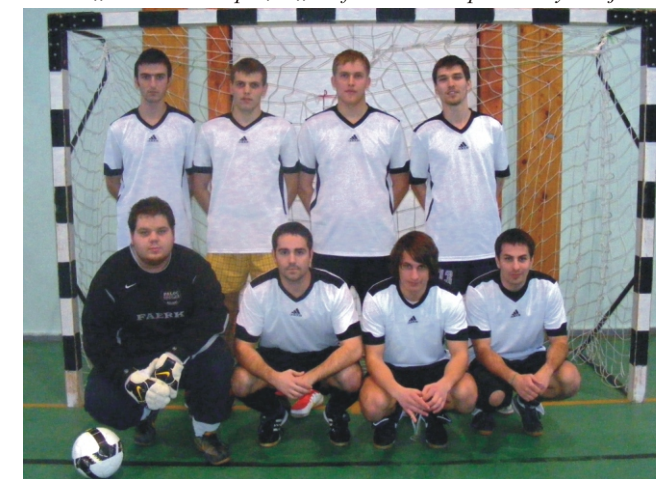
A „Club Classics” csapat, a „Profi” Rimóc Kupa III. helyezette