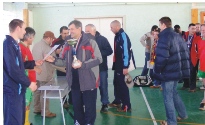
A „Syscon Kft.” csapat, az „Amatőr” Rimóc Kupa I. helyezette