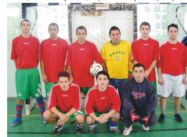
A „Brazilok” csapat, a „Profi” Rimóc Kupa II. helyezette