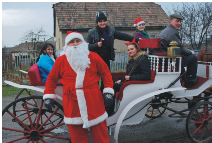
Munkában a Mikulás

December 6-án délután meghallottuk, hogy a házunk előtt csenget a Mikulás!