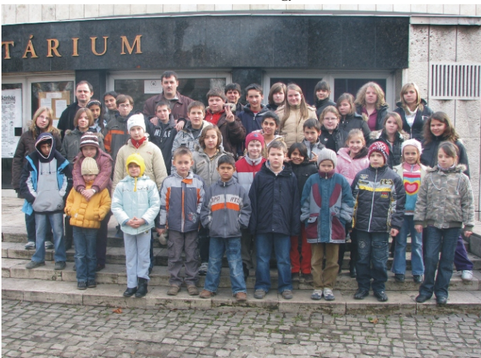
A Planetárium előtt