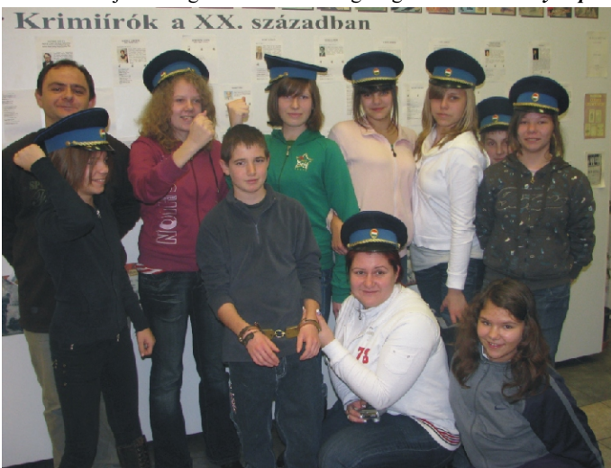
Rimóci kirándulók a Bűnügyi Múzeumban