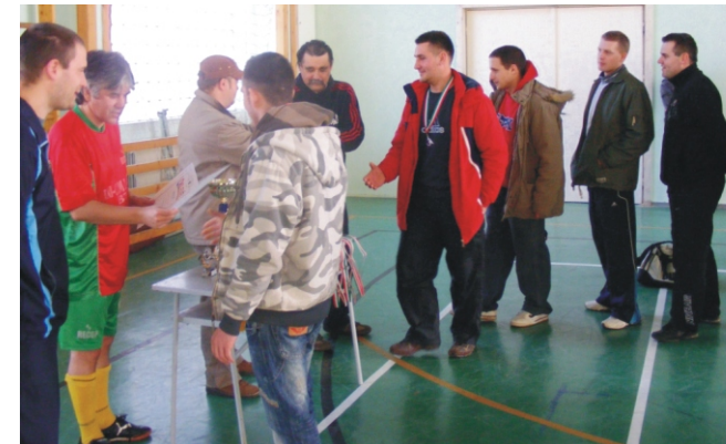
A „Rimóci Favágók” csapat, az „Amatőr” Rimóc Kupa II. helyezette