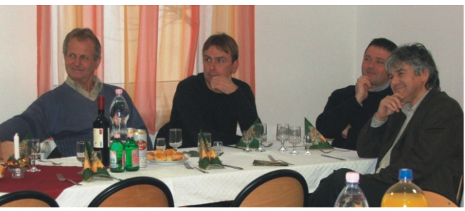
A nyertes rimóci pályázók egy része a nyilvános eredményhirdetésen

Az Új Magyarország Vidékfejlesztési Program által kiírt úgynevezett III. tengelyes pályázatok eredményeiről olvashattunk már elmúlt lapszámunkban és a megyei hírlapban is, most itt is szeretnénk közreadni azokat a nyertes pályázatokat, amelyek sikerrel vették a pályázat beadásával, hiánypótlásával és elbírálásával kapcsolatos akadályokat. Ki kell emelni, hogy a program utófinanszírozott, ami azt jelenti, hogy a megítélt támogatást a pályázóknak meg kell előlegezniük, továbbá mikro-vállalkozás esetén 35 % saját erőt, illetve az önkormányzatnak az áfát kell majd biztosítania a támogatás mellé. Reméljük, ezeket a nehézségeket is áthidalják majd a nyertesek, a megvalósítás sikeres lesz, így új munkahelyek jönnek létre, megszépült templommal, Szent Erzsébet térrel gazdagodik községünk és új szolgáltatásokkal bővül vendégházunk! A nyerteseknek ezúton is gratulálunk!