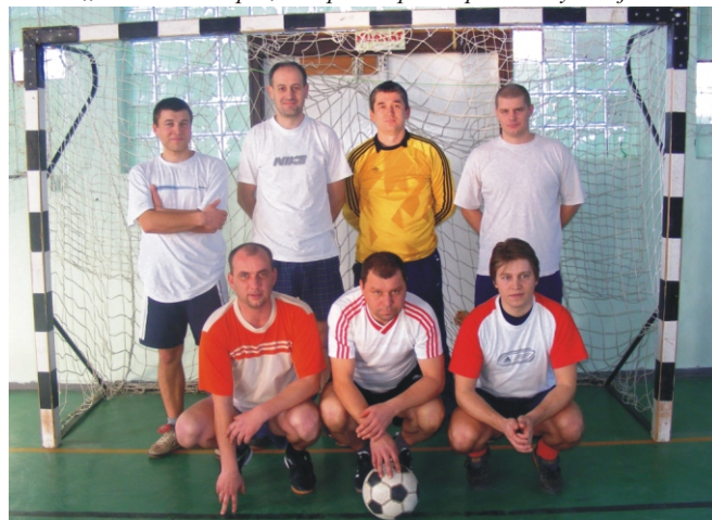
A „Hamasz” csapat, a Tapsi-Hapsi Kupa III. helyezette