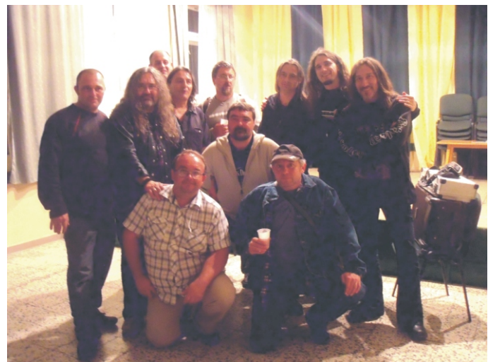
A rendezők az együttes tagjaival