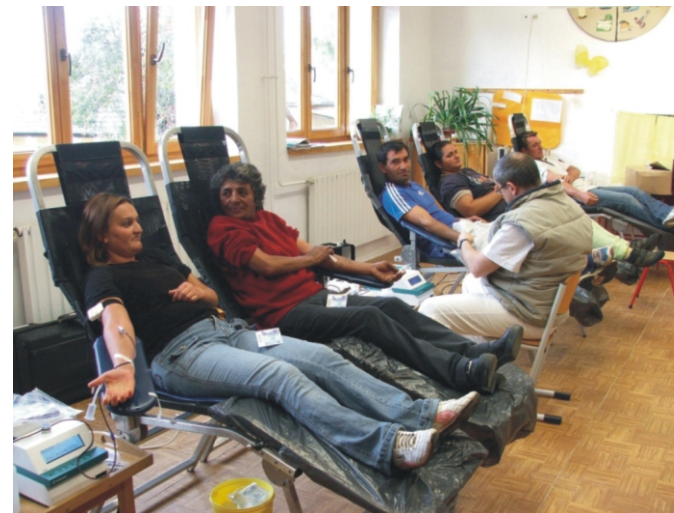
Sok volt az új véradó is