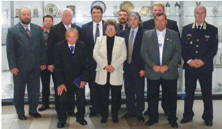
Nógrád megyei küldöttség