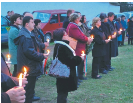
Az ünneplők egy csoportja

jutalmazása és a „Rimóc Községért” díj átadása zajlott (ezúton is gratulálunk a díjazottaknak). A díjátadó előtt az alsó tagozatosok adtak elő egy vicces bohózatot, mellyel jobb kedvre derült a publikum. Köszönjük szépen nagyon ügyesek voltak. Rimócon így emlékeztünk.