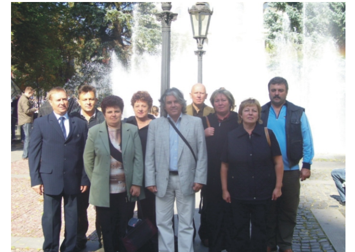
A képviselők Kassán