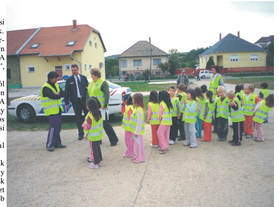
A „cseresznye” nagycsoport a rendezvényen