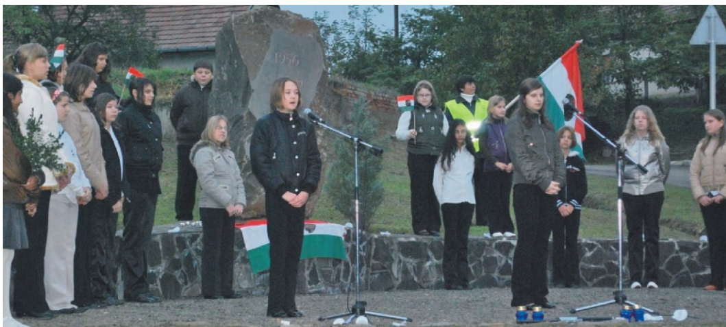
Az iskolások műsora

jutalmazása és a „Rimóc Községért” díj átadása zajlott (ezúton is gratulálunk a díjazottaknak). A díjátadó előtt az alsó tagozatosok adtak elő egy vicces bohózatot, mellyel jobb kedvre derült a publikum. Köszönjük szépen nagyon ügyesek voltak. Rimócon így emlékeztünk.