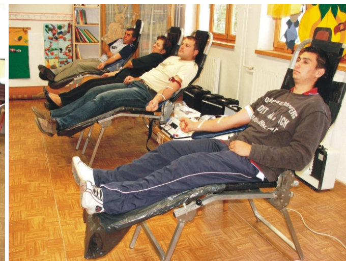
Szinte soha nem voltak üresek a véradás székek