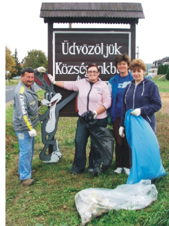
A kis csapat

flakonokat és alumínium dobozokat. Erre a tervek szerint minden hónap utolsó hétvégéjén kerül sor. Kérjük, gyűjtse össze Ön is a háztartásában keletkező újra hasznosítható hulladékokat, és ha szeretné, hogy ezt elszállítsuk, jelezze ezt bármelyik Kobak tagnál! A szállításkor természetesen az elektromos hulladékot és a nagyobb mennyiségű műanyag kupakot is elszállítjuk.