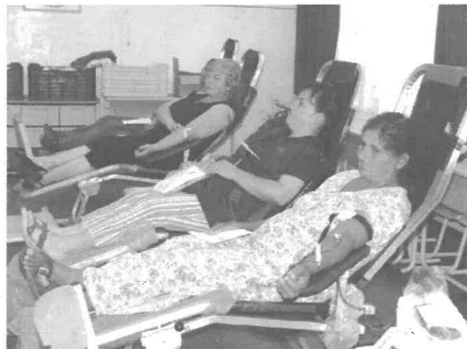
Szinte folyamatosan foglaltak voltak a véradók székei