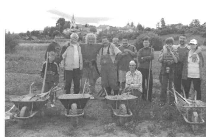
Akik a végére maradtak...

másfél földkupacot is sikerül szétteríteni. A szervezők nevében ezúton is köszönetemet fejezném ki mindazoknak, akik részt vettek a meghirdetett társadalmi munkában, és ha csak kis mértékben is, de ezzel is hozzájárultak településünk fejlődéséhez. Várunk MINDENKIT legközelebb a meghirdetett időpontban! Figyeljék felhívásunkat a tv-ben vagy a plakátokon!