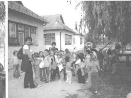
Csodálkozva néztek körül udvarunkon a szécsényi ovisok