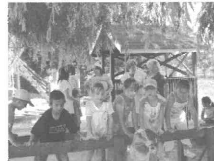
Játék közben a varsányi ovisok