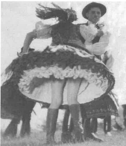
„Perdül a szoknya...” - 1938.

látom mindig. Azt a különleges fejet, amit egyébként az örökké szájában füstölőgő büdös kis pipával együtt meg kellene mintázni egy akkora darab kőből, mint maga a városi színház... (Fele is megfelel. A szerk.)