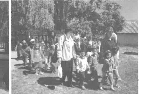
Hazafelé indulnak a nógrádmegyeri ovisok