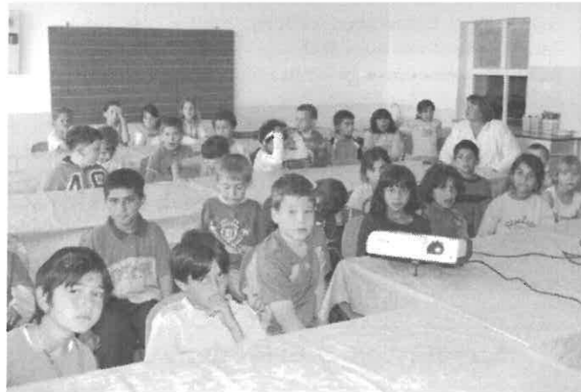
Az 1. és 2. osztályosok