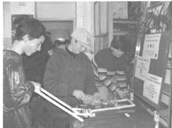
A gyerekek körében is nagy sikert aratott a tömörítőgép