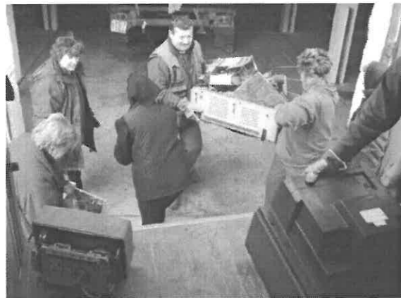
Elektromos hulladék szállítás közben

Bár utoljára 2008. decemberében adhattunk hírt a Kobak táján történetekről, ez nem azt jelenti, hogy nincs miről beszámolnunk, így nézzük át közösen az elmúlt időszakot röviden.