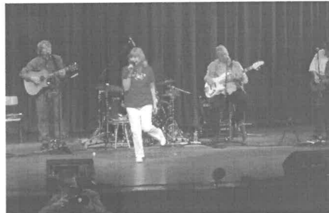
Halász Judit és zenekara koncert közben

Telt ház volt a szécsényi Művelődési Házban március 6-án, amit a környékbeli óvodás gyermekek töltöttek meg. A gyermekeknek már maga az utazás és a nagy tágas terem a sok gyermekkel is élmény volt, de mikor felhangzottak az ismerős dallamok, nagy tapssal fogadták a művésznőt. Közös énekléssel, jó kedvvel töltöttük el ezt a délelőttöt, ami felejthetetlen élmény volt felnőtteknek, gyermekeknek egyaránt.