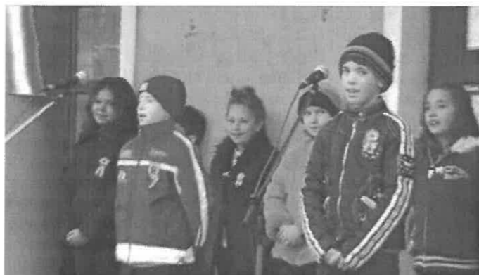
Az alsótagozatos gyerekek