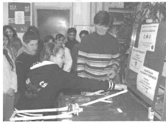
Sorban álltak, hogy mindenki kipróbálhassa a tömörítést