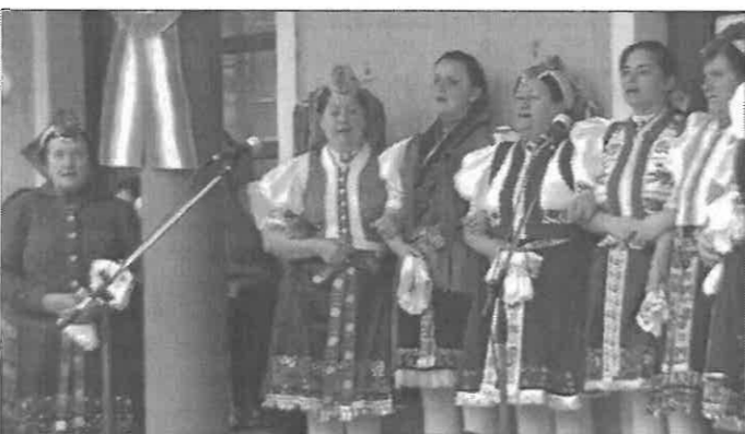
Rimóci Hagyományörző Együttes