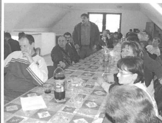
A közgyűlésen résztvevők egy csoportja