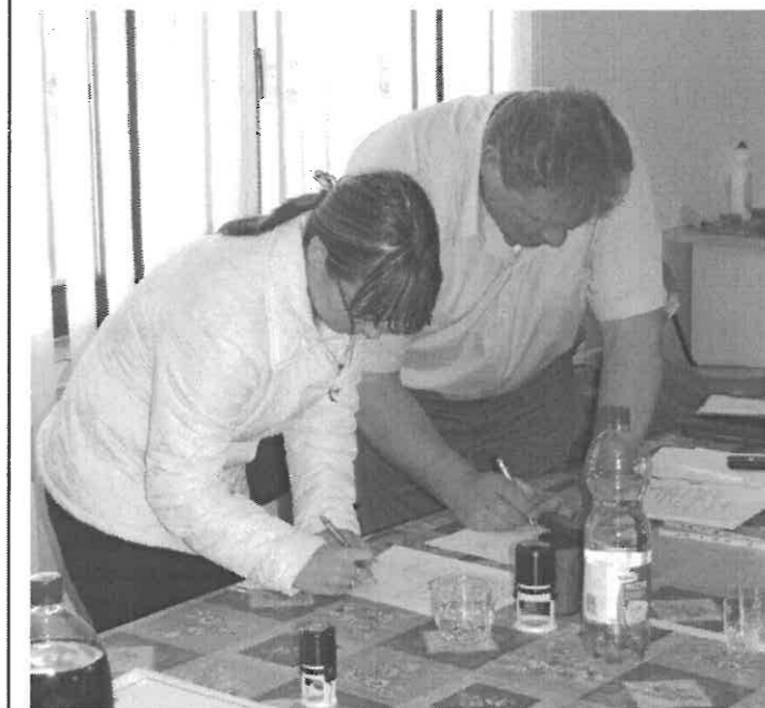
A két egyesület elnöke aláírásával látja el az együttműködési megállapodásokat, hogy a célok írásbani lefektetésével is megerősítsék fentebb felsorolt szándékait

Reméljük a fenti együttműködések a szervezeteket és az intézményt tovább erősítik, a lakosság pedig minél nagyobb számban fog bekapcsolódni a közös programjainkba.