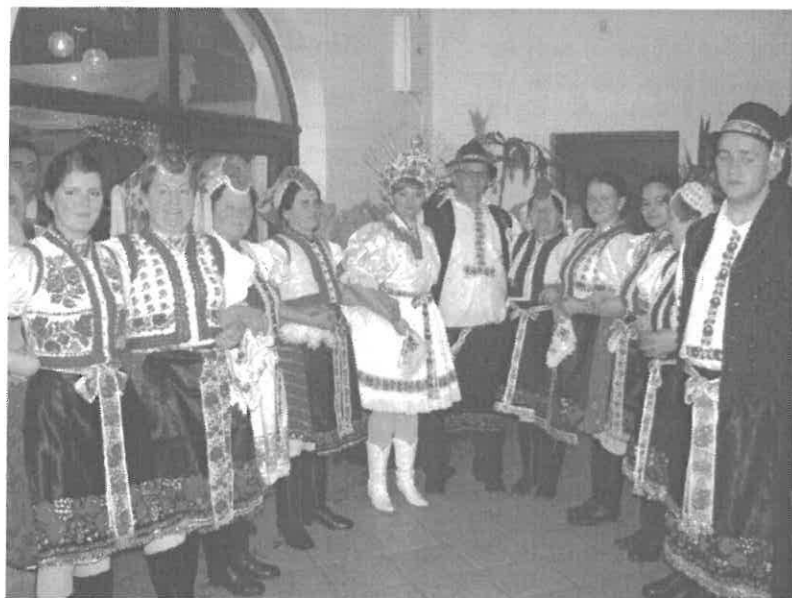
A Rimóci Hagyományörző Együttes az ifjú párral

A Hagyományörző Együttes repertoárjában számos népszokás feldolgozásra került. Köztük a rimóci lakodalmas is. A lakodalom egésze és ebből külön részletek is. Több alkalommal vettünk részt az országban megrendezett lakodalmas fesztiválokon, ahol a legnagyobb sikere a RIMÓCI LAKODALMASNAK volt, és van jelenleg is. Sok meghívást kap az együttes. Sikereik töretlenek. Nem csoda, hiszen az évtizedek óta működő csoport együtt van, mindenki egyet akar, megőrizni a hagyományt.