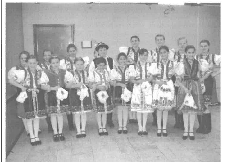
A Kukorgós Néptánc csoport