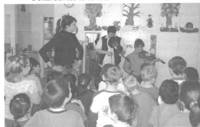
Néptánc tanulás az oviban

A néptánc motívumaival ismerkedhettünk március 12-én, amikor egy fiatalokból álló kis társulat látogatott el az óvodánkba. Játékos, zenés-táncos keretek között jól motiválták a gyermekeket, hiszen örömmel kapcsolódott be minden ovis a mulatságba. A műsor után minden gyermek arcát kívánsága szerint kifestették, amiről fényképek készültek.