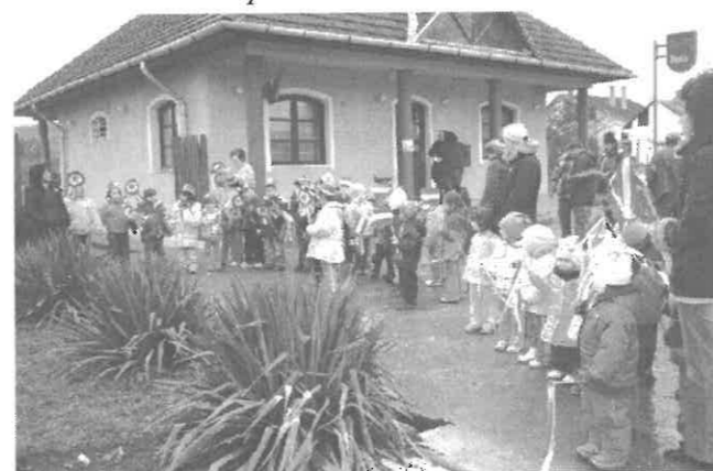
Megemlékezés közben az óvodások

Énekeltek a középsősök a közös óvodai, ünnepi megemlékezésen március 13-án, amikor lobogókkal, zászlókkal, kokárdákkal körülálltuk Petőfi Sándor szobrát. A rossz idő ellenére lelkesen mondtuk a tanult verseket, dalokat, köszöntöttük az ünnepet.