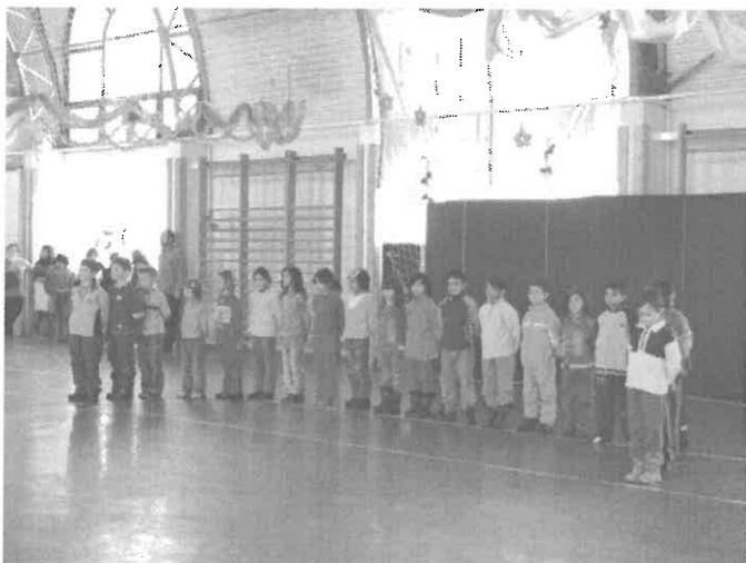
Az alsós gyerekek