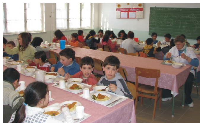
Az új ebédlőben

Az elmúlt években diákjaink ebédeltetése két helyszínen zajlott: míg az 1., 2. osztályos gyerekek az óvoda melletti volt szolgálati lakásban étkeztek, addig a 3., 4. osztályos - illetve a felsősök megosztva - az Idősek Klubjában teheték ugyanezt. Bizony sokszor esőben, sárban, hóban, fagyban, vagy tűző napsütésben kellett megtenniük az oda vezető utat, a helyek adottsága miatt csak szűkösen tudtak megebédelni.