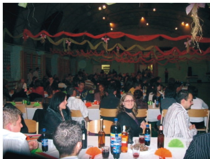
A vacsora előtt