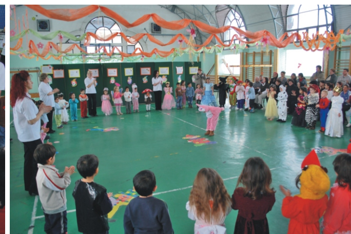
Mindenki egyesével mutatta meg jelmezét