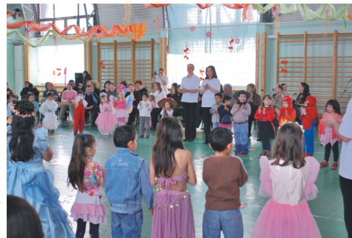
A jelmezes gyerekek bevonulása után

Reméljük, hogy jövőre is hasonló keretek között tudjuk megrendezni a legkisebbek napját farsang idején.