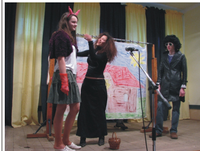
Szintén a győztes csapat tagjai