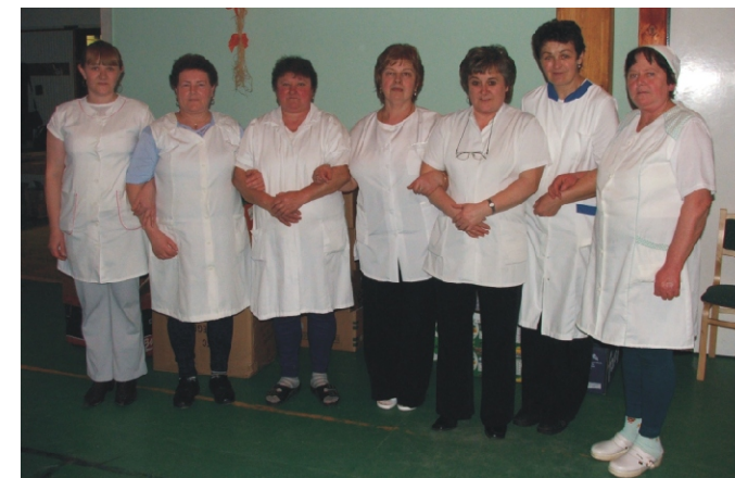
A nap szervezői, az Idősek Klubja dolgozói