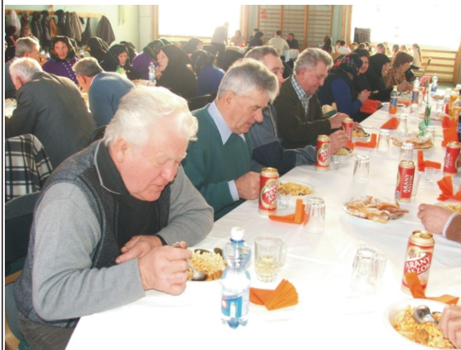
101 fő hetven éven felüli fogadta el a meghívást az Idősek Farsangjára

Nekem nagyon meghatóak az Idősek Farsangjának rendezvényei, amelyeken mindig szívesen veszek részt. Az idei különleges volt, mert már hét éves korom óta táncolok és a ludányi mamám most látott először táncolni.