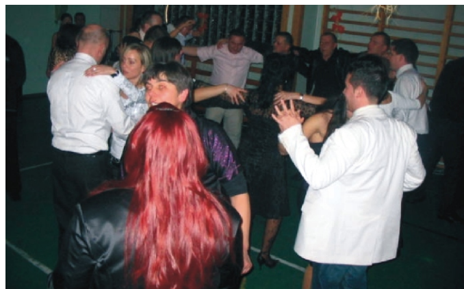
Az idei bál is jó hangulatban telt