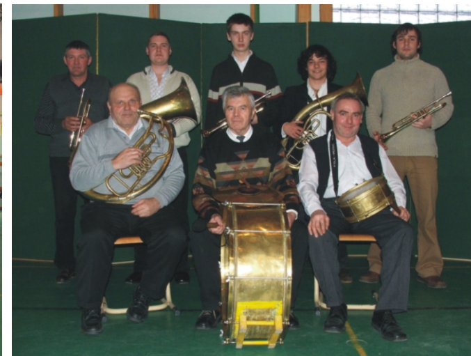
A Rimóci Rezesbanda