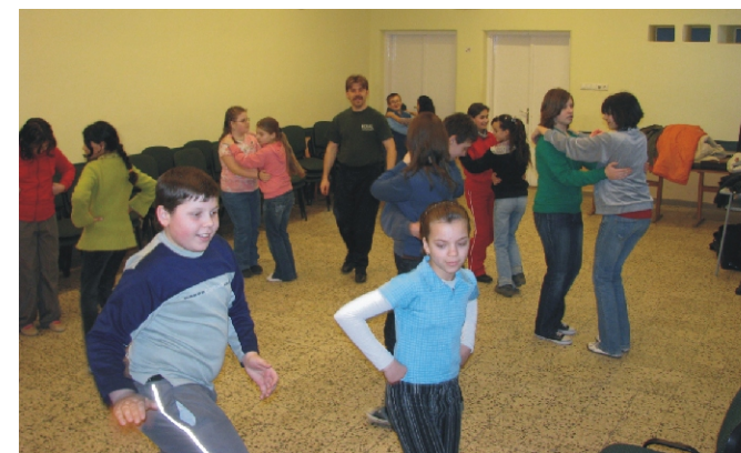
A néptáncot tanuló gyerekek

Iskolánk is csatlakozni szeretett volna ezen nemes célhoz, ezért hirdette meg az elmúlt 2 évben a hagyományörző szakkört; sajnos azonban teljes érdektelenség övezte kezdeményezésünket, hiszen egyetlen jelentkező sem akadt.