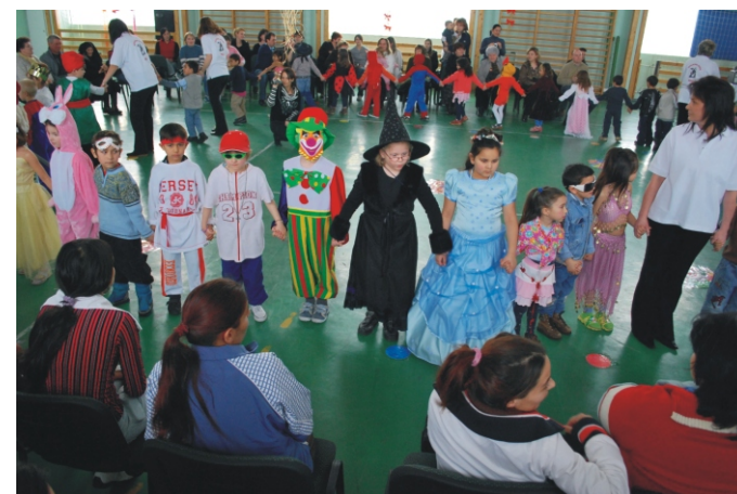
A körtánc is nagy sikert aratott