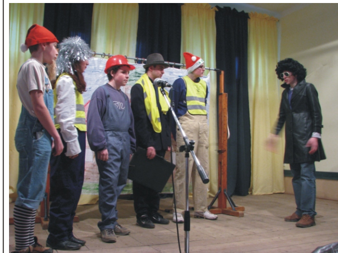
A győztes 8. osztály jelenete