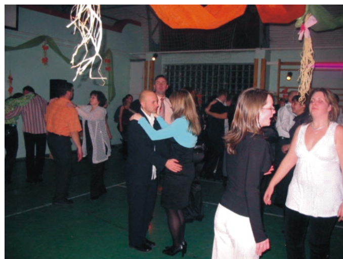
Egyszer mindenki táncra perdült