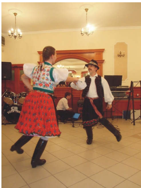
A fiatalok tánc közben

a Szent Kereszt Felmagasztalása Plébániáért Alapítvány elnöke