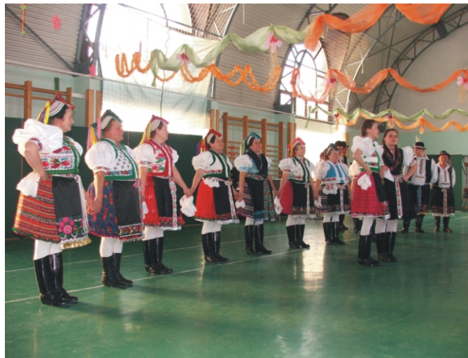
A Rimóci Hagyományőrző Együttes