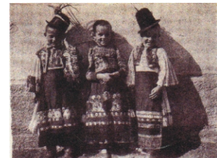
BUDAPEST 1934 VIII., 14–21.

A mozgalom történetének bemutatását kicsit korábbról kell kezdenünk. Az 1848/49-ben bekövetkezett forradalom és szabadságharcban, majd az ezt követő időkben Magyarország nemzeti érzeit csorbítani próbálták, amennyire csak lehet. A kiegyezést (1867) követően az I. világháborúig a megbántott nemzeti önérték a gazdasági fejlődés hatására is ismét magára talál és újból „saját értékeink” felé fordul. Ez az érdeklődés és önérték csúcspontja az 1896-os budapesti Millenniumi Kiállításon.