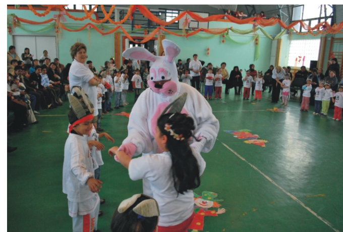
Nyuszi tánc közben