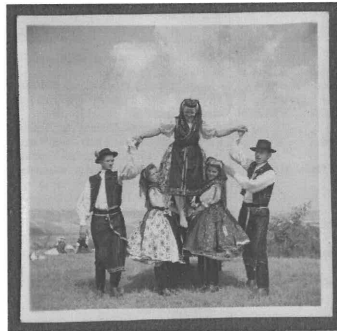
Hidas játék (1938.)

A bemutatók hullámzó szintje miatt a Vallás- és Közoktatásügyi Minisztérium a Néprajzi Múzeum szakembereit kérte fel a műsorok előzetes