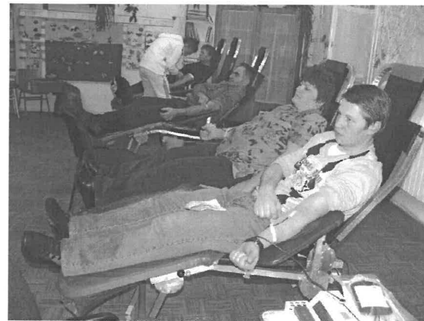
A vérükkel életet mentő véradók