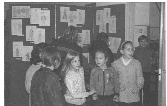
A kiállítás megnyitóján