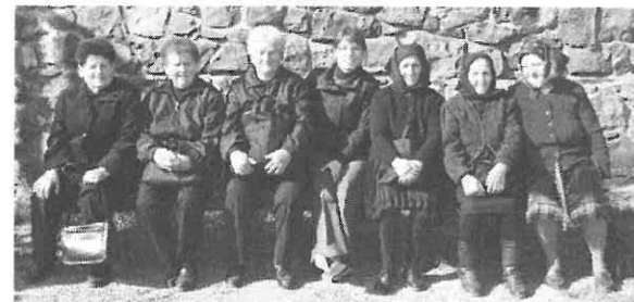
Egy kis pihenő a hollókői vár lábánál