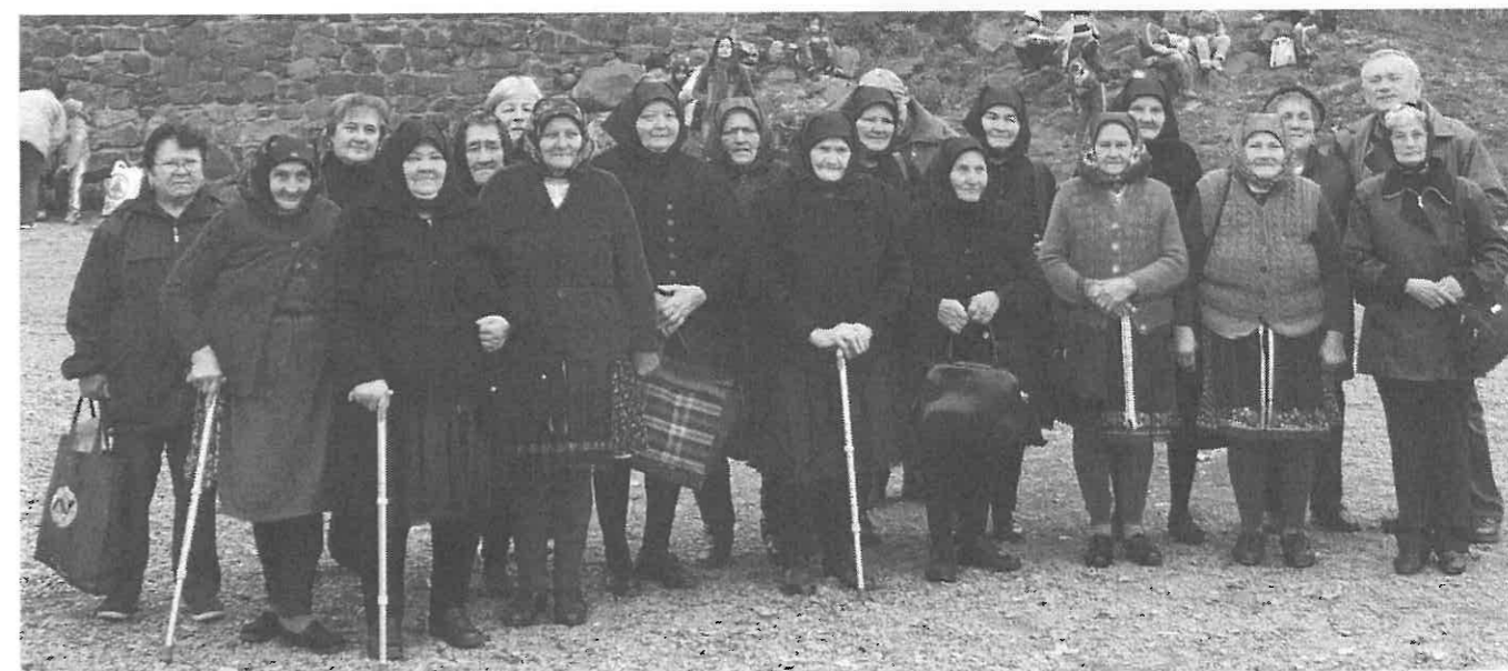
2008. október 28-án Hollókőben a vár előtt egy másik rimóci csoport