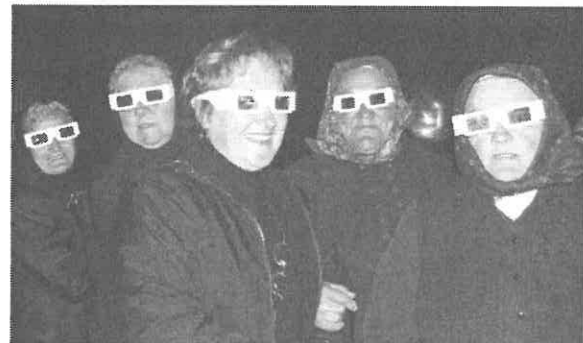
Rimóci asszonyok a háromdimenziós moziban