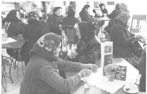
Ebéd utáni kávézás Hollókőben