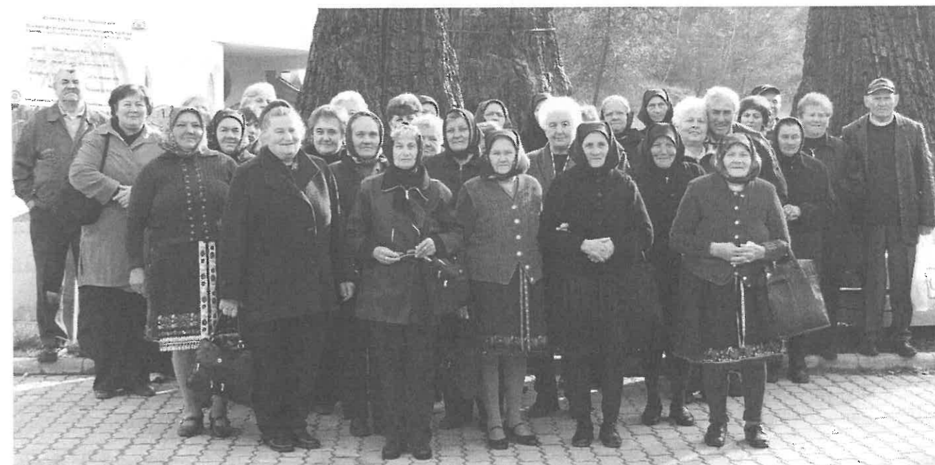
2008. október 25-én Ipolytarnócon az „Ősmeradványok Világa” bejáratánál