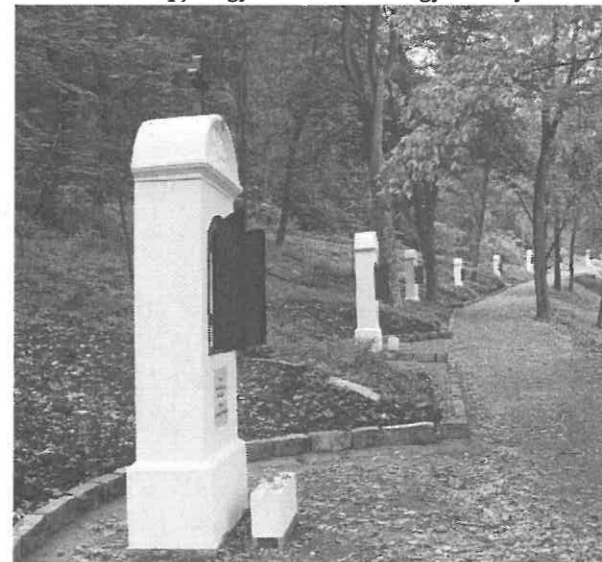
A felújított keresztút