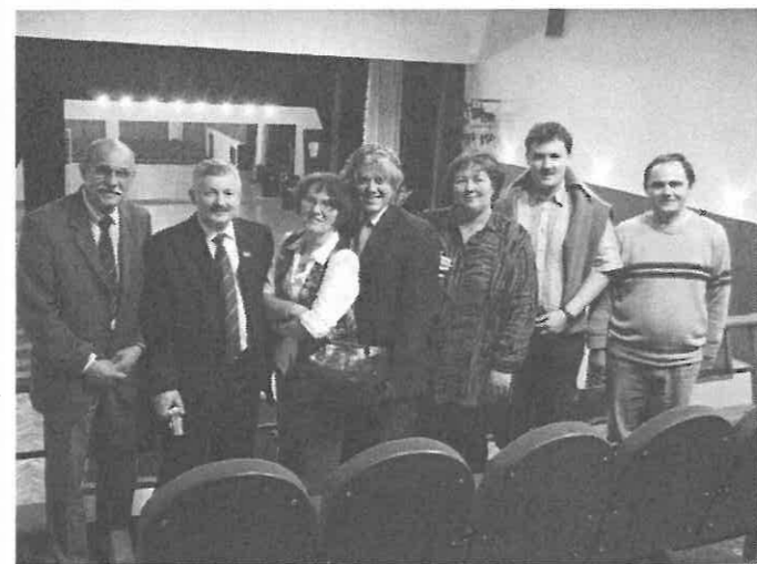
A rimóci delegáció a lengyelországi Warta településen