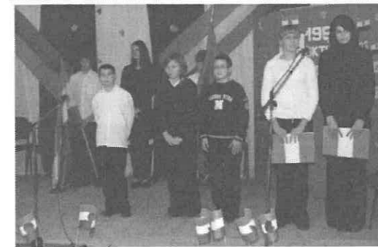
Az általános iskolások megemlékezés közben

„Szenvedéseink egyik oka az, hogy mások példája után megyünk, nem értehnünk irányít bennünket, hanem a megszokást követjük.” Seneca