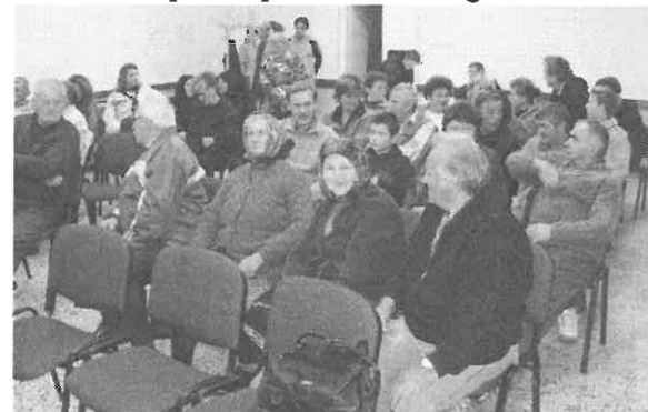
A filmvetítésre várva