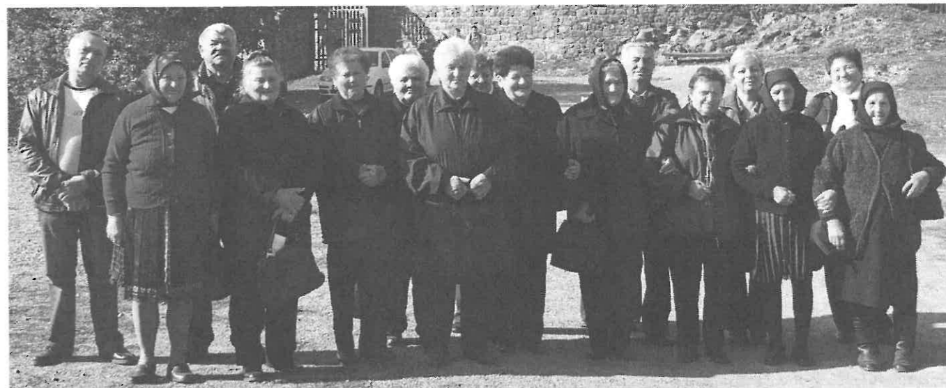
2008. október 19-én Hollókőben a vár előtt