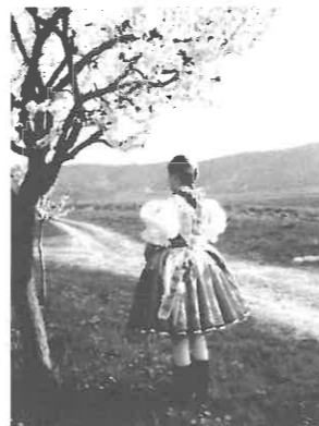
A nyertes kép

A fotópályázat 3. fordulójának képei az újjászületés évszakát mutatják be gyönyörű szíromból készült ruhába öltöztetve a falut. A hét pályázó 17 munkájából kellett a zsűrinek válogatnia, kijelölve a jók között a legjobbakat. A zsűri a szimbolikus jelentéssel bíró fotókat értékelte a legművészebbeknek, így ezeket jutalmazta a legtöbb pontszámmal. Az alkotók kilétére most is a díjátadáson ered-