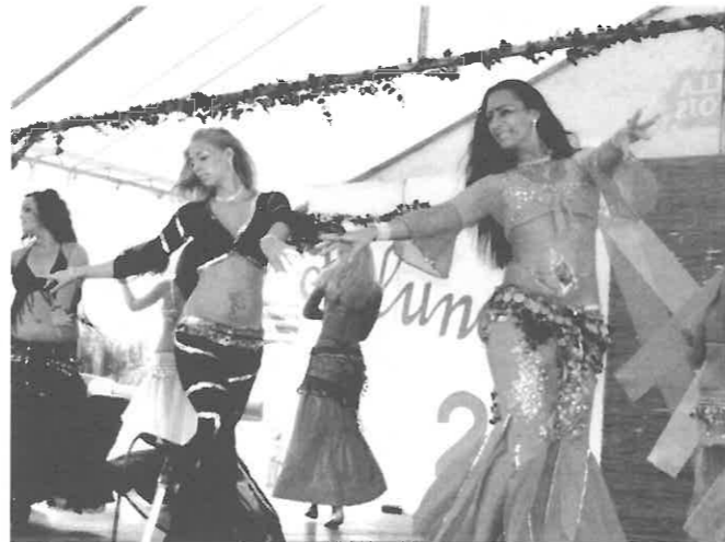
Az Agra hastáncos csoport