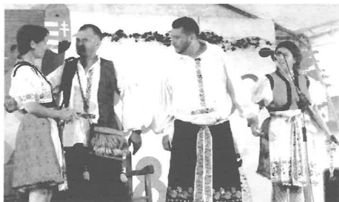
A varsányi AVAR Színpad