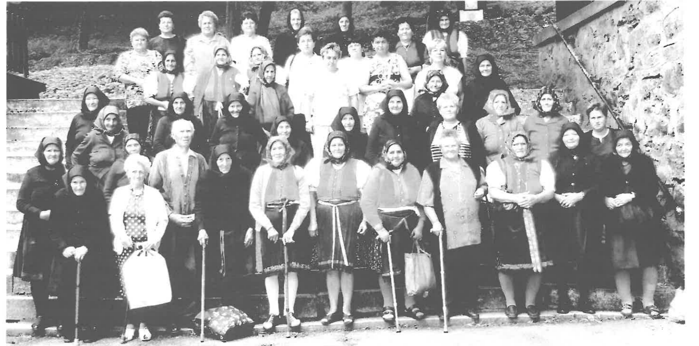
Az Idősek Búcsújának résztvevői a Szentkúton