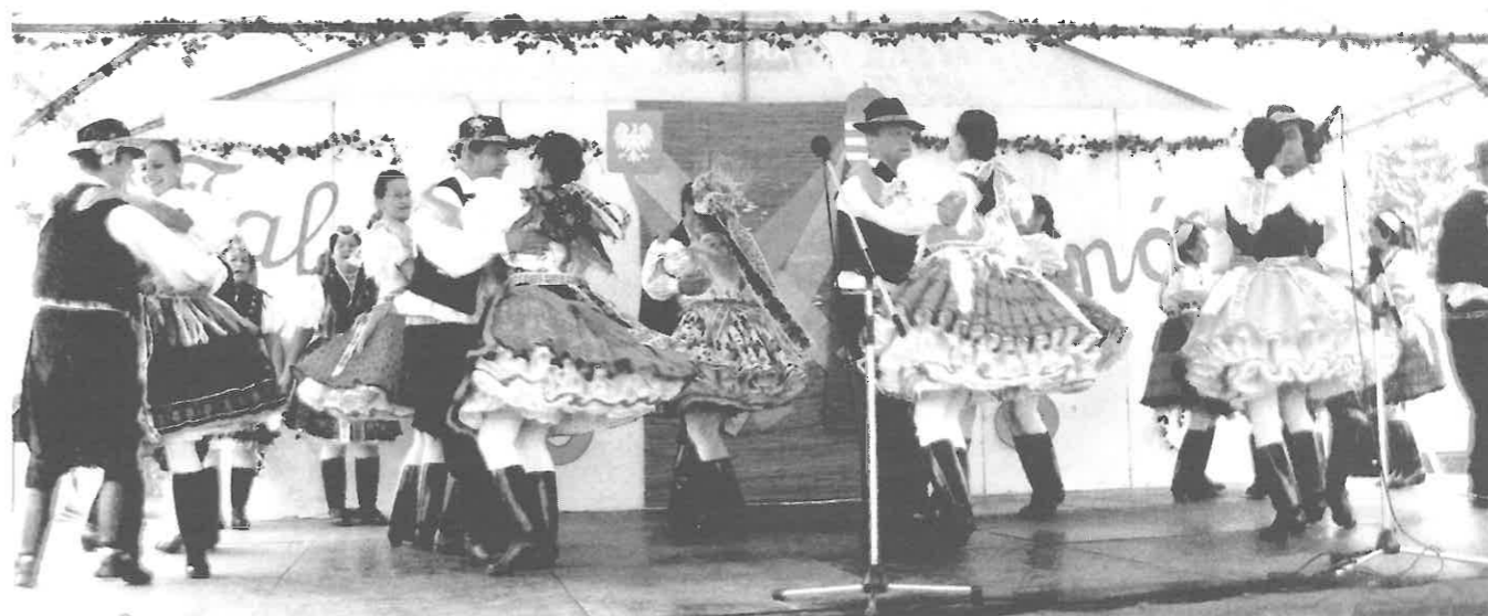
A Rimóci Hagyományőrző Együttes