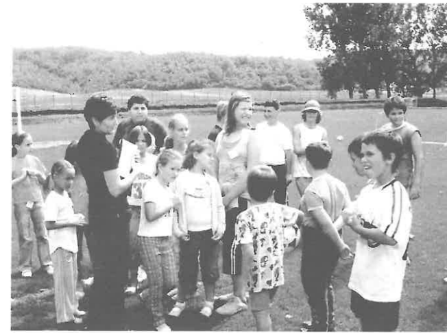
A gyerekek játékra készen

Az idén már a harmadik alkalom, hogy megrendezhettük a Plébániai Játszóházas Napokat, mely azzal a szándékkal jött létre, hogy minél több rimóci hívő fiatal hozzon össze egy pár napra kis közösséget. Az idei Plébániai Játszóházas Napok megszervezése és lebonyolítása sokkal több figyelmet, energiát és nagyobb felelősséget igényelt a szervezőktől, mint eddig. Már a helyszín is eléggé különlegesnek bizonyult, hiszen hogyan jöhet szóba egy Plébániai Játszóház lebonyolításához egy sportöltöző és sportpálya? Azt kell, hogy mondjam jobb lehetőségünk nem volt, hiszen a hunyadi úti iskolát felújítják, ezért nem szervezhettük oda a programot, mint eddig. Ezért új lehetőségek után kellett néznünk. Több helyszín is szóba jött, de mindegyiknél találtunk olyan hiányosságot, ami miatt nem volt alkalmas a tábor lebonyolítására. Az idő egyre jobban sürgett, vagy a sportöltöző, vagy elmarad a tábor. A polgármester úr felajánlásán elgondolkodva döntöttünk a