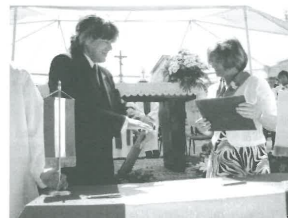
Az aláírt együttműködési partnerszerződés kicserélése

Földjeidre, kincseidre Sóvárgó szemek tapadnak, Pénzért földed, lelked el ne add! Fiaidra hagyd majdan örökül Ébredj magyar, ne szenderegj!