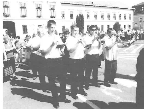
A Rimóci Rezesbanda