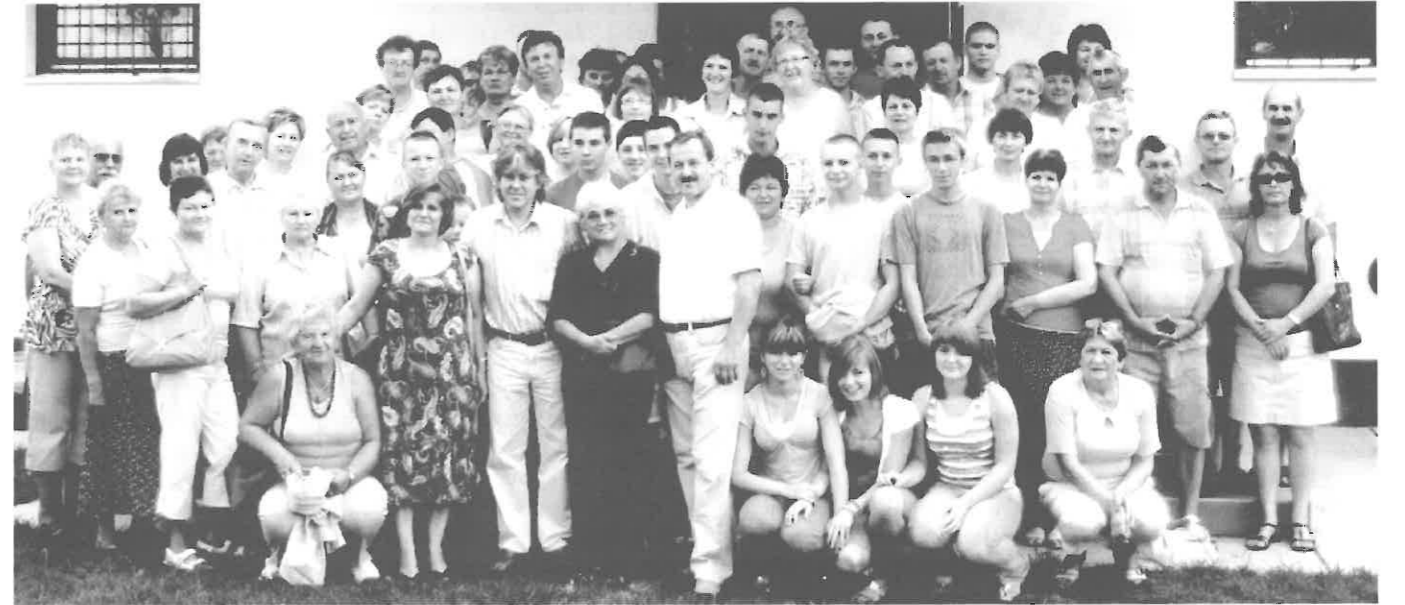
A lengyel delegáció a testvér-települések polgármestereivel