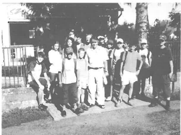
A vándortábor diákjai a rimóci polgármesterrel

fogadtatást, a szíves vendéglátást, a szakács néniknek a finom ételeket, köszönjük mindenkinek, hogy segítségünkre voltak! Reméljük, egyszer még visszatérhetünk ide!