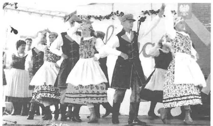
A Poddebicei csoport