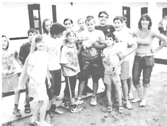
A vándortábor diákjai egy rimóci nyúllal