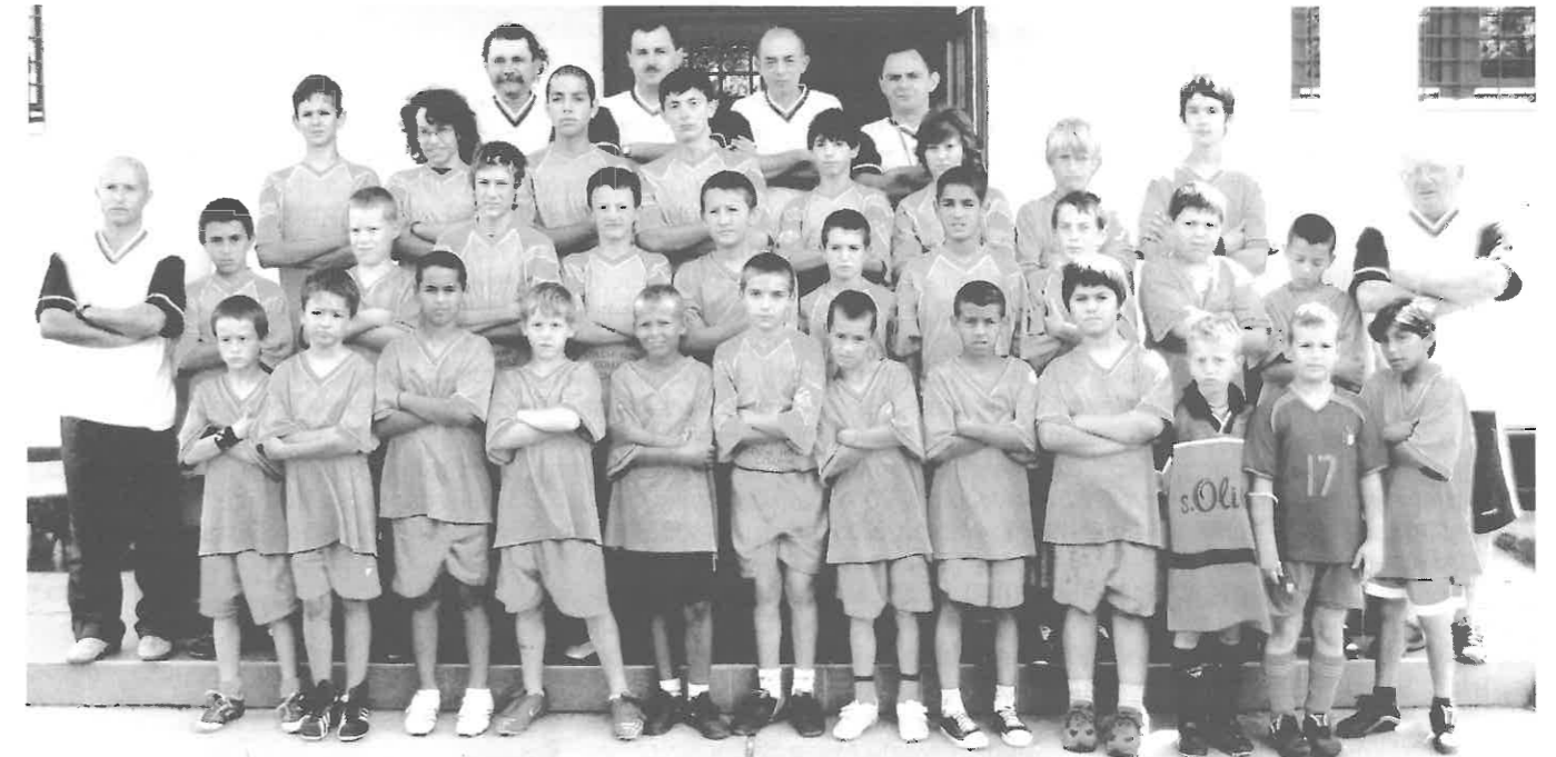
A focitábor résztvevői és szervezői