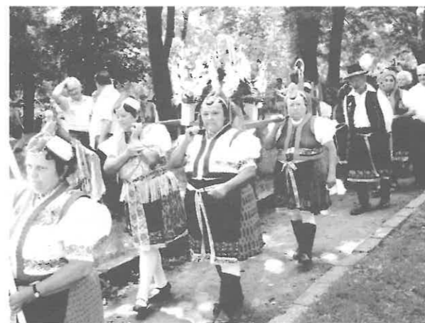
Az idén is a rimóciak vitték a Szent Anna szobrot