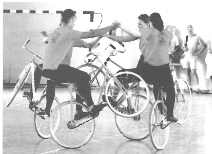
A kerékpáros bemutató