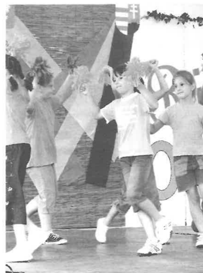
A rinóci általános iskolások