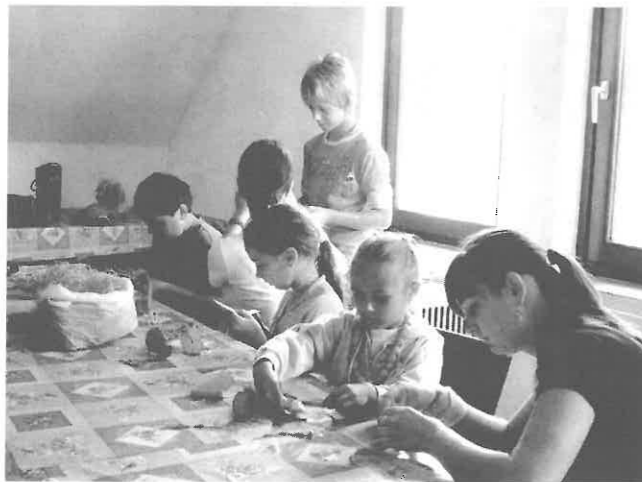
A gyerekek kézműves foglalkozás közben