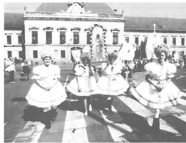
A rimóci Máriás lányok