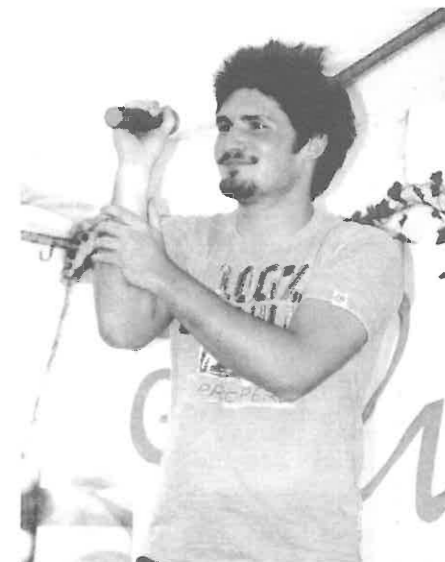
Palcsó Tamás a Megasztár döntőse