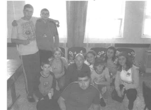
Önkéntesek és rimóciak a Mangában

Az önkéntesek az általuk Rimócon készített képekből kiállítást rendeztek a Dr. Manga János Községi Ház kistermében. A kiállítást nyitvatartási időben lehet megtekinteni.