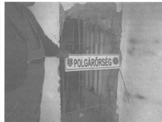
Sikerült áttörni a kemény betonfalat