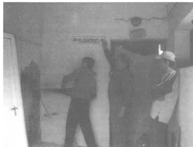
Polgárőrök munka közben