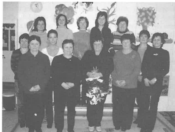
Együtt az Erzsébetekkel

További nyugdíjas éveikhez kívánunk jó egészséget, sok örömet, és köszönjük fáradtságos, áldozatos munkájukat.