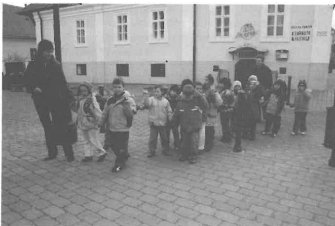
Útban a színház felé

Másnap a játéukban, rajzukban is tükröződött, hogy valóban nagy élmény volt.