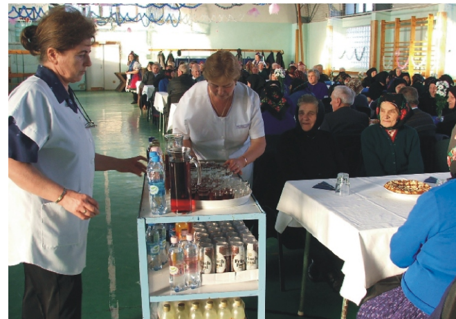
Az Idősök Klubja dolgozói kínálgatás közben