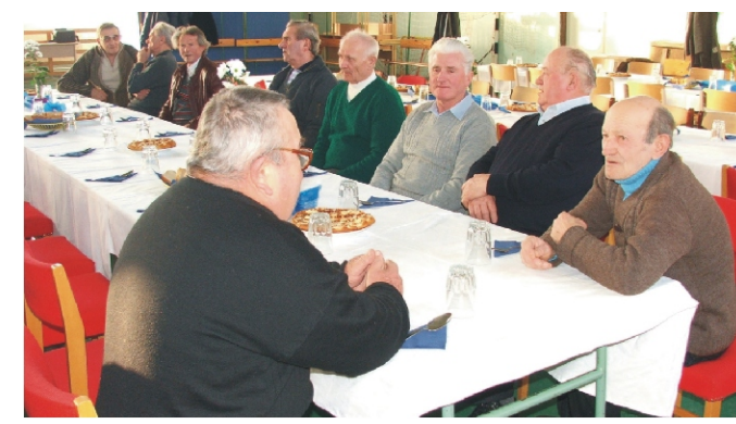
Baráti beszélgetés közben