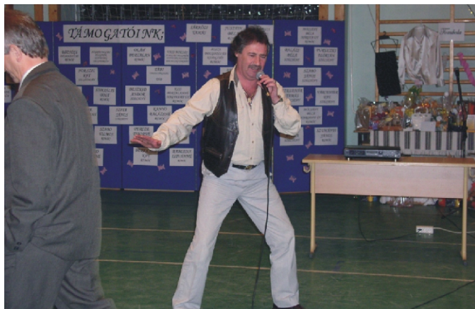
Ayala a népszerű humorista előadás közben