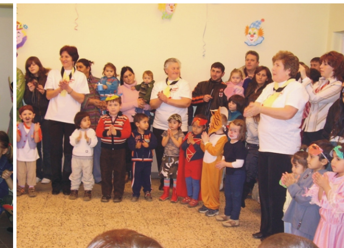
Műsor közben a farsangolók egy csoportja

„Az idei farsang most is nagyon tetszett. A gyerekek ügyesen megtanulták amit kellett. Jól néztek ki, de legjobban a lányom tetszett. Köszönöm az óvónőknek a felkészítést. Remélem jövőre is ilyen jó lesz.”