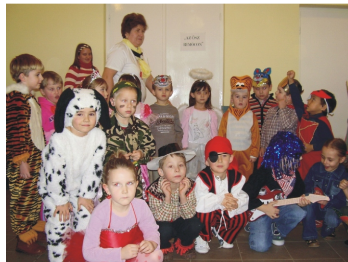
„Felöltöztünk maskarába úgy jöttünk az óvodába”