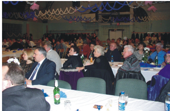
A vendégek egy csoportja