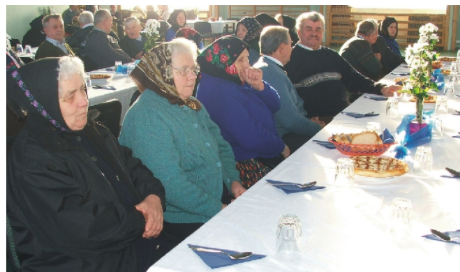
Az idősök izgatottan várták a műsort