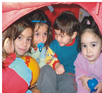
A gyerekek nagyon jól érzik magukat

A Gyerekházban ünnep-ünnepet követ. Meg-ünnepeltük a Farsangot, jelmezbe bújtak a gyerekek, elbúcsúztattuk a telet és nagy hangzavarral elűztük a rossz szellemeket. Erre az időre esett néhány kisgyermek születésnapja, amiket szintén meg-ünnepeltünk. Minden szülinapunk kapott tortát, a tortán volt gyertya és tűzijáték is. A gyertya elfújását zenés-táncos buli követte.