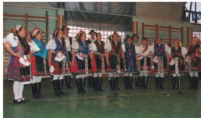
Gyöngyösbokréta Hagyományörző Egyesület műsor közben