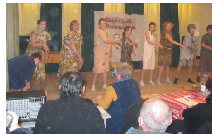
A hatodik osztály műsor közben