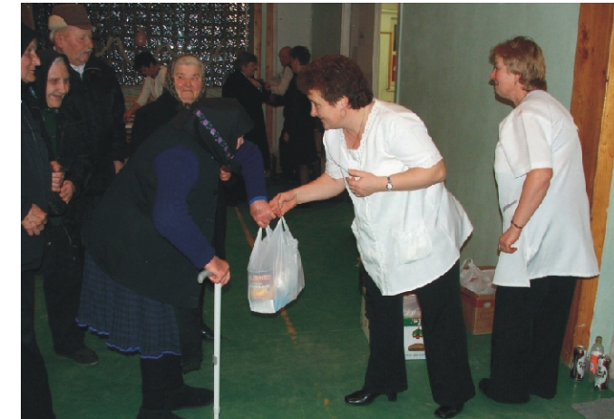
Az idén élelmiszerekből álló ajándécsomagot kaptak az idősök