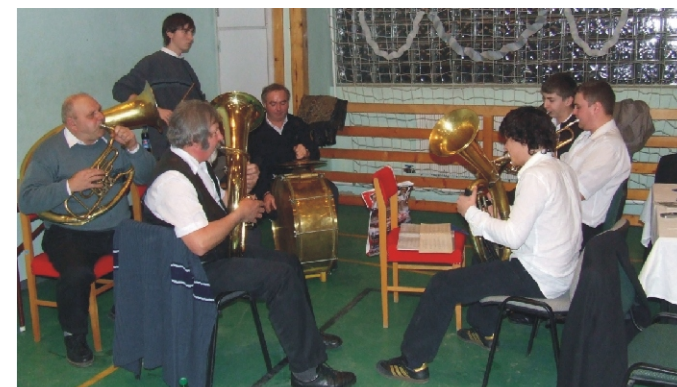
A Rezesbanda is állandó szereplője a farsangnak