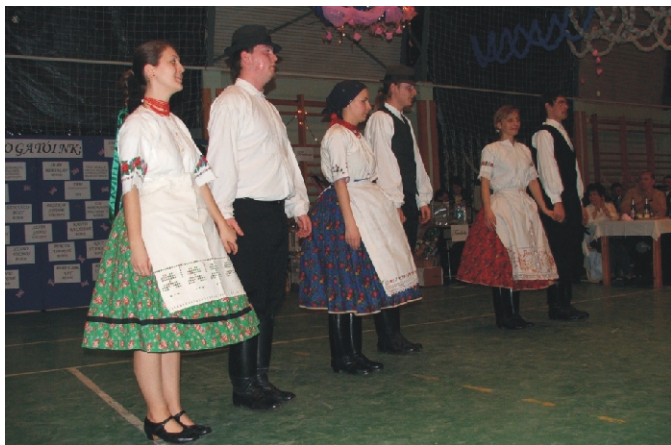
Vendégünk volt az Ágasvár táncgyűttes is