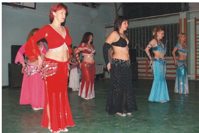
Közönségikert arattak a hastáncosnők