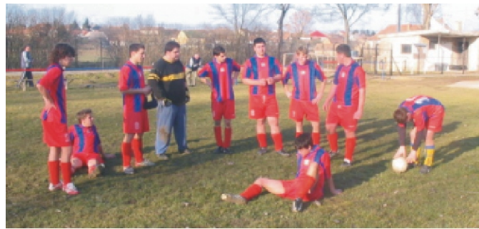
Hogyan tovább a második féléidőben?

Sportszerű mérkőzésen helyzet mindkét csapat előtt adódott, a döntetlen igazságosabb lett volna.