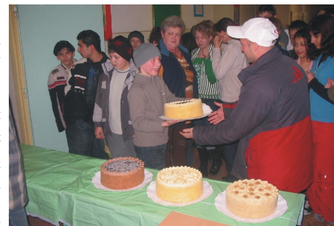
A győztes hetedik osztály képviselője elsőként veszi át a tortát