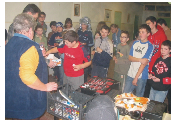
A tombola sorsolás