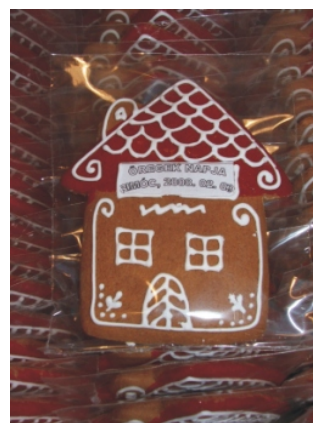
Mézeskalács házikót is kaptak emlékül az idősök

Községünkben, ezévbén február 3-án került megrendezésre 7. alkalommal az Idősök Farsangja.