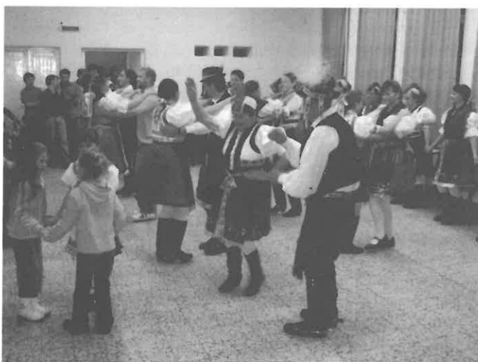
Mindenki jól érezte magát.

hagyományörző csoportok, a Kobak Egyesület és még sok-sok intézményi dolgozó, magánszemély tett a programok sikeres megvalósításáért.