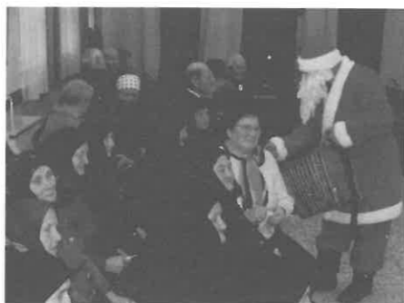
A Mikulás szaloncukorosztás közben.