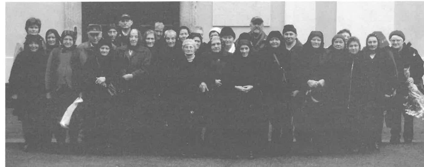
Csoportkép a templom előtt.

A szentmise után félve kérdeztem meg, hogy van-e még kedvük megnézni a salgótarjáni Bányamúzeumot, de az idősek szívesen vállalták a nem kis túrát az egykori szénbánya barlangjában.