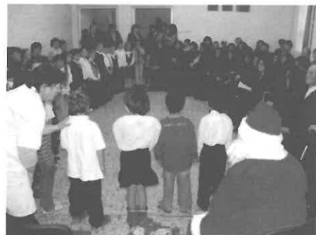
A gyerekek és az idősek együtt várták a Mikulást.