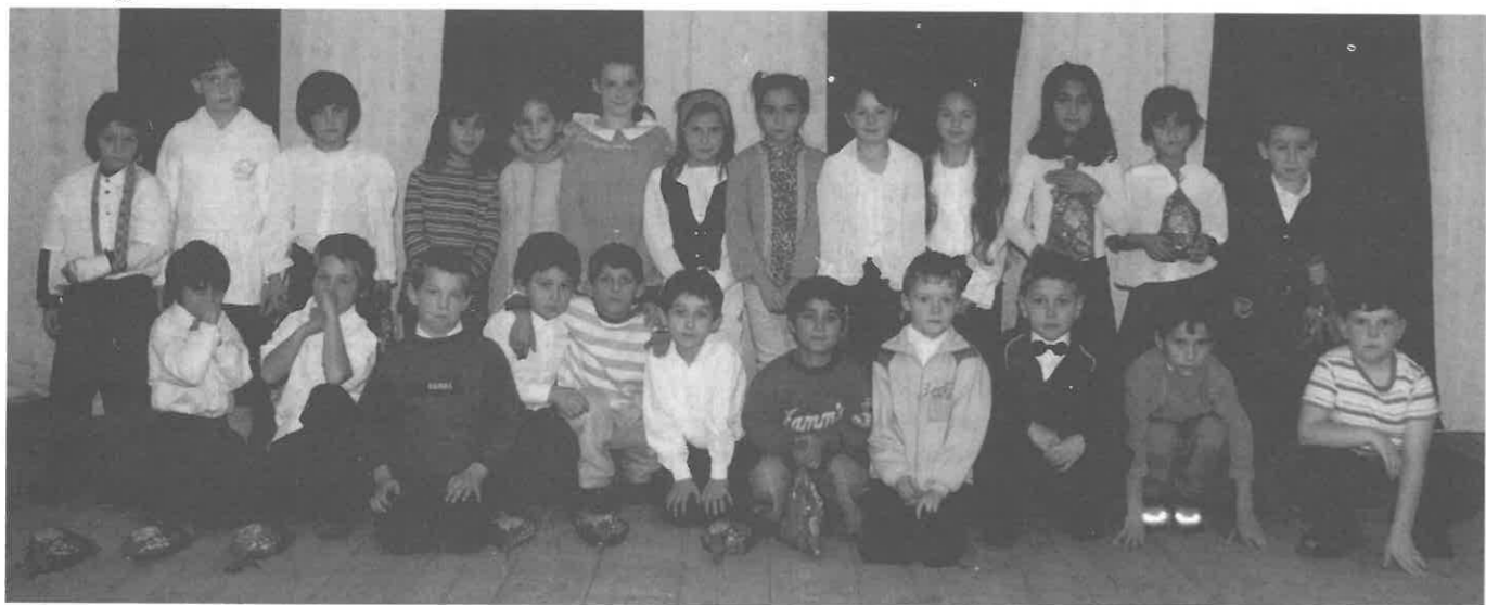
A műsort adó első osztályosok.