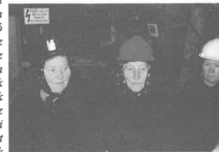
Kötelező volt a sisak használata.