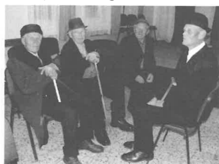
A barátok örültek a viszontlátásnak.