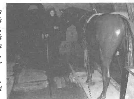
A bányászló még nyerített is a rimóciaknak.