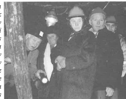
Az idegenvezető valamikor a bányában dolgozott.