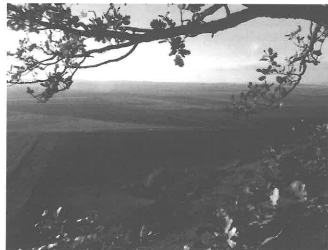
Első helyezett - 1. kép