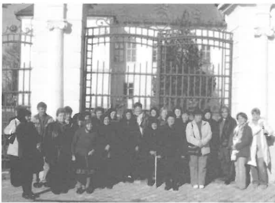
A felújított kastély előtt.

Mint már arról beszámoltunk újságunk hasábjain is a Szécsény Kistérség Önkormányzatainak Többcélú Társulása az Önkormányzati és Területfejlesztési Minisztérium Sport Szakállamtitkársága által kiírt pályázaton 200.000 Ft támogatást nyert a címben szereplő célra. Ehhez 50.000 Ft saját erőt kell hozzátennie a társulásnak.