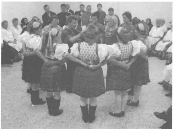
A táncház lépései közben.

November 30-án sikeresen lezajlott a sportnap, jókedvű résztvevőktől volt hangos a sportcsarnok és az iskola.