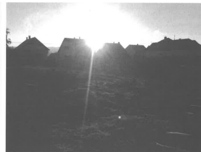
Első helyezett - 3. kép