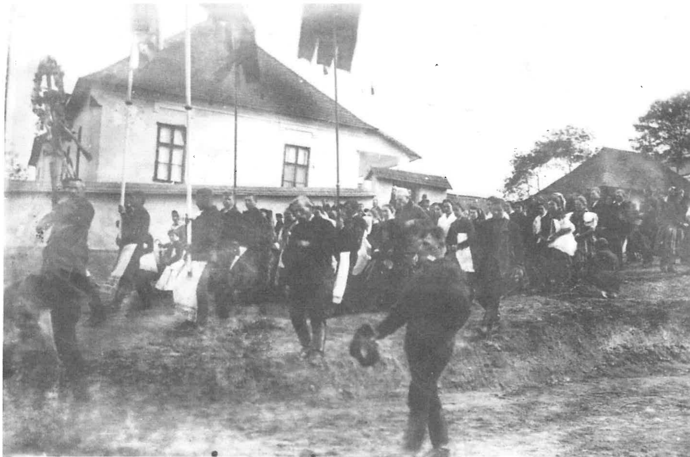
Az 1786-ban épített plébánia az 1930-as években