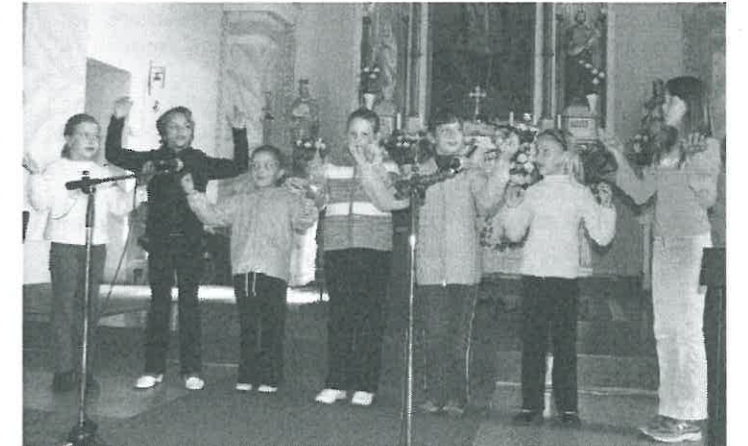
Alsótagozatos gyerekek műsor közben.