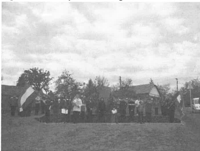
Az általános iskolások műsor közben.

De az eszme el nem bukott. 1956-nak máig tartó üzenete van. Bár Nagy Imrét és mártírtársait halálra ítélték és kivégezték, de az önnön erejére ráébredt nép már nem az a nép volt többé, amelyiket orránál fogva lehet vezetni.