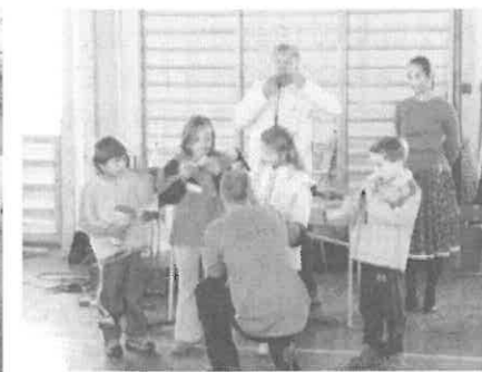
A különféle hangszerek megszólaltatása

mutattak be, majd sorra kerültek elő az érdekes hangszerek. A körtemuzsika, a doromb, a nyenyere, a tülök kipróbálása izgalmas feladat volt az arra vállalkozó gyermekeknek. Botos és üveges tánc lépéseket is kipróbálhattak, majd a legvégén tánc házzal zárult a misszió.