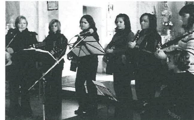
A gitáros csoport nyitotta meg a műsort.

elromlott, az az orgona, melyet már oly sokszor toldozgattak, foltozgattak, javítottak. Ez a hír megdöbbentette és elszomorította a híveket. Mert ugyebár a Szentmise oly különleges, oly felemelő érzést nyújt, főleg ha, hangjával végigkíséri egy orgona.