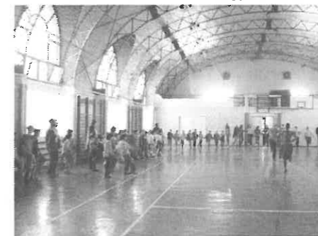
Őszi tánc a Sportsarnokban

Október 17-én közel 110 gyermek várta őket nagy izgalommal. A bemutatkozás után Somogyi táncot