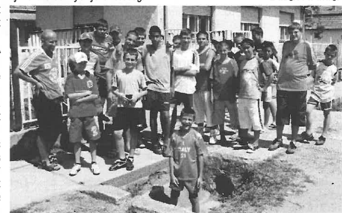
A tábor résztvevői