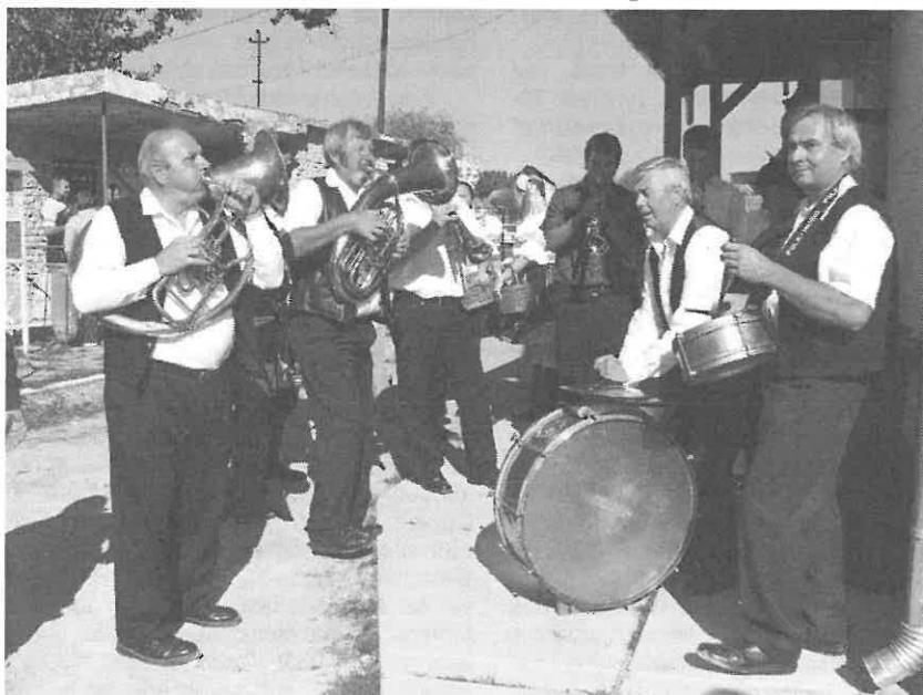
A rimóci rezesbanda