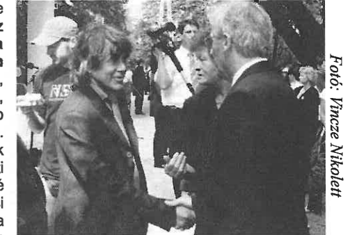
Beszkid Andor polgármester úr és Sólyom László köztársasági elnök

Azt kívánom nektek, hogy majd ti is így érezzetek iskolátok iránt!”