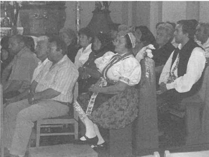
A rimóciak egy része az alsónémedi katolikus templomban