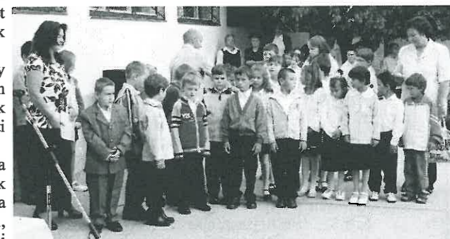
Az első osztályos tanulók és tanítóik