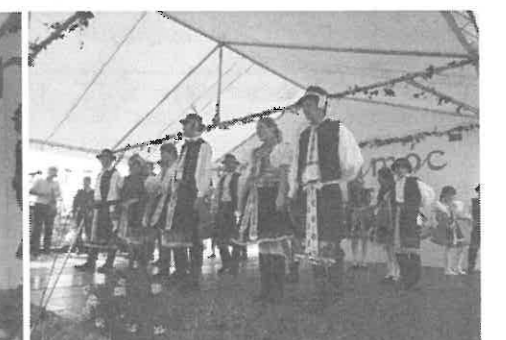
A Gyöngyösbokréta Hagyományörző Egyesület.