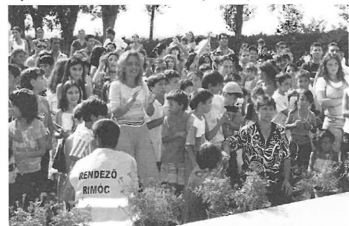
Sokan eljöttek a Romanapra.

A támogatás program címe „A cigányok a táborúzt körül” címmel, amely nagyon jól sikerült. Inyccsiklandozó programok voltak, először is foci torna, futás és sok minden egyéb. Utána vers, külön kiemelném a varsányi gyerekeket, akik nagyon ügyesek voltak, majd tánc következett, 1 évestől 70 éves korig, közben ebéd. Sertés pörkölt burgonyával romásan. Utána házaspárok mutatták be tánctudásukat egy verseny keretében, a legjobbakat díjaztuk. Majd eredményhirdetés és két kupa átadása következett. Az egyik kupát a sportegyesület ajánlotta fel. Köszönjük a kisebbség nevében. Majd tombolahúzás vette kezdetét sok-sok nyeresémmel.