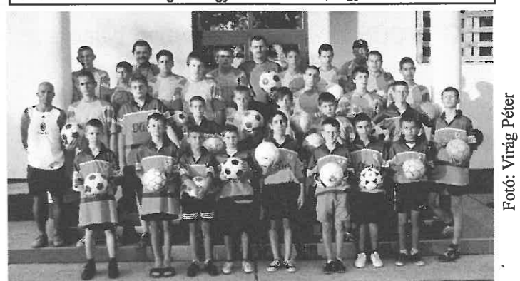
A tábor résztvevői.

A következő számban további élménybeszámolókat a focitáborról.