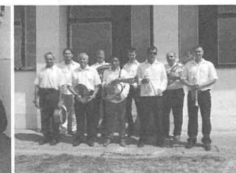
A Rimóci Rezesbanda fellépés előtt.