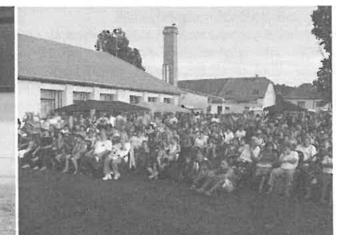
A helyieken kívül sok vendég is ellátogatott falunapunkra.