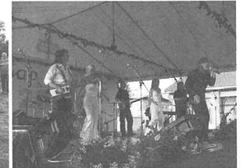
A Komorán élő koncertje nagy sikert aratott.