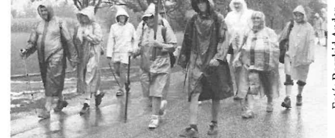
A idő sajnos nem kedvezett a zarándokoknak.