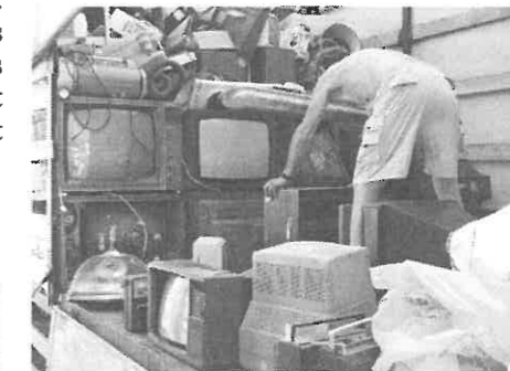
Az elszállított hulladékok a teherautóra pakolás közben. Köszönet a hozzánk eljuttatott flakonokért és alu-dobozokért! Kérjük, aki szívesen csatlakozik akciónkhoz, keresse meg egyesületünk valamelyik tagját, és megbeszéljük a háztól történő

Nagyon jó érzés, hogy egyre többen keresik meg tagjainkat, és kérdezik a hulladékgyűjtés módját, majd el is hozzák nekünk. Ezzel nemcsak környezetünkért tesznek, hanem minket is támogatnak. A mostani átvételért, egyesületünk közel 11.000 Ft-ot kapott. Ezt az összeget továbbra is céljaink elérésére fogjuk fordítani.