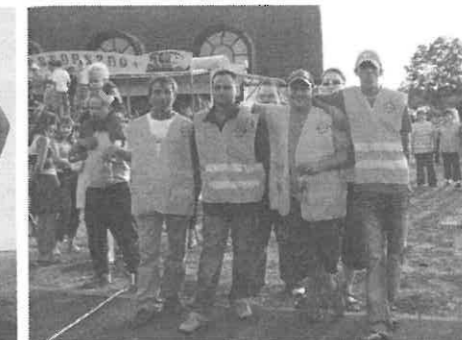
A polgárőrség biztosította a rendezvényeket.