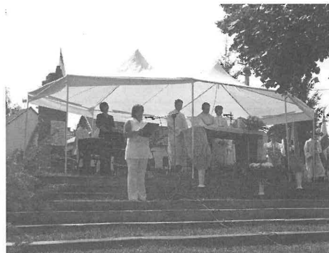
Móra Ferenc novellája sokakat meghatott.

(Elhangzott Kaluzsa Mónika előadásában az új kenyér megáldása előtt.)