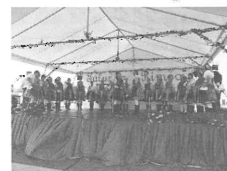
A Rimóci Hagyományörző Együttes műsor közben.