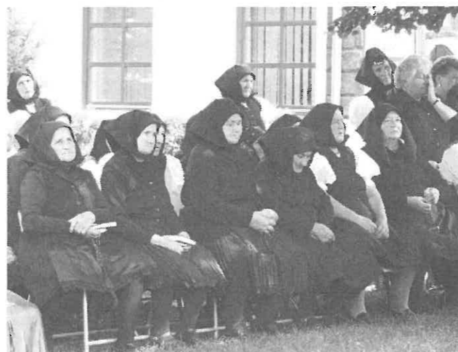
Aki csak tehette az árnyékba húzódt.

Bezzeg nem fűjt a szél aratáskor. Sütött a nap, mint a fűtött kemence, hullott a verejték, mint az eső, szédelgett a két testvér, mint a beteg. Külön kellett leszakajtani minden szál búzácskát, kézzel kipergetni minden kalászat, s utójára se lett több az egész termés egy-egy zsák búzánál. Szép holdvilágos este volt, mikor a fiatalabb testvér bekötötte a zsákját a tarlón. De ki is nyitotta mindjárt, felét kiöntötte a szétré, és csak a másik felét hagyta a zsákban.