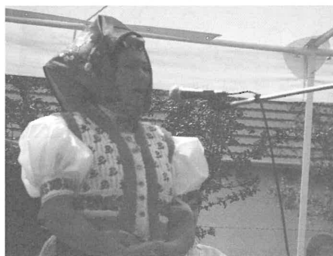
Margit néni éneke messzire elszállt.

- Hát azzal mit akarsz? - kérdezte a felesége.