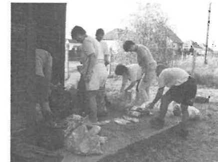
A flakonok és az alu-dobozok taposása közben.

A tavalyi országos alumíniumdoboz-gyűjtő verseny adta az ötletet, hogy a gyűjtést folytatni kell, ha már elkezdődött, és mi is hozzászoktunk. Felkerestük hát a céget, aki a verseny után elszállította a dobozokat, hogy milyen feltételekkel és hová szállítják el a hulladékot. Sikerült is megegyezni, hogy az alumínium dobozokon kívül a Pet-flakonokat és a már összegyűjtött elektromos hulladékot is elszállítják, ártalmatlanítják a káros anyagoktól. Mindezekért aug. 16-án Egerből el is jöttek településünkre, és elvittek kis falunkból 462 kg Pet-flakont (több mint 120 zsák), 91 kg Alu-dobozt (több mint 20 zsák) és jó sok elektromos hulladékot.