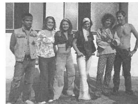
A rimóci "hippi" nem izgultak az előadás előtt.

Nagyszerű falunapon vettünk részt. Mivel szeretjük a Komorán zenéjét számunkra fantasztikus élmény volt az élő koncert.