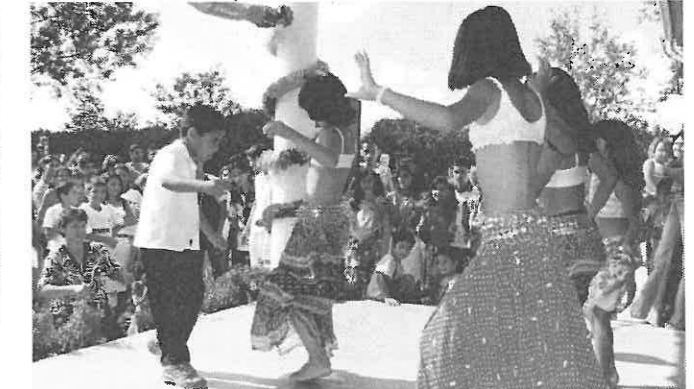
Gyerekek a műsor közben.