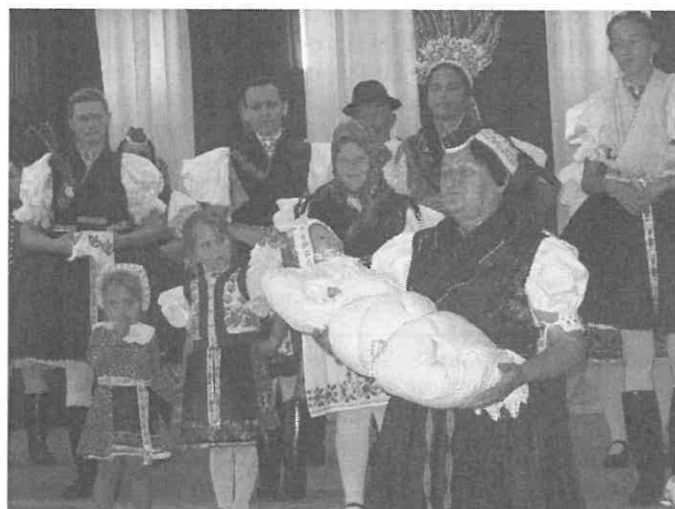
„Bölcsőtől a sírig” rimóci népviseletbemutató.