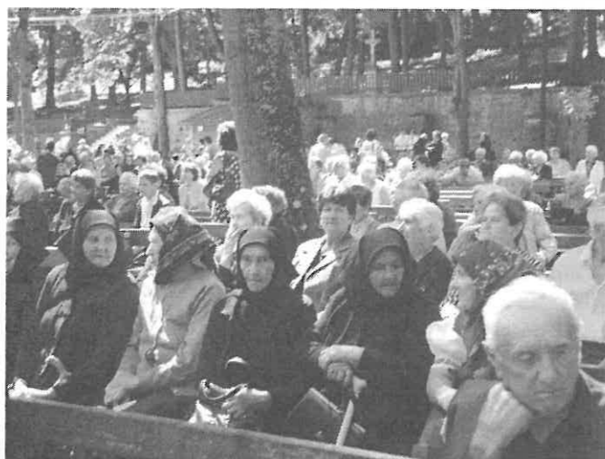
A rimóci idősek egy része a Szentkútnál.