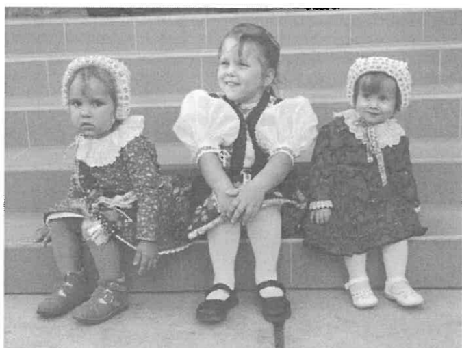
A három legkisebb rimóci népviseletbe öltözött gyermek.

A tavalyi országos alumíniumdoboz-gyűjtő verseny adta az ötletet, hogy a gyűjtést folytatni kell, ha már elkezdődött, és mi is hozzászoktunk. Felkerestük hát a céget, aki a verseny után elszállította a dobozokat, hogy milyen feltételekkel és hová szállítják el a hulladékot. Sikerült is megegyezni, hogy az alumínium dobozokon kívül a Pet-flakonokat és a már összegyűjtött elektromos hulladékot is elszállítják, ártalmatlanítják a káros anyagoktól. Mindezekért aug. 16-án Egerből el is jöttek településünkre, és elvittek kis falunkból 462 kg Pet-flakont (több mint 120 zsák), 91 kg Alu-dobozt (több mint 20 zsák) és jó sok elektromos hulladékot.