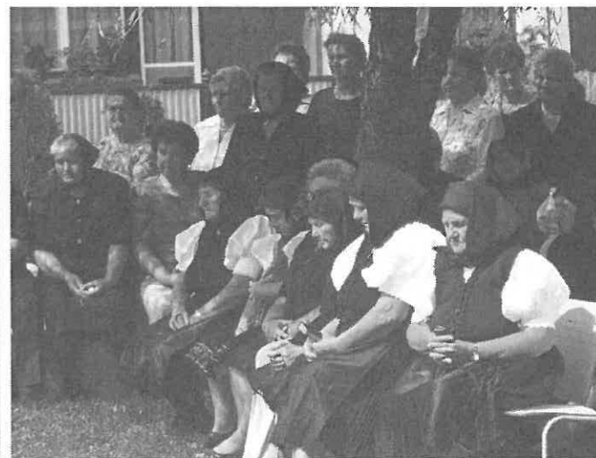
A meleg ellenére sokan eljöttek a szabadtéri szentmisére.