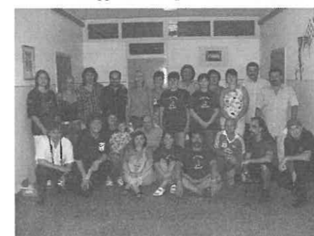
A Komorán és a Kobak tagjai.