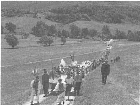
Úton a Gyürki-hegyre a kereszthez.