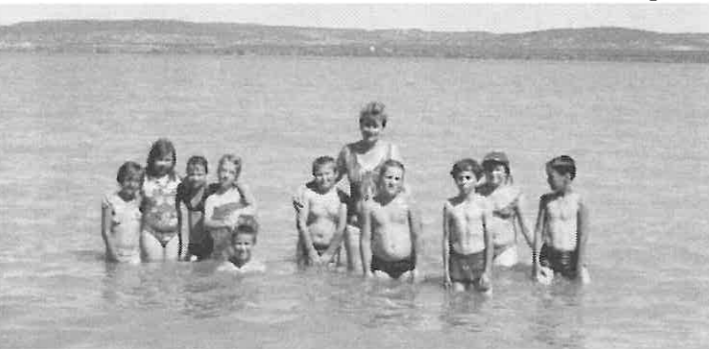
Sokan először fürödtek a Balatonban.