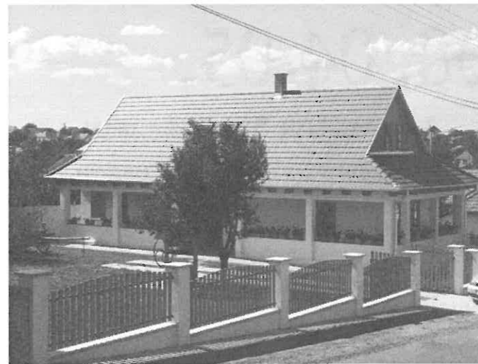
Az elkészült vendégház.