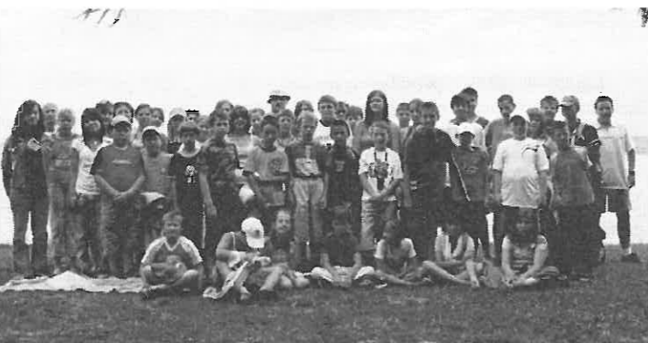
Ennyien voltunk a Balaton partján.