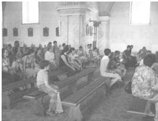
Együtt a templomban.

Láthatták például pénteken a játékba belemelegedett gyerekeket, hallhatták a harsány nevetést az iskola udvarán. Azt azonban nem mindenki láthatta, hogy egy rövid kiscsoportos beszélgetésben „vagány” kisserák elcsendesültek, mikor arról beszélgettünk, hogy az Isten mindenkit úgy szeret, ahogyan van. Az esti szentmisén pedig, úgy hallottuk, hangosabb volt az ének, mint más gitáros szentmisén, mert több mint 40 gyerek hangja kísérete a gitárokat. Megható volt a szentségimádás, mert a legtöbb gyereknek idáig csak azt jelentette a szó, hogy muszáj csendben lenni, és unalmas semmittevés az egész.