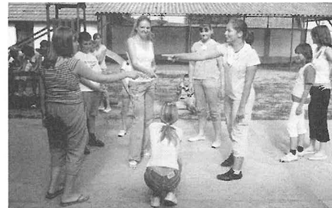
Néhány résztvevő játék közben.