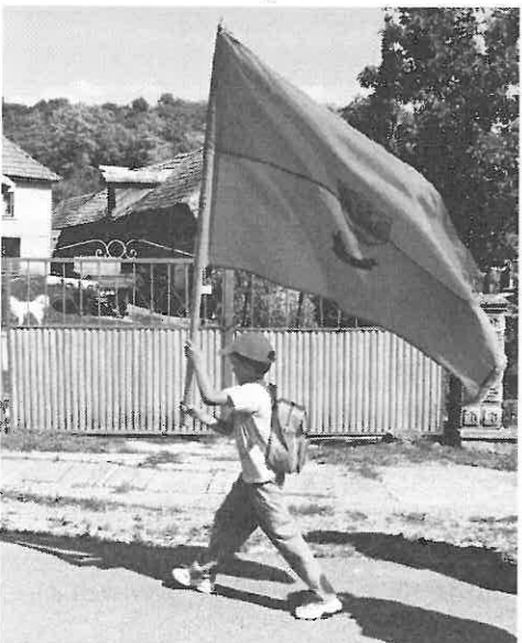
A legkisebb gyalogbúcsús, Beszkid Mátys 7 évesen a rimóci zászlóval.