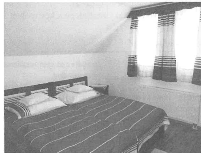
A vendégház belülről, a Hevesi Háziipari Szövetkezet által készített ágyneművel, függönyökkel.