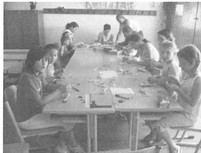
A kézműves foglalkozás is jó volt.

Új kezdeményezés volt a Rimóci Ifjúsági Közösség részéről az elmúlt évben a Plébániai Játszóházas Nap elindítása. Mivel olyan jól sikerült ez első, az idén júliusban mindjárt kétnaposra is bővítettük. 13-a délután 15 órától másnap 16.00 óráig tartottak a programok. Mint a beszámolómban általában, most nekem is arról kellene írnom közösségünk nevében, hogy miként követték egymást a programok, hányan voltunk, mit csináltunk, ki milyen programmal készült, ki miben segített... De nézzék el most nekem a formabontó cikket, mert akárhogy is igyekeznék tárgyilagos maradni, úgy érzem, elfogult vagyok. A gyerekekkel szemben. Adatok, tények helyett leginkább arról számolnék be, amit a szervezőkkel egyetemben tapasztaltam, illetve amit a programokon résztvevő felnőttek is láthattak.