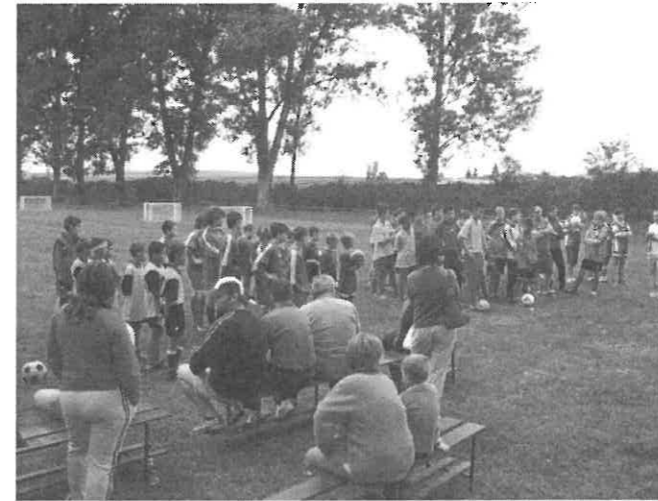
Az I. Rimóci Focitábor eredményhirdetése

2007 június 27. szerdán, talán furcsának is találhatták volna a rimóciak a focipálya körül gyülekező sok fiatalt, ha látják őket. A fiatalok – köztük jómagam is - az I. Rimóci Focitáborhoz gyülekeztünk. 20 fő reggel 8 óra körül érkezett a futballpályára és a sportöltöző területére. Jöttek – a rimóciakon kívül - Szécsényből, Nagylócról és Ludányhalásziból is focizni és szórakozni vágyó gyerekek 8-14 éves korosztályban.