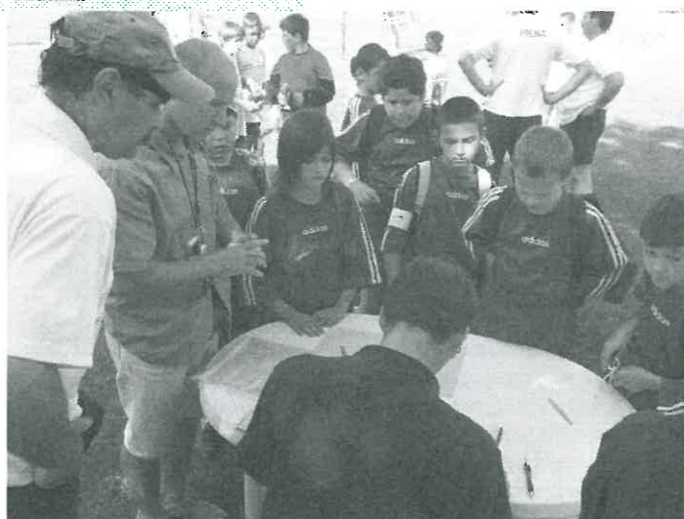
Regisztráció és igazoltatás