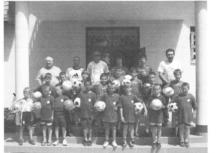
Az I. Rimóci Focitábor résztvevői