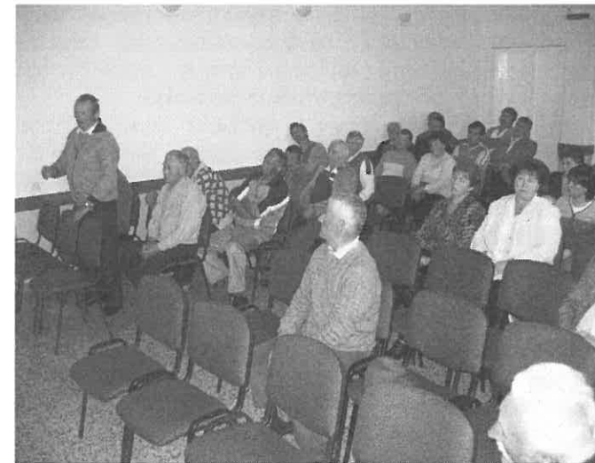
A falugyűlés résztvevői