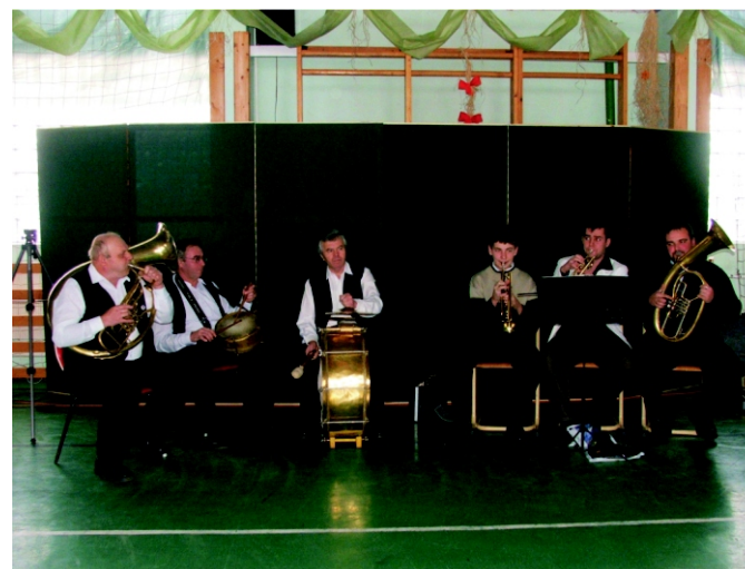
A Rezesbanda „csalogatta” a vendégeket.