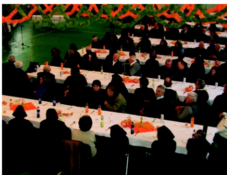
Községünkben a 237 idős ember közül:

Reméljük, hogy e szép rendezvény, mely ma már hagyomány az elkövetkezendő években is folytatódni fog.