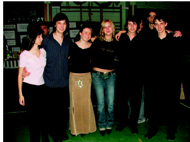
A fiatalok is jól érezték magukat.

Nagyon sajnálom, hogy a zenekar technikai gondjai az éjfél előtti hangulatra úgy rányomta bélyegét. Bizom benne, hogy akik az idén először vettek részt a bálon, azoknak nem szegte a kedvét és jövőre ismét megtisztelik jelenlétükkel ezt a rendezvényt.