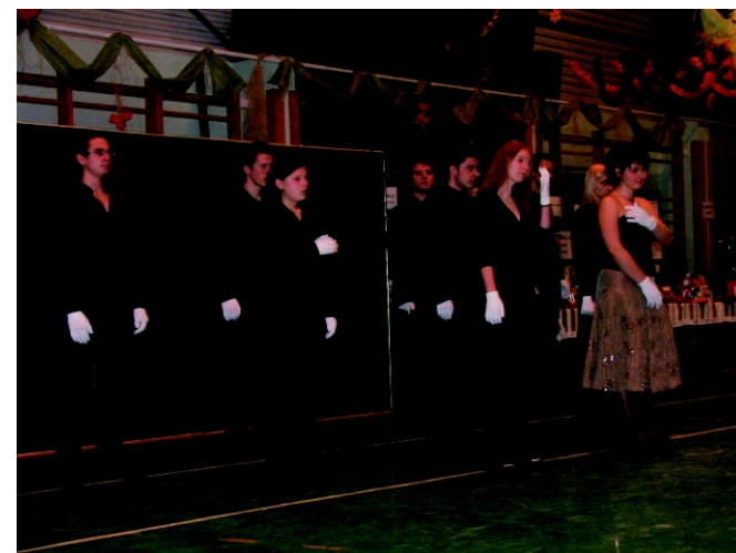
Az „aranyos-diákok” igazi különlegességet adtak elő.