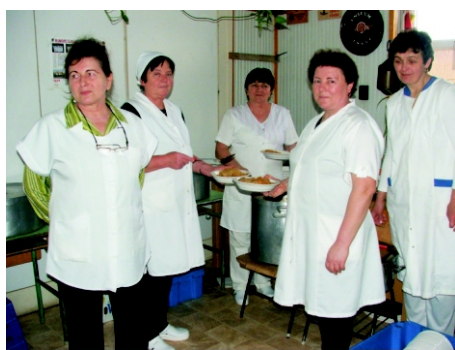
Kívánunk nekik erőt, egészséget, hosszú, békés, boldog éveket!