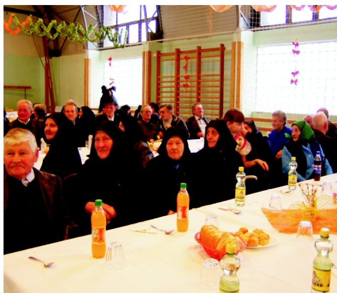
A vendégek a műsor közben.