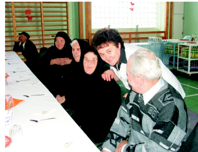
Érdeklődve, izgalommal várták a délutánt.