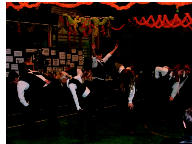
A szécsényi óvodás gyerekek szülei, a Oick Team csapata.