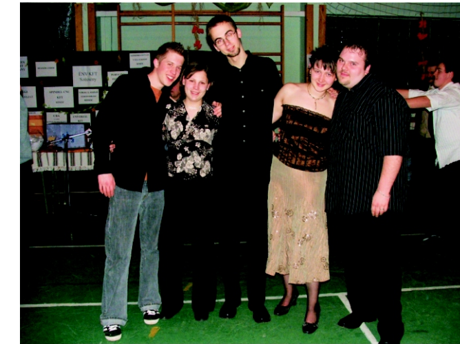
A „vendégfiatalok” a szereplés után hajnalig mulattak.