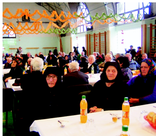
Az előadást mindenki figyelemmel kísérte.