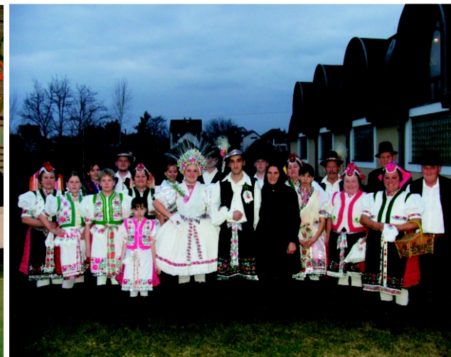
A Rimóci Hagyományörző Együttes műsor után.