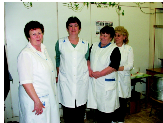
Az óvodai dolgozók készítették a finom vacsorát.

Jó látni azt, hogy a már megszokott arcok mellett évről évre egyre több rimóci fiatal is magáénak érzi ezt a rendezvényt és szép számmal részt vesznek a színvonalas szórakozás reményében, amiért a szervezők mindent el is követnek.