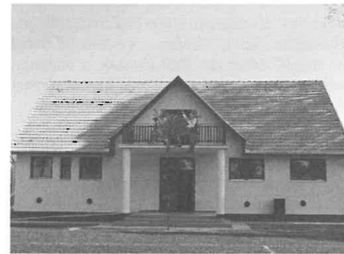
Az átadásra kész öltöző