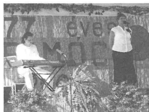
A doktor néni meglepetése nagy sikert aratott.