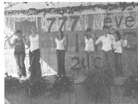
Az általános iskola felső tagozatos diákjai.