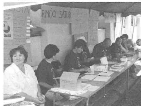
A rimóci sátornál mindenki regisztrálhatta magát.