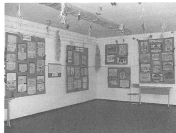
A gyerekek mellett idősebbek is készültek a rajzversenyre.

A 2006. augusztus 24-től 27-ig a 3x7-es szám jegyében zajló rendezvénysorozat egyik színtestje volt a rajzpályázat meghirdetése, melyen a mindennapi életet, a község nevezetes, jellegzetes épületeit, eseményeit gyermekek és felnőttek szemszögéből egyaránt szerettük volna látni és láttatni mi, szervezők. A várakozásokat messze meghaladó számú alkotás született és érkezett.