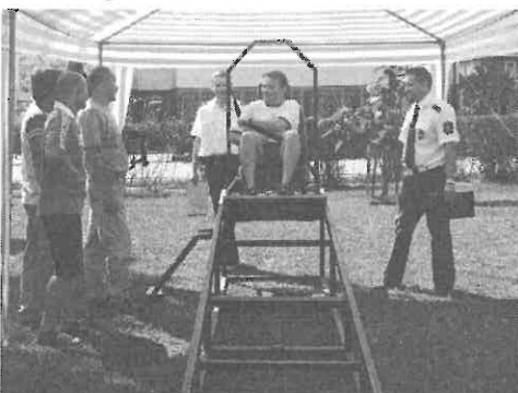
Az ütközés szimulátort csak a legbátrabbak merték kipróbálni.