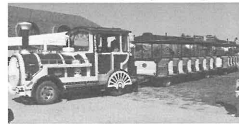
Sokak kedvence lett a kis vonat.