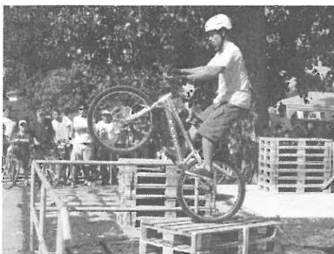
A közönséget ámulatba ejtette a kerékpáros bemutató.