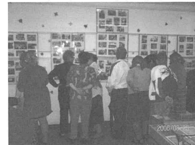
Nagy sikert arattak a képkiallítások.