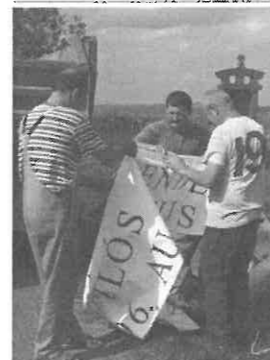
A „felirat” felállítás.