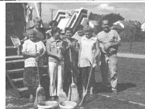
Asszonyaink ügyeltek a tisztaságra.