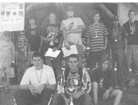
A sportnap legjobbjai.

Vasárnap reggel a térség tudatta mindenkivel, hogy a sportnap kezdetét vette. Öröm volt látni, hogy a rendezvényen rimóci résztvevők mellett a környező települések versenyzői is rész vettek. Az igen jó hangulatú sportversenyen a résztvevők ügyességi kerékpárversenyben, kerékpáros és motoros terepbajnokságban versenyeztek a díszes tiszteletdíjak, ajándékok elnyeréséért.