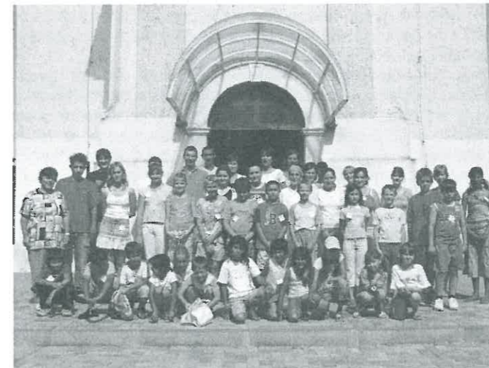
A résztvevők egy csoportja, akik megvárták a záró áldást is.

Egyszer volt, hol nem volt, volt egyszer néhány fiatal, akik úgy gondolták, játszani jó, Istennek tetszően még jobb. Elhatározták hát, hogy szerveznek egy Játszóházas napot, ahol ezt meg is mutatják mindenkinek, aki eljön a meghívásukra. Jöttek is a népek hetedhét határról, a rimóci patak mindkét partjáról, a regisztrációs bizottság alig győzte tintával. A végére majdnem 70 név állt a papiroson! Volt is nagy hangzavar az udvaron, amikor az ügyességi játékok a kezdetét vették! Örültek a gyerekek, a szüleik, de még a plébános urunk is, amikor sikerült győzedelmeskedni egy - egy vitézi próbán. Jókívámban aztán minden ottlévő nekiállt ügyeskedni a kézművesek asztalánál. Készültek itt csodadolgok: papírból virágok, tojástartóból állatok, magvakból faliképek, gyufából kereszték, és a Jóisten tudná